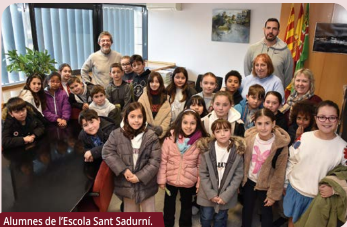
Alumnes de l'Escola Sant Sadurní.

► Sessions d'Estudis Montornesencs. El Centre d'Estudis de Montornès del Vallès (CEMV) ha presentat el quart volum de la sèrie, que recull les ponències del 2024 i 2025. |