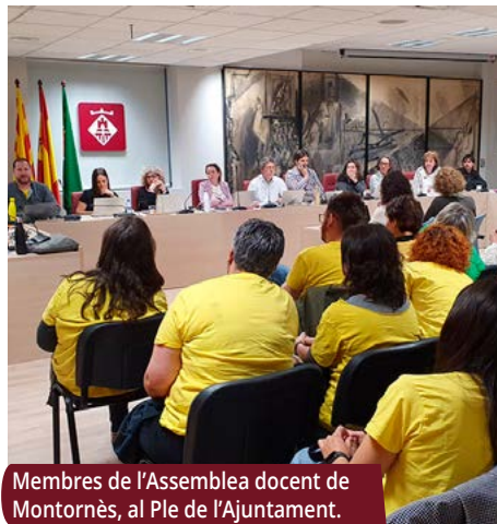
Membres de l'Assemblea docent de Montornès, al Ple de l'Ajuntament.

El Ple municipal ha aprovat en la sessió de maig una moció de suport al col·lectiu docent mobilitzat per reivindicar, entre altres, la reversió de la sobrecàrrega de treball per poder oferir un servei de qualitat a l'alumnat, la disminució de la burocràcia dins de la feina, i la recuperació del poder adquisitiu i la millora de salaris.