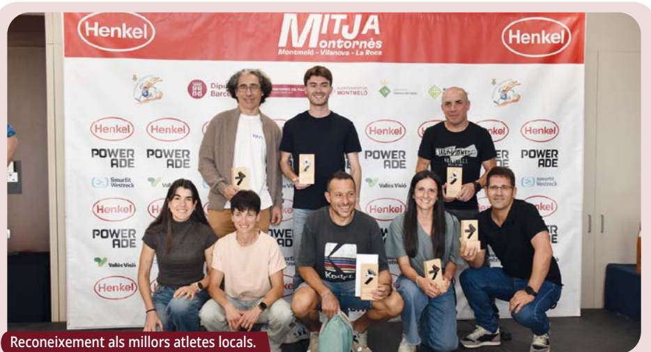
Reconeixement als millors atletes locals.

Darrers actes de la 31a Mitja. Com cada any, s'ha fet un reconeixement a les primeres persones de cada poble que van creuar la línia de meta. Henkel ha entregat un xec de 5.600 € a la Creu Roja de Granollers, a partir dels 2 € per inscripció, les imatges del photocall i els beneficis de la Mini Solidària.