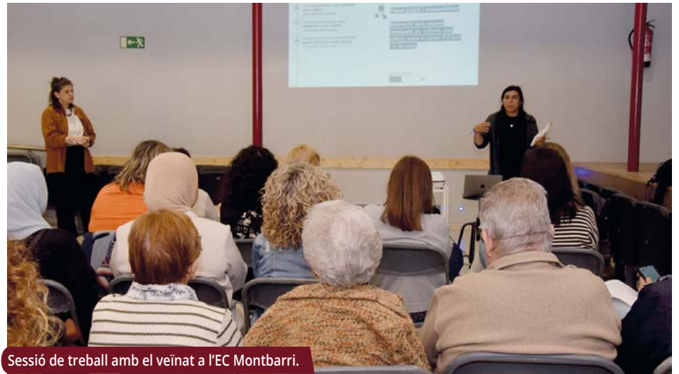
Sessió de treball amb el veïnat a l'EC Montbarri.

Una trentena de persones, de diferents edats i orígens, han pres part en el procés participatiu per definir el projecte que l'Ajuntament presentarà a la nova convocatòria del Pla de Barris i Viles de la Generalitat.