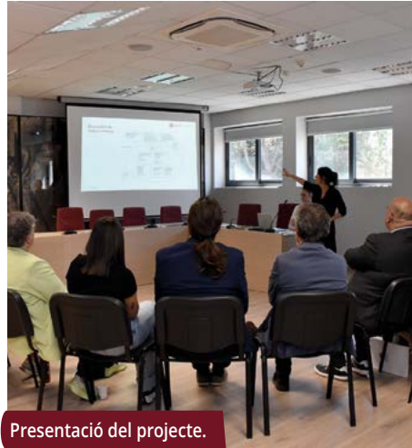
Presentació del projecte.

A més de definir objectius i accions, la Xarxa Montornès Orienta posa l'èmfasi en prevenir la desafecció escolar amb orientació i acompanyament individualitzat dels i les joves i de les seves famílies, des de l'educació primària fins