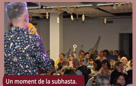
Un moment de la subhasta.

El Club Handbol Montornès i el Club Patí Montornès també hi van sumar les aportacions reunides amb una guardiola solidària i la venda de polseres. |