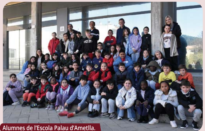
Alumnes de l'Escola Palau d'Ametlla.

Les escoles visiten l'Ajuntament. A finals de febrer, alumnes de 3r de l'Escola Sant Sadurní van visitar la Casa Consistorial. A mitjans de març va ser el torn de l'Escola Palau d'Ametlla. L'alcalde, José A. Montero, els va fer de guia per les dependències municipals. La visita és una de les propostes del catàleg d'activitats que l'Ajuntament ofereix a les escoles. |