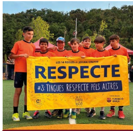
Premi al respecte per a Los Espartanos del Mogent.

Per quart any, el Cruyff Court de Montornès ha repetit com a una de les seues d'aquest campionat promogut per la Fundació Cruyff. A la fase local del 26 d'abril hi van participar 11 equips de nens i nenes de les escoles del poble.