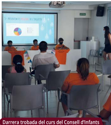
Darrera trobada del curs del Consell d'Infants

El Consell d'Infants ha promogut una enquesta entre nois i noies de 10 a 13 anys per conèixer els seus interessos en l'àmbit de l'oci. Després de valorar les 350 respostes rebudes, s'han proposat quatre activitats que ja s'han programat.