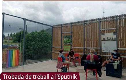
Trobada de treball a l'Sputnik

Els departaments de Joventut i d'Igualtat mantenen trobades periòdiques per millorar la intervenció als espais juvenils en matèria LGBTI+. L'objectiu és que el Satèl·lit i l'Sputnik siguin veritables espais "LGBTfriendly", és a dir, respectuosos amb la diversitat sexual i segurs per a les persones LGBTI+.