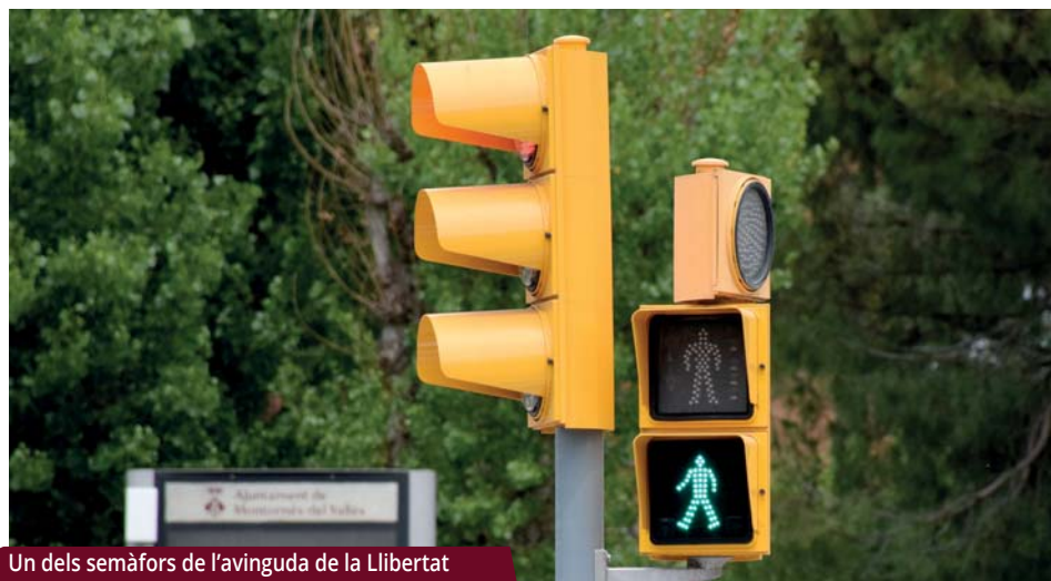
Un dels semàfors de l'avinguda de la Llibertat

L'Ajuntament ha substituït les òptiques dels semàfors de totes les cruïlles i hi ha afegit dispositius amb senyals acústics per a persones invidents.