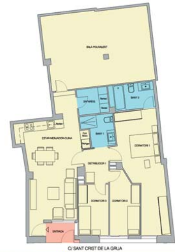
C/ SANT CRIST DE LA GRAJA

OBRA NUEVA - 57m 2 construidos, zona de la Iglesia. Consta de comedor-cocina americana, 2 habitaciones (1 doble, 1 individual), baño completo con ducha, suelo de parquet y gres, puertas lacadas en blanco, ventanas de aluminio, bomba frío/calor, fincas semi-nueva, reformado, zona muy tranquila. Orientación sur. TRASTERO INCLUIDO DE 8m 2 . VEN A VISITARLO!!