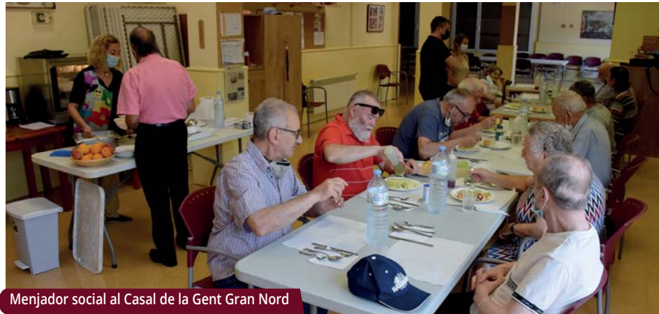
Menjador social al Casal de la Gent Gran Nord

S'han tornat a realitzar tallers de memòria, intercanvis generacionals amb infants i joves, i s'ha reprès el menjador social presencial.