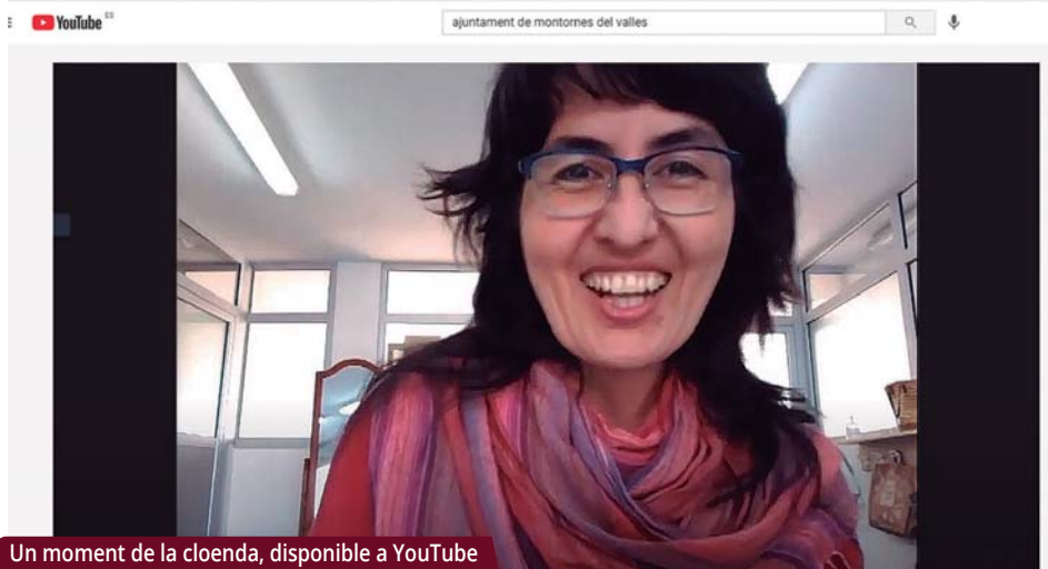
Un moment de la cloenda, disponible a YouTube

La iniciativa s'ha desenvolupat per tercera vegada amb l'impuls del departament municipal d'Ocupació, Promoció Econòmica i Comerç.