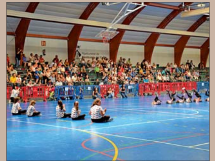
CLOENDA DE LES ACTIVITATS EXTRAESCOLARS DEL CURS 2018-19

Una AMPA és l'associació de mares i pares d'alumnes d'un centre escolar (bressol, primària o secundària). En el seu organigrama preveu els càrrecs de president/a, vicepresident/a, tresorer/a i vocals escollits per la totalitat de pares i mares a través d'una assemblea participativa. La primera de les funcions de l'AMPA és la de representar les famílies del centre; la segona és la de treballar de la mà del centre docent, formant part de la comunitat educativa i millorant d'aquesta manera la participació i el compromís de pares, mares, fills i filles en relació tant amb el món escolar com amb la societat en general. Les AMPA tenen representació dins dels òrgans decisoris (els consells escolars) i és important que aquesta participació sigui proactiva. Altres funcions de les AMPA són l'organització de les activitats extraescolars, les acollides de matí i de tarda, i el servei del menjador escolar. Des d'aquesta entitat també s'organitzen d'activitats formatives i socioculturals que afavoreixen la interrelació entre les famílies i els seus fills/es i amb el personal docent (escola de pares i mares, celebració de festes tradicionals, etc.). Les AMPA, tot i que les persones que hi participen de forma activa ho fan de manera totalment voluntària i altruista, reben de les famílies una quota mensual o anual que es destina a organitzar totes aquestes activitats. Les AMPA són les entitats que ajuden que els pares i mares puguin participar en l'educació dels seus fills i filles. |