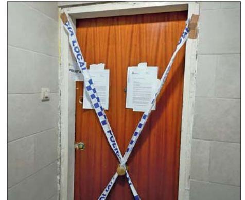
UN DELS PISOS PRECINTATS AL CARRER DE LA LLIBERTAT

Durant els darrers mesos s'han dut a terme tres actuacions pel perill potencial d'incendi per connexions irregulars a les xarxes de subministraments de diversos immobles. Les actuacions s'han fet al nucli antic i al carrer de la Llibertat. Un operatiu coordinat de la Policia Local i els Mossos d'Esquadra ha dut a terme les accions.