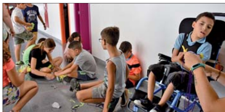
ACTIVITATS INCLUSIVES AL CASAL DE LLEURE

Als Casals municipals, s'hi afegeixen els de les entitats esportives. Enguany n'hi ha del