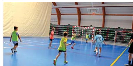
CAMPUS DE L'AE FUTBOL SALA MONTORNÈS