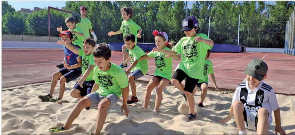
CASAL ESPORTIU AL CEM LES VERNEDES

Més de 700 infants i joves, 56 dels quals amb discapacitat funcional, participen en els casals municipals d'estiu que, any rere any, avancen amb propostes més inclusives i acurades. Enguany, l'equip que se n'ocupa està format per 94 persones, entre monitors, vetlladors i especialistes. Han rebut formació sobre diversitat funcional.