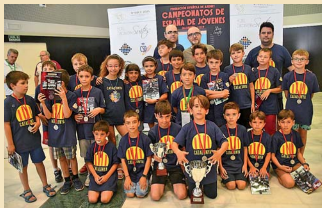
LA DELEGACIÓ CATALANA EN ELS CAMPIONATS D'ESPANYA DE JOVES 2019

Final de temporada a l'alça per al Club Karate Montornès. L'entitat ha culminat una campanya intensa amb participació en competicions locals, estatals i internacionals. |