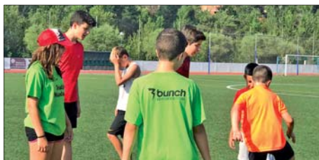
CAMPUS DEL CLUB TRIATLÓ MONTORNÈS

CB Vila de Montornès, amb més de 70 participants, el de l'AE Montornès Futbol Sala, amb més de 20, i el del Club Triatló Montornès, amb prop d'una desena.