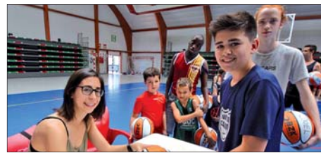
EL CASAL DEL CB VILA HA REBUT LA VISITA D'ESPORTISTES D'ELIT COM GEORGINA BAHÍ

Com cada estiu, l'Ajuntament ha atorgat ajuts a les famílies que no poden assumir el cost de les activitats. Se n'han concedit un total de 147 (62 per al Casal de lleure, 63 per a l'esportiu, 5 per al de bàsquet i 17 per a les colònies). La Fundació Probitas, a més, ha mantingut ajuts per al menjador de 55 infants dels casals municipals i de 6 del Casalet de la Llar d'Infants Pública El Lledoner. Probitas també ha col·laborat per reforçar les activitats dels casals inclusius. |