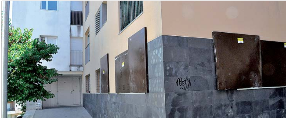
HABITATGES SEGELLATS AL CARRER NOU