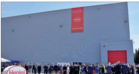
EXTERIOR DE LA NOVA PLANTA DE HENKEL A MONTORNÈS

Henkel ha invertit prop de 35 milions d'euros en la nova planta. Les instal·lacions, situades al Gran Vial, ocupen 14.000 m 2 i disposen d'espais de producció, laboratoris, oficines i magatzem. |