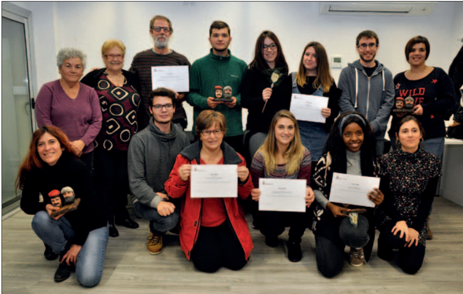
ASSOCIACIONS GUANYADORES DE LA PRIMERA EDICIÓ DELS PREMIS DE RECONeixEMENT A LES ENTITAT SOCIOCULTURALS

L'Esplai Panda, la Colla de Drac i Diables, la Penya Pere Anton, l'Associació Melanin i el grup de teatre La Faràndula han estat els guardonats en els primers Premis de reconeixement a les entitats socioculturals de Montornès.