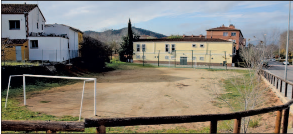
TERRENYS ON S'HA PREVIST UBICAR EL NOU CENTRE JUVENIL

Durant el desembre s'ha impulsat el grup motor de joves que participarà en el disseny final del nou equipament. El nou centre juvenil es construirà en uns terrenys situats entre el carrer del Molí i l'avinguda d'Icària.