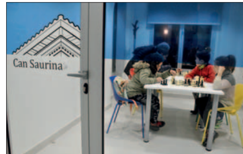
ESPAIS DE REUNIÓ A LA PLANTA BAIXA

Més de 300 persones van visitar el nou equipament cultural de Can Saurina durant les jornades de portes obertes que s'hi van dur a terme el primer i segon dia del mes de desembre.