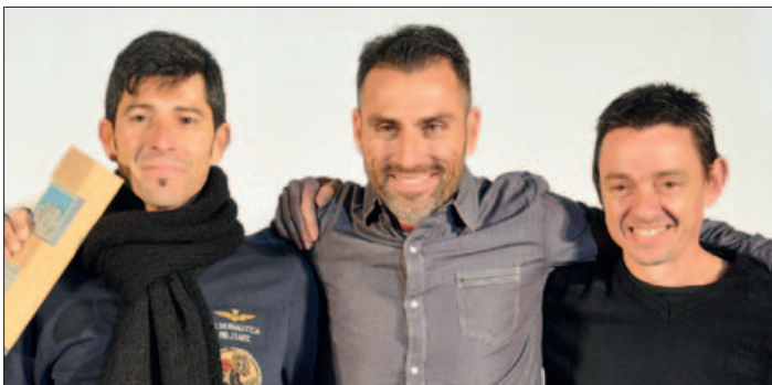
L'EQÜIP VETERÀ MASCULÍ DE CROS DEL CLUB ATLETISME MONTORNÈS, MILLOR EQÜIP SÈNIOR