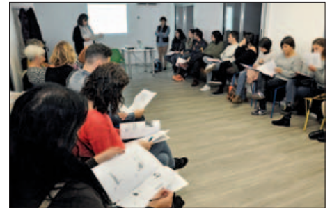
SESSIÓ DE TREBALL DE LA TAULA PER LA IGUALTAT, A L'HOTEL D'ENTITATS

La Taula per la Igualtat ja s'ha posat en moviment. La primera acció del grup ha estat sumar-se a la campanya de sensibilització promoguda per l'Institut Català de les Dones Per una Catalunya lliure de violències sexuals . Demanen que el veïnat també s'hi sumi descarregant-se el cartell de la campanya, fent-se una fotografia i compartint-la a les xarxes socials amb l'etiqueta #JOTAMBÉ i anomenant l'@icdones.