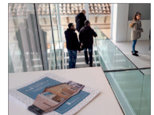
INTERIOR DE L'EDIFICI