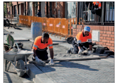
OPERARIS DE LA BRIGADA MUNICIPAL D'OBRES CONTRACTATS A TRAVÉS DELS PLANS D'OCUPACIÓ (IMATGE D'ARXIU)

Durant les darreres setmanes també s'ha convocat la contractació de 7 persones en el marc del programa Treball i Formació, subvencionat pel Servei Públic d'Ocupació de Catalunya. En aquest cas, s'ha tractat de 7 llocs d'operari de neteja i tractament de residus. |