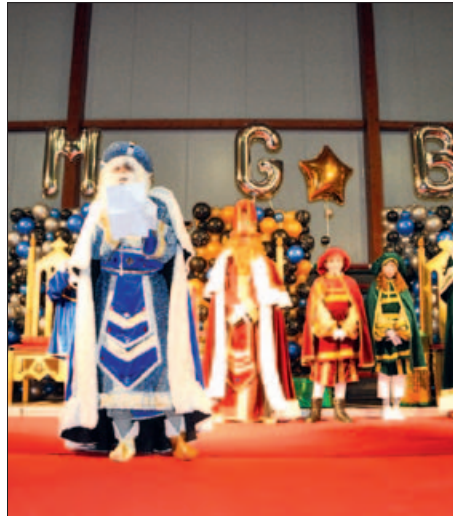
DARRERA VISITA DELS REIS D'ORIENT A MONTORNÈS

El proper 5 de gener els Reis d'Orient passaran per Montornès acompanyats d'una comitiva d'honor. A més de les AMPA de les escoles Sant Sadurní, Palau d'Ametlla, Can Parera, Marinada i l'Escola Municipal de Música, Dansa i Aula de Teatre, enguany participaran en la Cavalcada les colles de Geganters i Diables i les comissions de Festes i de Convivència de Montornès Nord. A més, es repartiran fins a 1.000 kg de caramels tous de comerç just, una iniciativa conjunta dels departaments de Cultura i Festes i Cooperació de l'Ajuntament. La comitiva sortirà a les 17 h des del Casal de Cultura i arribarà a El Sorralet, on els infants que encara no ho hagin fet podran lliurar la carta als reis. |