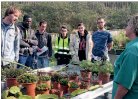
JOVES DEL PROGRAMA ENDAVANT JOVE! AL JARDÍ BOTÀNIC

D'altra banda, els 5 joves del programa integral Endavant Jove! van visitar fa unes setmanes el Jardí Botànic del Parc de Montjuïc per conèixer de primera mà el treball que s'hi fa en jardineria i horticultura. Endavant Jove! és un projecte subvencionat pel Servei Públic d'Ocupació de Catalunya i el Fons Social Europeu. |