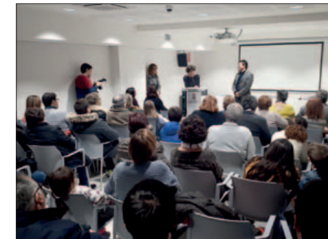
ACTE INSTITUCIONAL DE PRESENTACIÓ A LA SALA 2

Gairebé 330 persones van passar per l'equipament durant les portes obertes celebrades