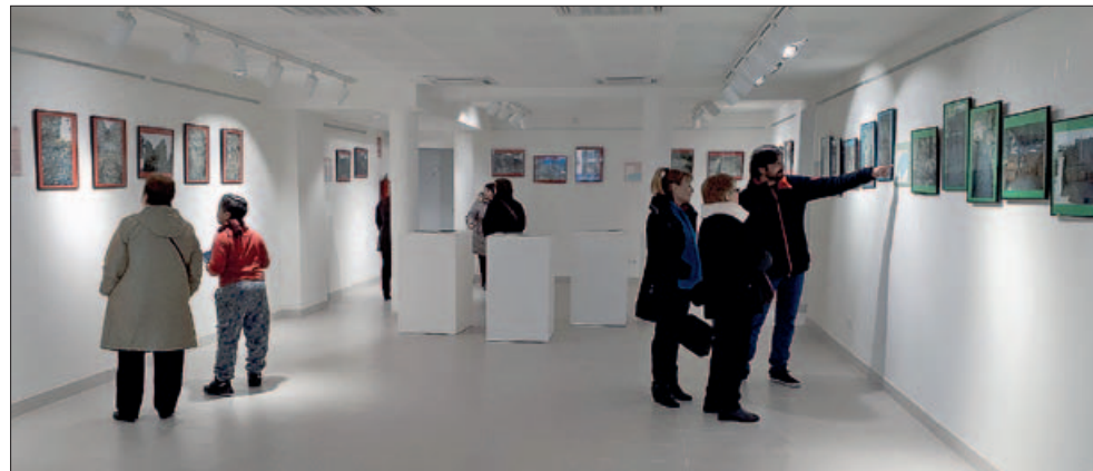
EXPOSICIÓ "ELS SECRETS DEL CASTELL DE SANT MIQUEL. PRIMERA CAMpanyA D'EXCAVACIONS (2016)"