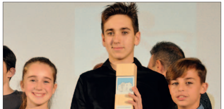
L'EQÜIP INFANTIL KATA MIXTE DEL CLUB KARATE MONTORNÈS, MILLOR EQÜIP INFANTIL