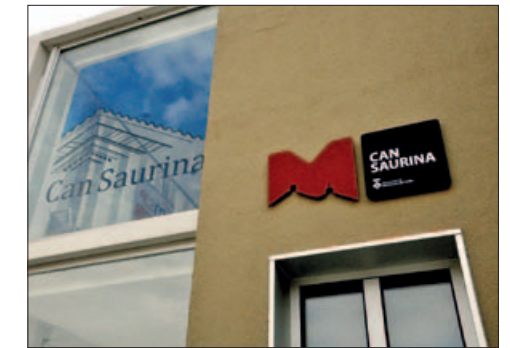
DISTINCIÓ D'EQUIPAMENT MUNICIPAL