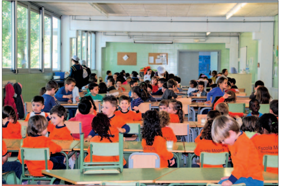
MENJADOR DE L'ESCOLA MOGENT (IMATGE D'ARXIU)

Entitats com la Fundació Probitas de l'empresa Grifols juguen un paper fonamental en el