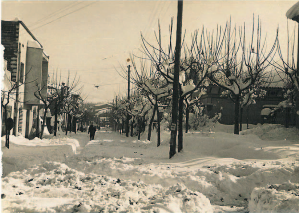
Carrer Major. Nevada de desembre de 1962.

Com és tradició, aquestes festes estimulen els sentiments positius cap els que tenim al voltant i l'enyorança dels qui trobem a faltar. Gaudiu molt, són moments únics.