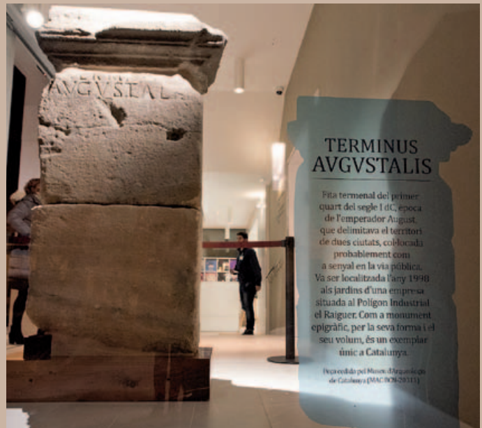
EL TERMINUS AUGUSTALIS A CAN SAURINA

La col·locació d'aquesta pedra de terme s'ha de situar en el