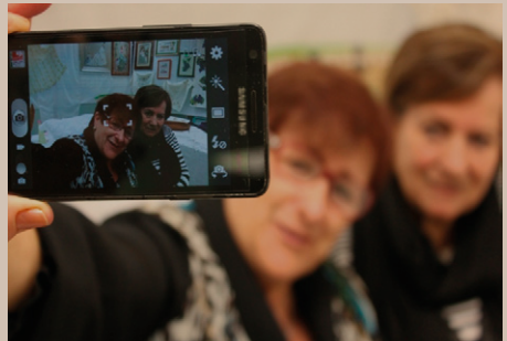
Concurs de foto de Sant Sadurní 2015, primer premi Autor: José Luis Cano Soto

Lloc: Sala Riu Mogent del Casal de Cultura Org. Dept. de Cultura, Festes i Patrimoni