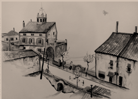
Autor de la il·lustració: Victor Otero

Org. Dept. de Cultura, Festes i Patrimoni