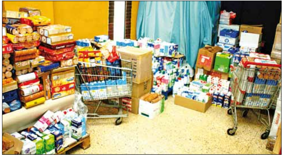
ELS PRODUCTES RECOLLITS DURANT LA CAMPANYA