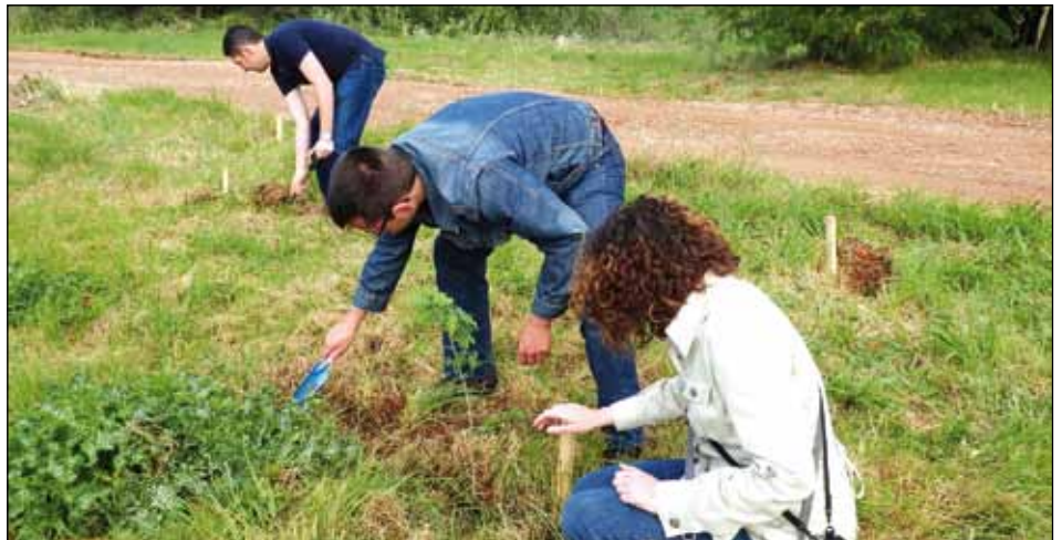
TREBALLADORS DE L'EMPRESA SUMITOMO I ELS SEUS FAMILIARS PLANTANT ARBRES A LA VORA DEL CAMÍ