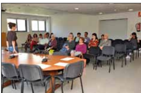
SESSIÓ INFORMATIVA SOBRE LA LLEI DE LA DEPENDÈNCIA