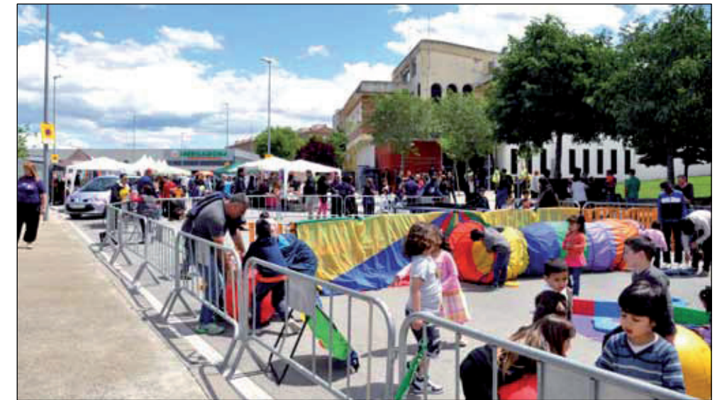
JORNADA FESTIVA. PRESENTACIÓ DE L'ESPAI CULTURAL MONTBARRI (18 DE MAIG DE 2013)

El nom del nou equipament és fruit d'un altre procés de participació. L'Oficina del barri i la comissió d'entitats van proposar denominacions i el vot popular va decidir que es diria Espai Cultural Montbarri. La presentació oficial va servir per organitzar una jornada festiva