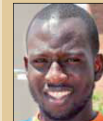
BAHARU DEMBAGA SUSOKO ESPLAI PANDA

grupo de trabajo de comerciantes para colaborar con las entidades y el Ayuntamiento. Hay que participar para y por el barrio. Y los comerciantes también estamos en ello.