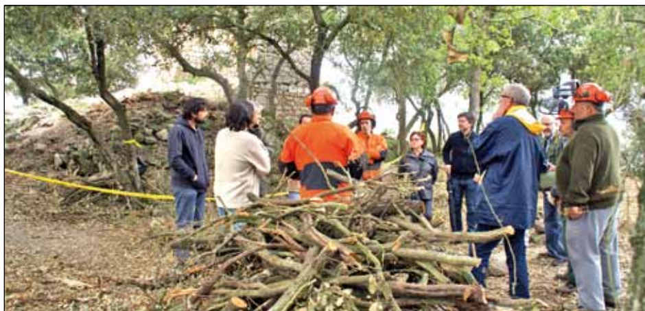
VISITA TÈCNICA AL CASTELL (25 D'ABRIL DE 2013)

Els treballs de desbrossament realitzats darrerament a l'entorn del Castell i la Capella de Sant Miquel han permès posar al descobert algunes de les seves estructures originals. La Generalitat està duent a terme un estudi topogràfic per a possibilitar futures actuacions de recuperació i ús de l'espai