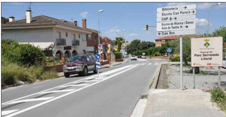
OBRES DE MILLORA DE LA SEGURETAT A L'AVINGUDA DE L'ONZE DE SETEMBRE

D'altra banda, també al mes de maig, la Diputació va posar en marxa les obres de millora de la seguretat en el tram comprès entre l'avinguda de la Llibertat i la zona propera a Ca l'Ametller, entre el punt quilomètric 18'17 i el 18'6 de la BV 5001, amb l'objectiu de reduir la velocitat dels vehicles que accedeixen al nucli urbà. El projecte ha inclòs la implantació de bandes transversals d'alerta i la reducció de la secció transversal de la calçada. S'ha construït un illot central a la via i s'ha senyalitzat un tram amb pintura. |