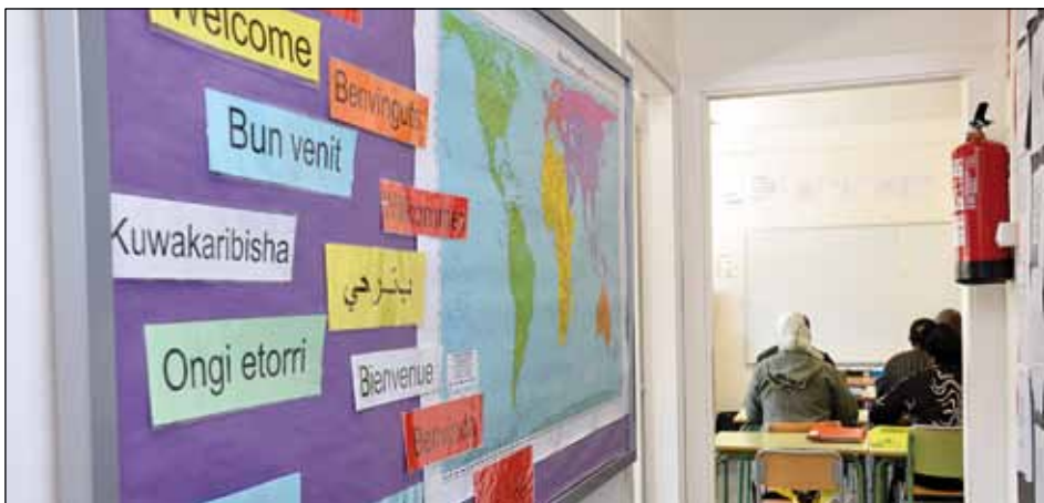
INSTAL·LACIONS DE L'AULA DE FORMACIÓ PER A PERSONES ADULTES, AL CARRER DE LA LLIBERTAT

A més del canvi d'emplaçament, el curs vinent l'Aula de Formació per a persones Adultes (AFA) oferirà classes per preparar l'accés a cicles formatius de grau superior, i el nivell bàsic d'Informàtica COMPETIC