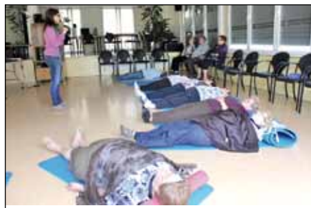
TALLER DE CURA PERSONAL I RELAXACIÓ PER A LA GENT GRAN