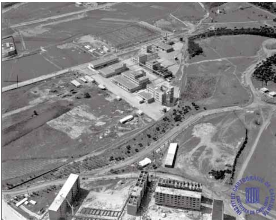
VISTA AÈRIA DEL PLA DE CAN TORRENTS AMB L'EMPRESA HENKEL I ELS PRIMERS BLOCS DE MONTORNÈS NORD EN CONSTRUCCIÓ. MARÇ 1964. RFSACE.4573.

La fotografia aèria que mostrem ens dóna idea de l'evolució de les obres dels primers