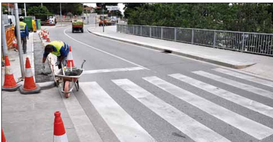
OBRES DE MILLORA DEL PONT SOBRE EL TORRENT DE VINYES VELLES

ESTACIÓ DE SERVEI MONTORNÈS qualitat i servei GARANTIT