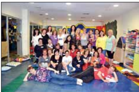
TALLER DE RISOTERÀPIA

El programa es va iniciar el 4 de maig amb un taller de risoteràpia en què van participar 44 persones i un sopar compartit que en va aplegar una trentena. Entre les activitats desenvolupades també hi ha hagut tallers de cura personal als Casals de la Gent Gran, un taller de ioga a la Biblioteca i diverses xerrades: una dedicada a la Llei de dependència i una altra titulada "Com ens preparem i vivim la menopausa". Aquesta darrera, celebrada el 28 de maig, Dia d'Acció per la salut de les dones" va comptar amb quaranta assistents i va servir per cloure la programació. |