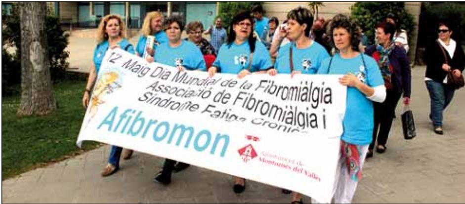
CAMINADA DEL DIA INTERNACIONAL CONTRA LA FIBROMIÀLGIA I LA FATIGA CRÒNICA

L'Associació de Dones per la Igualtat de Montornès i l'Associació de Fibromiàlgia i Síndrome de Fatiga Crònica han col·laborat amb les regidories de Polítiques d'Igualtat, Benestar Social i Salut Pública en l'organització del programa "Maig, mes de la salut de les dones"