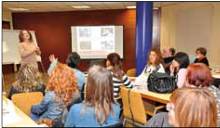
SESSIÓ DE FORMACIÓ ALS VOLUNTARIS

La bona resposta dels veïns a l'hora de col·laborar amb l'Ajuntament en el desenvolupament de projectes socials ha dut a demanar suport tècnic a la Diputació per impulsar una associació de voluntariat al poble. Actualment hi ha una cinquantena de persones que estan disposades a ajudar o que ja col·laboren en projectes de caire social, i que han rebut formació per part de Creu Roja. El darrer curs s'ha impartit el 31 de maig i el 7 de juny. |