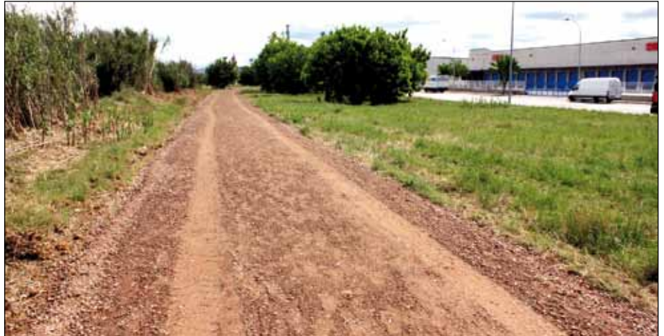
CAMÍ FLUVIAL DEL CONGOST AL TERME MUNICIPAL DE MONTORNÈS

Coincidint amb l'obertura del camí, els treballadors de l'empresa Sumitomo Bakelite van dedicar un matí a la plantació de més d'un centenar d'arbres en un tram del camí fluvial al terme de Montornès. L'activitat formava part d'un conveni que van signar l'Ajuntament i l'empresa que ha aportat 3.500 euros als treballs. |