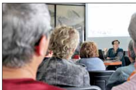
"COM ENS PREPAREM I VIVIM LA MENOPAUSA"