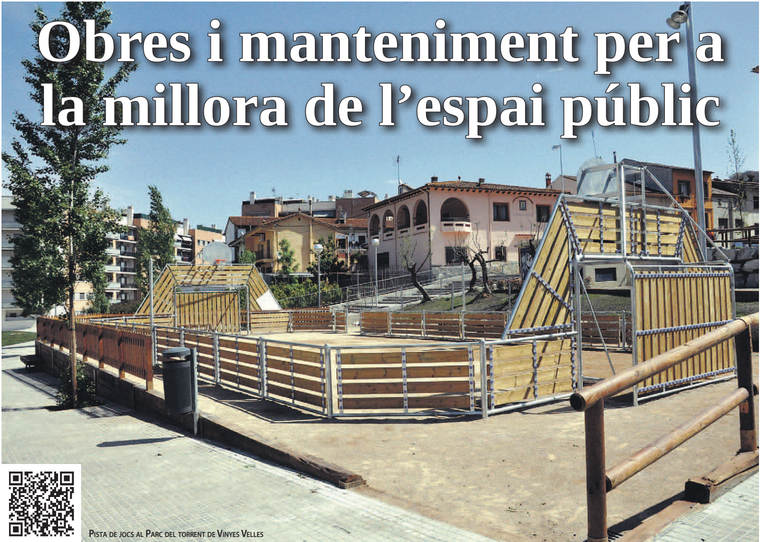
PISTA DE JOCS AL PARC DEL TORRENT DE VINYES VELLES

Durant l'any 2012, la Brigada d'Obres Municipal va fer més de 1.000 intervencions a la via pública per al manteniment i senyalització de carrers, per al condicionament dels espais públics com ara parcs i jardins, i en diverses obres d'urbanització.