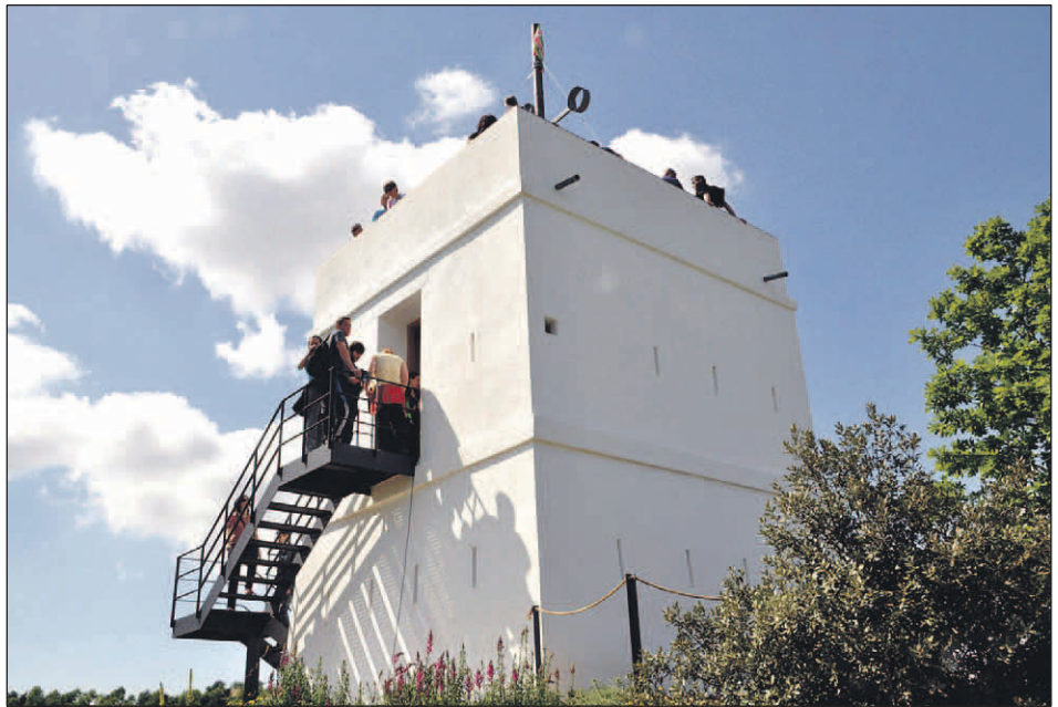
VISITES A LA TORRE DEL TELÈGRAF

L'entrada a l'edificació està ubicada en el segon pis on s'ha situat un telescopi que permet comprovar com albiraven els torrers les antigues torres del turó de Montcada i de Can