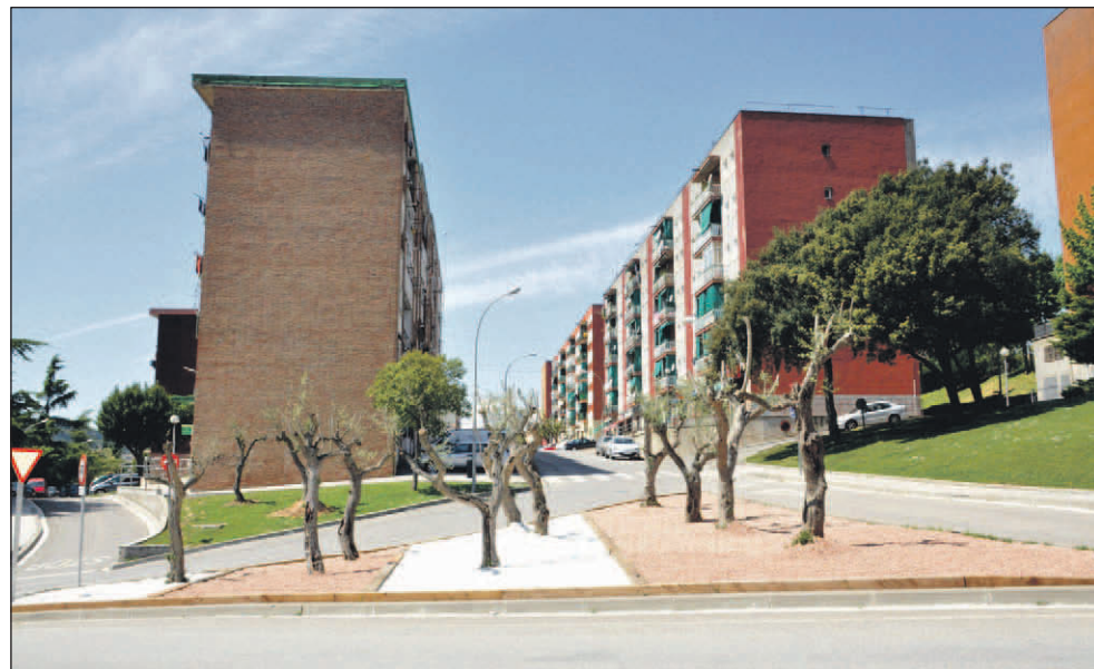
TREBALLS DE JARDINERIA A LA ILLETA SITUADA AL CARRER DE CARLES RIBA

Es tracta de serveis de neteja, paleta, electricitat, jardineria i pintura, entre d'altres. Dels primers mesos de 2013, destaquen l'acabament de la urbanització del Parc del torrent de Vinyes Velles i l'enjardinament de la rotonda del carrer de Carles Riba.