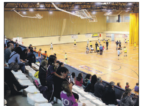
UN DELS PARTITS DISPUTATS AL PAVELLÓ MUNICIPAL D'ESPORTS

Prop de 70 infants d'entre 5 i 11 anys van participar, a final del mes d'abril al Pavelló Municipal, en una mena de torneig escolar de futbol sala, organitzat pel CF Sala Montornès. L'entitat imparteix aquesta disciplina a les escoles Can Parera, Mogent, Sant Sadurní i Marinada com activitat extraescolar. |