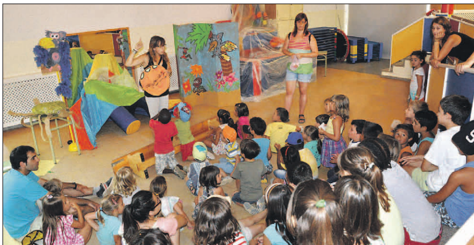
ACTIVITAT DEL CASAL D'ESTIU (2012)

L'import de l'ajut no serà superior al 90% del cost de l'activitat susceptible de subvenció. |