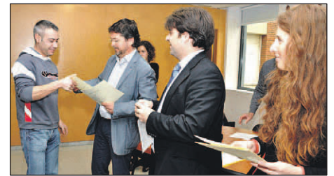
LLIURAMENT DE DIPLOMES A LA SALA D'ACTES DE L'AJUNTAMENT

Un total de 25 veïns en situació d'atur que han participat en la formació de Cobega van rebre, a final del mes d'abril, els diplomes i les acreditacions dels cursos de manipulador d'aliments i de conductor de carretó elevador. Dels 25 participants, 5 ja treballen en la línia d'envasament de vidre de la planta de Montornès i 18 s'incorporaran a la plantilla durant la campanya d'estiu que comença aquest mes de maig. |