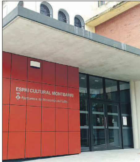
ESPAI CULTURAL MONTBARRI

El nom de l'equipament ha sortit d'un procés de participació ciutadana desenvolupat durant el mes d'abril. Les associacions del poble van proposar 13 noms. Després, els veïns majors de 12 anys van poder escollir el que més els agradava a través d'urnes i del web municipal. Es van comptabilitzar 478 vots, dels qual 430 van ser vàlids. Espai Cul-