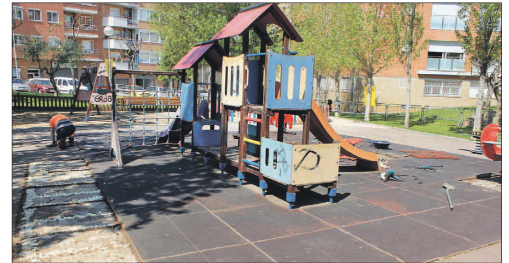
FEINES DE RENOVACIÓ DE LA ZONA DE JOCS DE LA PLAÇA DE LES FEIXES

Al marge de la conservació dels edificis i dels equipaments municipals, es comptabilitzen també les intervencions de logística que tenen a veure amb l'organització d'actes i esdeveniments al municipi. Per exemple, els sis primers mesos de 2012 es van fer 49 intervencions per cobrir les necessitats d'infraestructures de les festes de Reis, de Sant Jordi i de Carnaval; de les mostres i fires comercials, i de diversos esdeve-