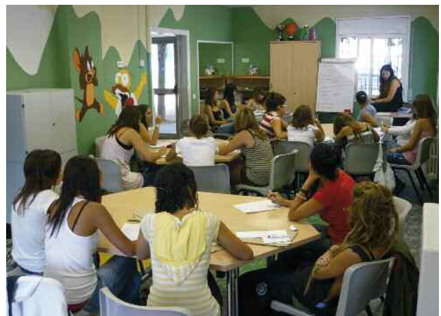
Sessió del curs de premonitors (2009)

Es tracta d'un curs introductor que inclou continguts de pedagogia, psicologia evolutiva, expressió plàstica i corporal, recursos de joc, i primers auxilis. Els alumnes no obtindran una titulació oficial però, en acabar, se'ls facilitarà un certificat d'aprofitament. El curs de premonitors també ofereix la possibilitat de fer pràctiques voluntàries al Centre Infantil la Peixera.