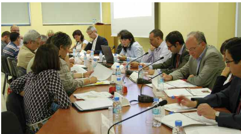
Un moment de la primera reunió del comitè celebrada a l'Ajuntament

Des de l'Oficina de barri es gestionarà tot allò que tingui a veure amb el pla que compta amb els fons de foment del programa de barris i àrees urba-