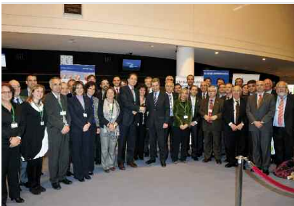
Cerimònia del Segon Pacte d'Alcaldes celebrada a Brusel·les, el mes de maig de 2010

Les conclusions de la diagnosi i les aportacions tècniques i ciutadanes serviran per a la redacció del pla.