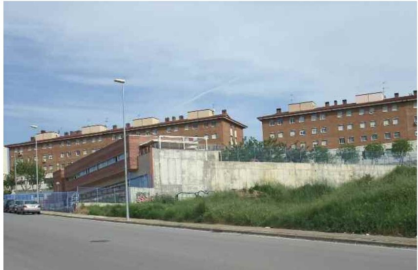
Terrenys proposats per a la construcció de l'equipament geriàtric al carrer Vallès

De moment la Generalitat, que ha inclòs el projecte de Montornès en la programació territorial dels recursos d'atenció social especialitzada i domiciliària a Catalunya durant el període 2008 -2012, ha donat resposta a una part de la demanda municipal amb la concertació econòmica de 25 places d'atenció diürna del servei de centre de dia.