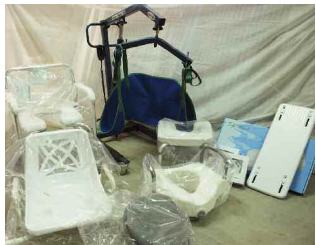
Alguns dels estris i instruments assistencials

La cessió d'elements tècnics d'ajuda complementa el programa d'actuacions per promoure l'autonomia personal de la gent gran en l'habitatge.