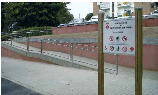
Rampa nova a la plaça del Sud

Finalment, en l'àmbit social es descriuen, entre d'altres aspectes, programes de cohesió social i altres de dinamització juvenil que es duen a terme al Centre Juvenil Satèl·lit.