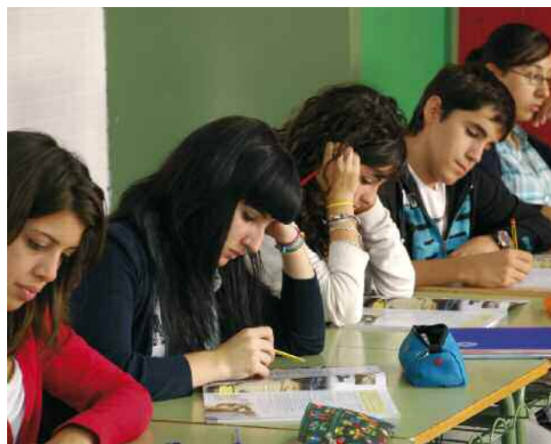
Alumnes de segon de batxillerat de l'Institut Vinyes Velles

Els premis es lliuraran en un acte públic de reconeixement als estudiants més brillants i serà una comissió formada pels directors dels dos instituts, un director d'una escola de Montornès, el tècnic i el regidor d'Ensenyament qui en farà la tria.