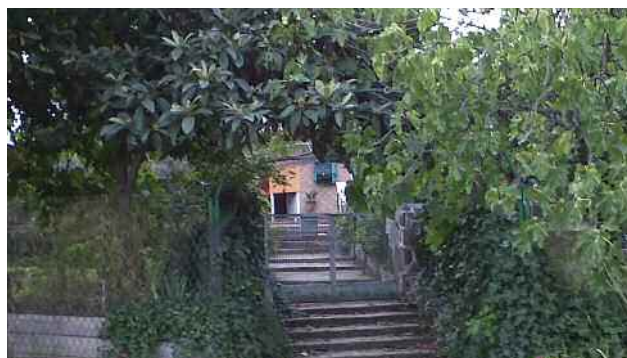
Una de les parcel·les on es preveu ubicar el centre d'interpretació de la natura i el paisatge del turó de les Tres Creus