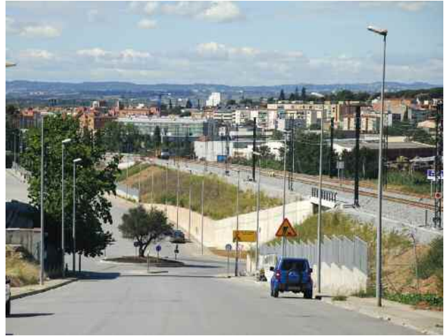
Vista del traçat des del carrer Vallès

La primera valoració d'ADIF d'aquestes afectacions se situa a l'entorn dels 450.000 euros.