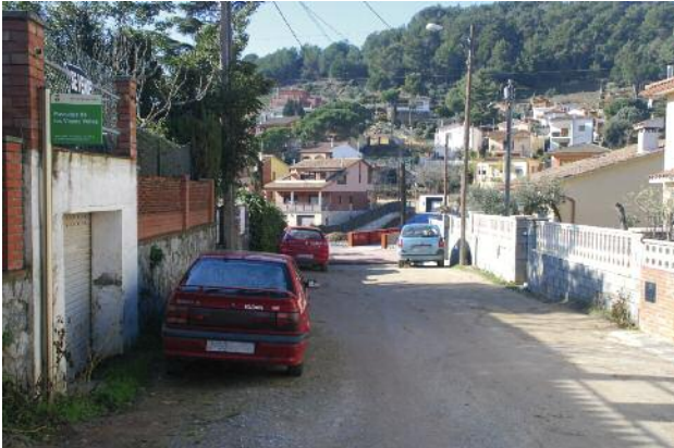
Passatge de les Vinyes Velles

D'acord amb les previsions, l'Ajuntament de Montornès rebrà a l'entorn de 2.600.000 euros del fons estatal que té per finalitat impulsar obra pública i ocupació