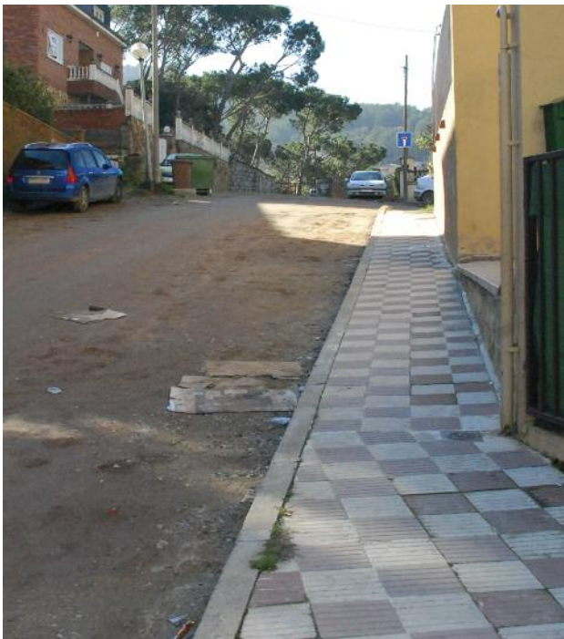
Carrer dels Pins

El Ministeri d'Administracions Públiques ha notificat al Consistori la concessió de finançament per als quatre projectes de via pública que Montornès va presentar al fons extraordinari d'inversió local que el govern de l'Estat ha previst per als municipis aquest any 2009.