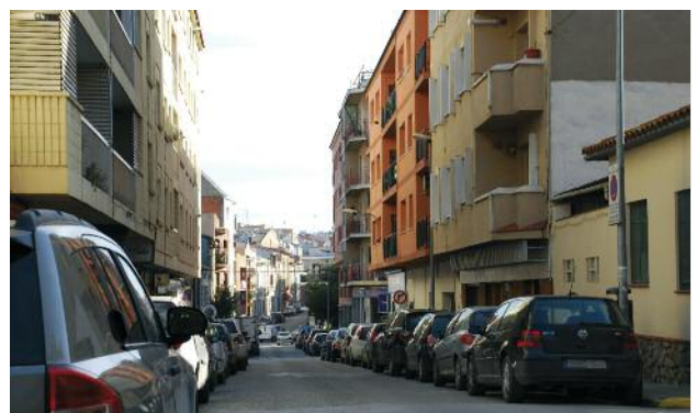
Carrer de l'Estrella