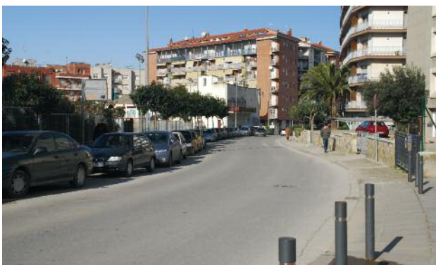
Rambla de Sant Sadurní

Les normes que regulen l'obtenció d'ajut del fons d'inversió local són estrictes. Els projectes no han de comptar amb cap altra via de finançament, els treballs s'han de licitar en el termini d'un mes a partir de la concessió de l'ajut, i les obres s'han d'executar dins l'any 2009.