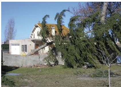
Efectes del temporal de vent a Montornès Pàg. 3