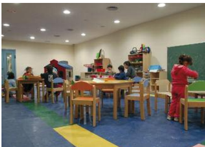
Inauguració i bateig del nou centre infantil Pàg. 9