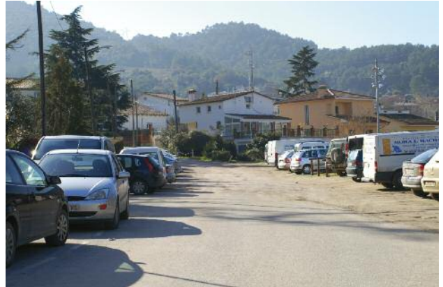
Carrer de les Vinyes Velles