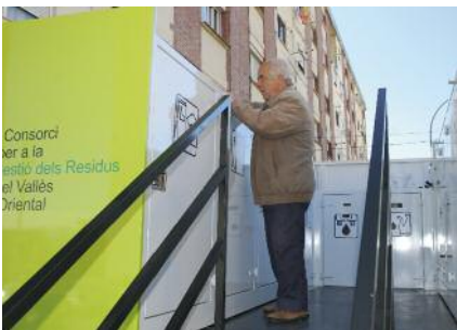
Servei de deixalleria mòbil Pàg. 8