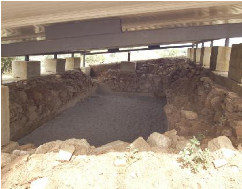
Protecció de la cisterna descoberta l'any passat

base del jaciment. Els treballs han anat acompanyats de tasques de protecció del material que ha anat quedant al descobert