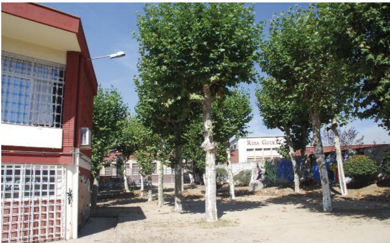
Espai annex a les instal·lacions del Casal de Cultura