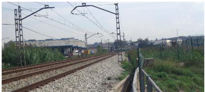
Línia Barcelona - Portbou al seu pas per Montornès

En el capítol dedicat a la xarxa ferroviària, l'Ajuntament proposa com a prioritat la inclusió del projecte de construcció d'una estació de rodalies de la línia Barcelona - Portbou a Montornès Nord. Aquesta històrica reivindicació del municipi no ha estat incorporada a l'avantprojecte del Pla, tot i que sí que es va integrar fa uns mesos en un pla de transport de rodalies del govern autonòmic.