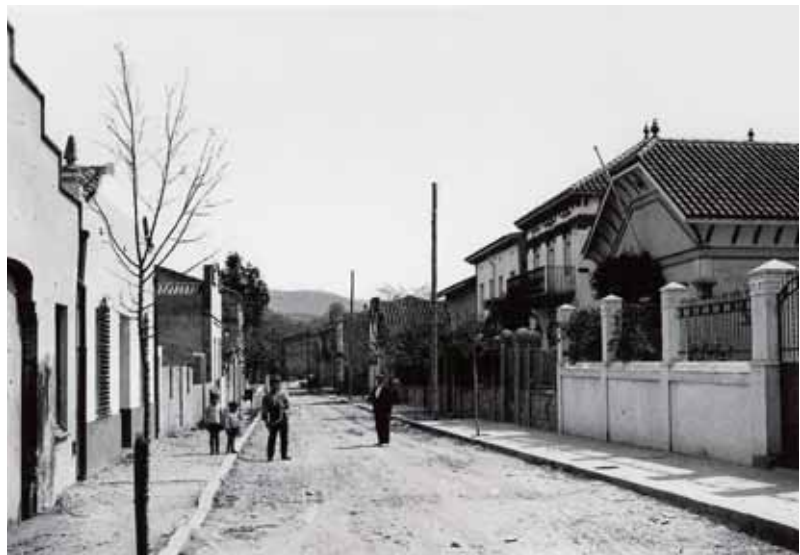
El carrer Major, els anys 20

Des del mes de desembre el carrer Major és d'ús exclusiu per a vianants des de l'avinguda de l'Onze de Setembre fins a la rambla de Sant Sadurní.