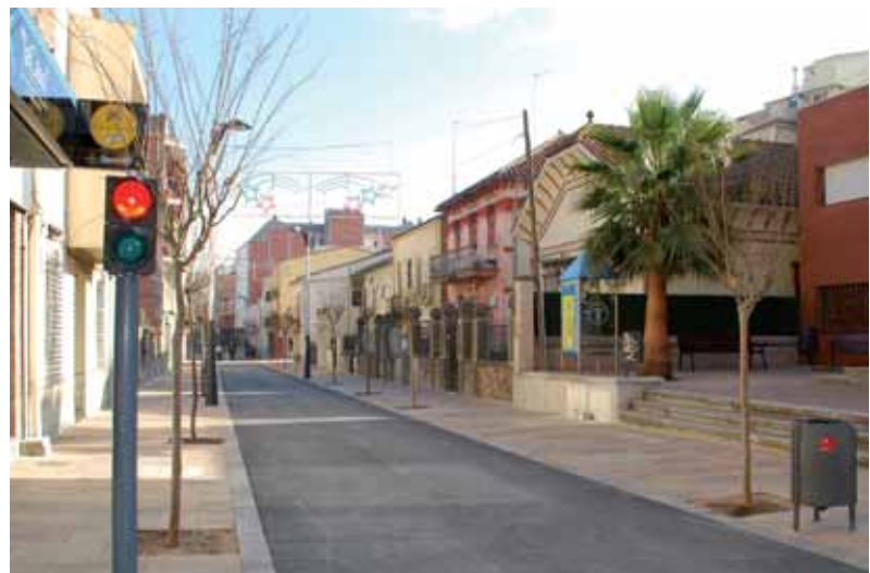
El carrer Major, l'any 2008

Un espai nou d'ús preferent per a vianants