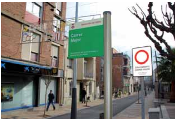
El carrer Major, vist des de l'avinguda de l'Onze de Setembre

L'accés a garatges privats i la càrrega i descàrrega de mercaderies es fa pels carrers perpendiculars al carrer Major