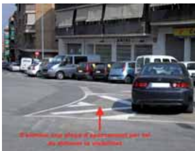
Plaça dels Països Catalans

L'Àrea del Territori i la Prefectura de la Policia Local han enllestit els treballs de senyalització viària a diversos carrers de Montornès Centre.