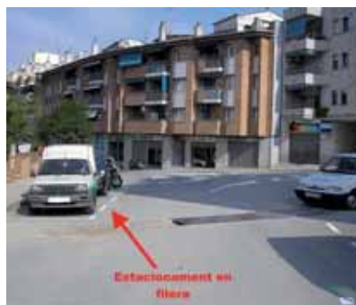
Carrer de Vinyes Velles

L'actuació més important ha estat la reordenació dels carrers que connecten amb el carrer Major i la creació de zones de càrrega i descàrrega de mercaderies.