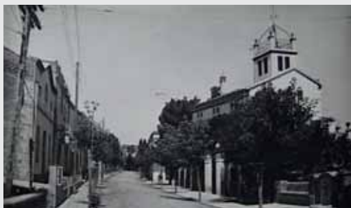
El carrer Major a la dècada dels 50