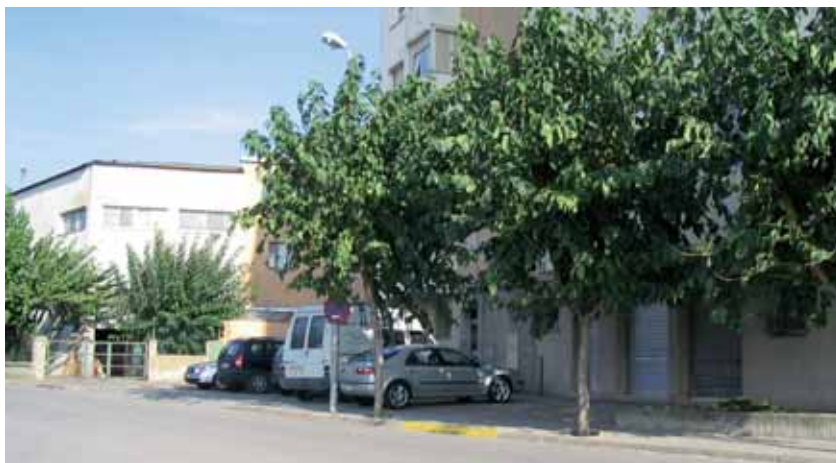
Ubicació prevista per al centre al carrer de Federico García Lorca

La Junta de Govern Local, reunida en sessió ordinària el 19 d'octubre, va acordar la sol·licitud d'ajut per part de l'Ajuntament al govern autonòmic per adequar un local situat al barri de Montornès Nord i destinar-lo a la creació d'un consultori local d'atenció comunitària que dependrà del Centre d'Atenció Primària.