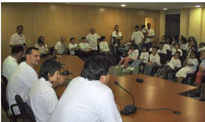
Recepció institucional a la Sala d'Actes de l'Ajuntament

Companys del Club Karate Montornès, familiars i amics de l'esportista van assistir a la recepció.