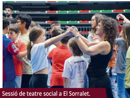
Sessió de teatre social a El Sorralet.

Dues trobades de teatre social, adreçades a l'alumnat de 5è i 6è, han estat les