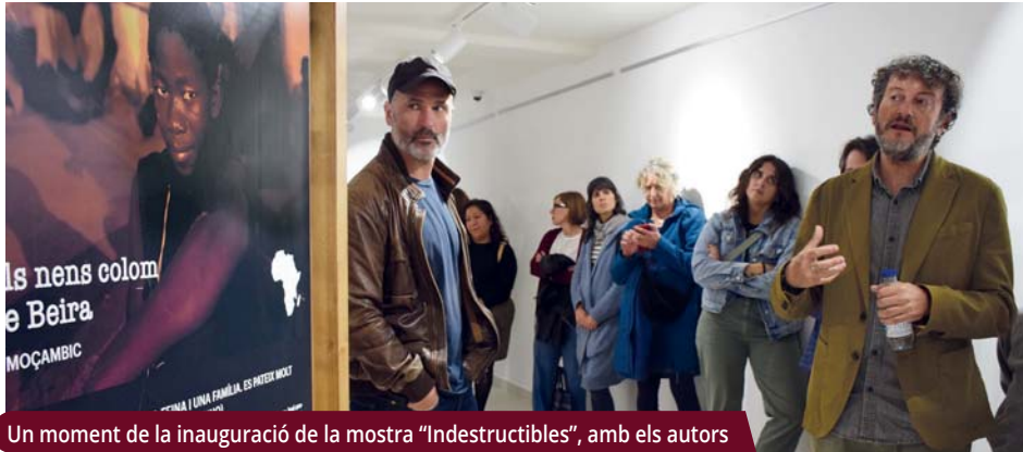
Un moment de la inauguració de la mostra “Indestructibles”, amb els autors

Les dues darreres exposicions de l’any a Can Saurina han tingut un marcat caire reivindicatiu.