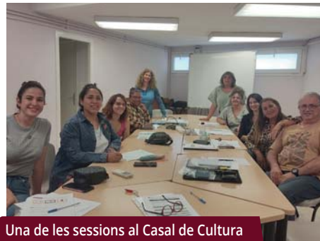
Una de les sessions al Casal de Cultura

En els darrers dies s'ha impartit el curs de formació transversal "Mètode