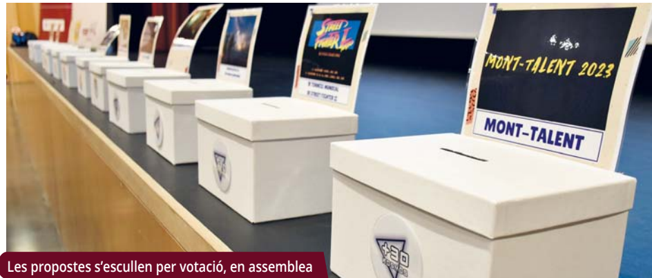
Les propostes s'escullen per votació, en assemblea

L'11 de novembre el Teatre Margarida Xirgu acollirà l'assemblea en què es decidiran les iniciatives del proper any.