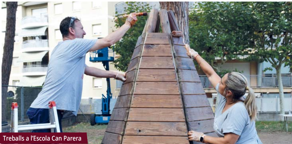
Treballs a l'Escola Can Parera

Les escoles Mogent i Can Parera han convertit els seus patis en espais que ajuden a transformar els rols de gènere i les relacions de poder.