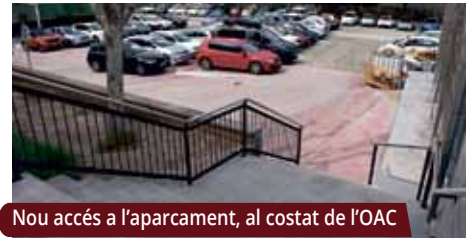
Nou accés a l'aparcament, al costat de l'OAC

Darrerament s'han fet millores a l'aparcament del c. de Fdco. García Lorca i a l'entorn de la zona de jocs del c. de Bellesguard. A més, s'ha reparat la calçada a l'av. de la Mare de Déu de Montserrat, a l'accés a l'Escola Can Parera i als c. de Vallromanés i del Consell de Cent, entre d'altres. També s'ha construït una escala que connecta l'aparcament del costat de l'OAC Centre amb el c. de Sant Isidre.