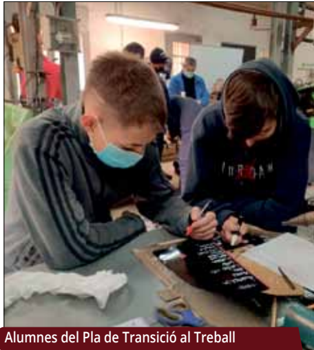
Alumnes del Pla de Transició al Treball

Del 2 al 13 de maig romandrà obert el termini de preinscripció a la formació del Pla de Transició al Treball (PTT). Enguany les preinscripcions i les matrícules es formalitzaran presencialment a l'Institut Marta Mata, de 8 a 14 h.