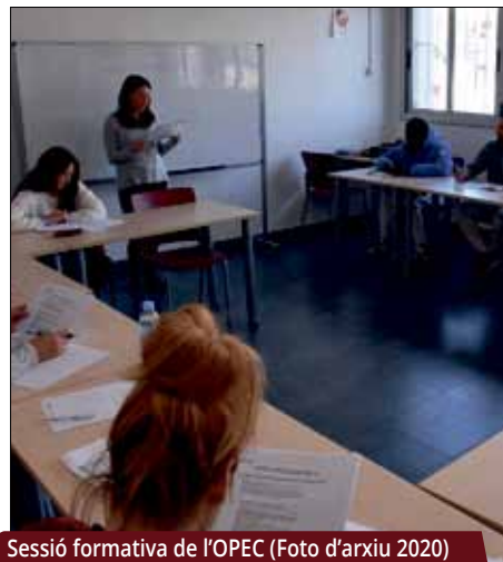
Sessió formativa de l'OPEC (Foto d'arxiu 2020)

Sota el títol "Maig, mes de la formació activa a Montornès", el Departament d'Ocupació, Promoció Econòmica i Comerç (OPEC) oferirà dos tallers al veïnat que estigui en situació d'atur o en procés de millora d'ocupabilitat. Les sessions, gratuïtes i amb una durada de 15 a 20 hores, abordaran qüestions com els processos de selecció o la preparació d'estratègies per a la recerca de feina.