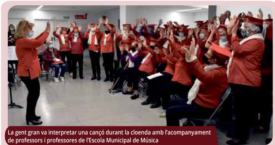
La gent gran va interpretar una cançó durant la cloenda amb l'acompanyament de professors i professores de l'Escola Municipal de Música

La "Dimensió Crítica", juntament amb la "Dimensió Sociolaboral" i la "Dimensió Violeta", són els àmbits posats en marxa des de diversos departaments municipals per fer un acompanyament integral als i les joves del poble. |