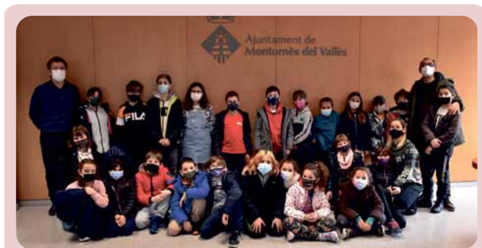
Les escoles visiten l'Ajuntament. Alumnes de 3r de l'Escola Palau d'Ametlla van visitar el Consistori a finals de març. L'alcalde, José A. Montero, els va fer de guia.

Amb aquesta iniciativa els nens i nenes s'incorporen també a la dinàmica dels pressupostos participatius i assoleixen el rol de ciutadania activa i compromesa amb el municipi.