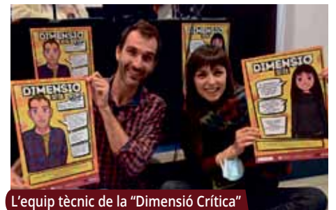
L'equip tècnic de la "Dimensió Crítica"