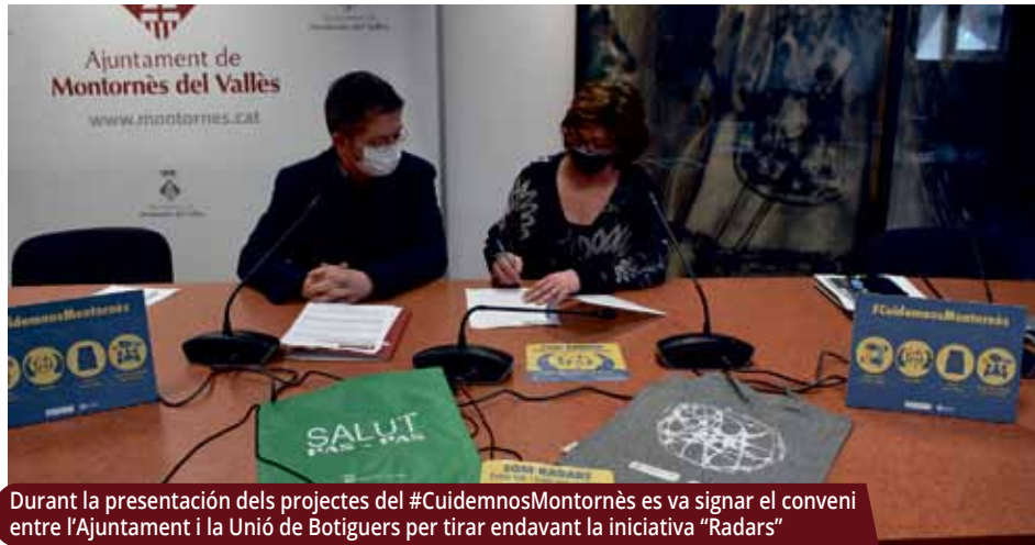
Durant la presentació dels projectes del #CuidemnosMontornès es va signar el conveni entre l'Ajuntament i la Unió de Botiguers per tirar endavant la iniciativa "Radars"

Un cop superats els moments més crítics de la pandèmia, la iniciativa impulsa projectes de millora de la salut i el benestar del veïnat.