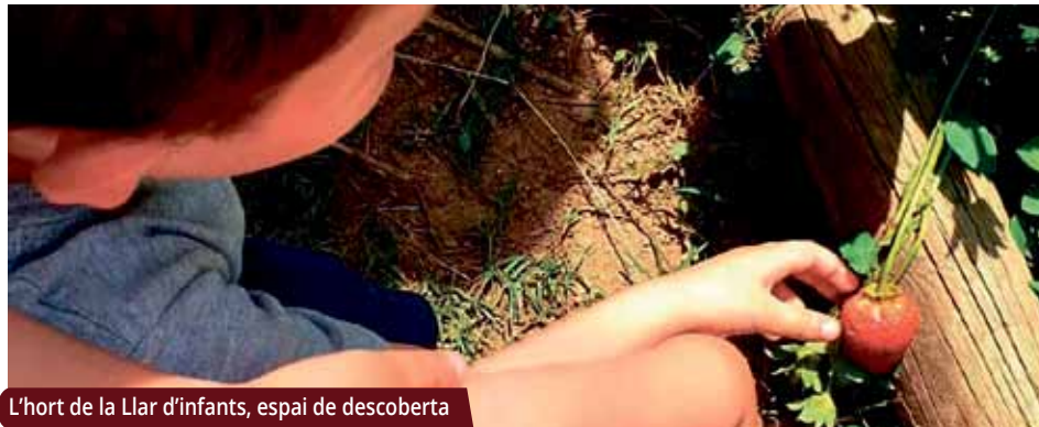
L'hort de la Llar d'infants, espai de descoberta

La Llar d'Infants Pública El Lledoner té capacitat per a 82 infants. Les preinscripcions per al curs 2022-23 seran del 9 al 20 de maig.