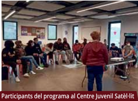
Participants del programa al Centre Juvenil Satèl·lit

Darrerament s'ha engegat l'itinerari del projecte "Dimensió Sociolaboral", adreçat a joves amb titulació post obligatòria (cicles formatius, graus i/o màsters universitaris). Se'ls ofereix un espai per posar en valor les seves potencialitats amb vista a la inserció laboral.