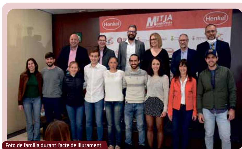
Foto de família durant l'acte de lliurament

Paral·lelament a la renovació de la gespa, s'han substituït els llums del camp per d'altres amb tecnologia LED. |