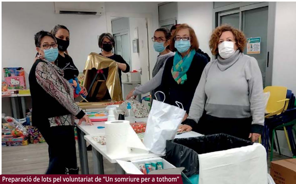
Preparació de lots pel voluntariat de "Un somriure per a tothom"

L'Associació Volumont ha gestionat novament la campanya, que ha arribat a més d'una vintena de famílies i a 25 persones grans.