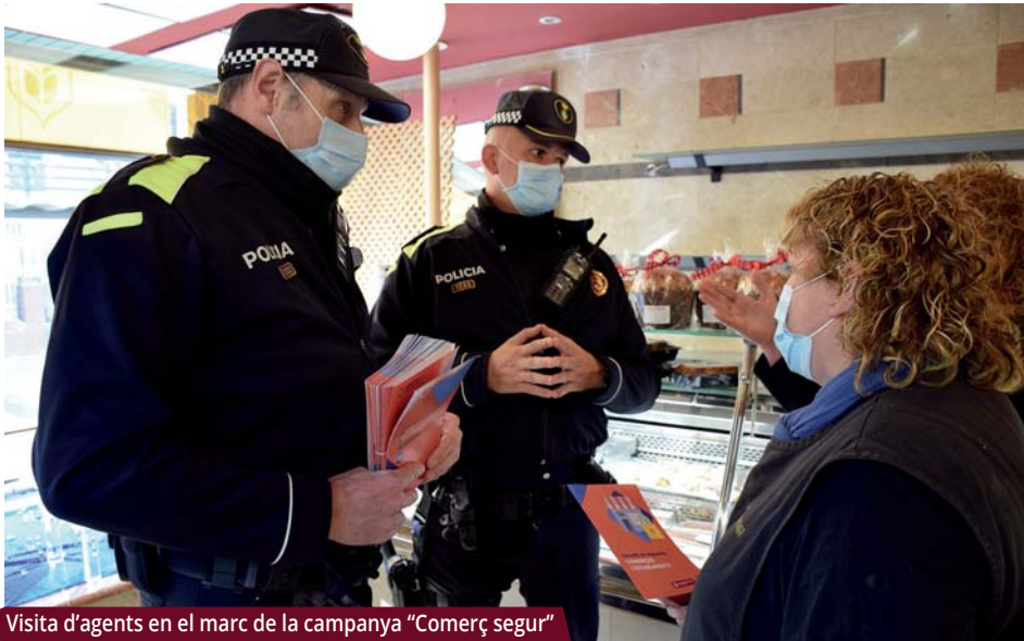
Visita d'agents en el marc de la campanya "Comerç segur"

L'operatiu, que s'allargarà fins passades les festes de Nadal, té com a objectiu reforçar la seguretat del comerç i prevenir furts, robatoris o estafes.