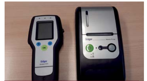
Etilòmetre evidencial per al control d'alcoholèmia

Des de fa unes setmanes, la Policia Local compta amb dos nous caporals que completen l'escala de comandaments del cos, un procés iniciat l'any 2020 amb l'objectiu de reforçar i estructurar la plantilla de la prefectura.