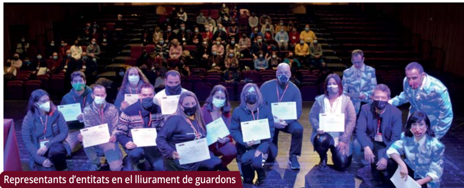
Representants d'entitats en el lliurament de guardons

La Colla de Geganters, la Penya Els Bartomeus i el Club Patí Montornès han estat les guanyadores de la 2a edició dels Premis de reconeixement a les entitats.