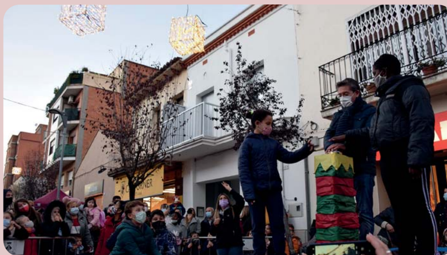
L'encesa de Nadal. Un grup d'infants dels centres infantils i l'alcalde, José A. Montero, van fer l'encesa de l'enllumenat de Nadal. Els llums ornamenten una trentena de carrers, places i rotondes del poble. |

Les convocatòries de subvencions han estat obertes el desembre. |