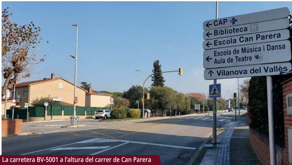
La carretera BV-5001 a l'altura del carrer de Can Parera

El projecte inclou actuacions des de la rotonda de l'avinguda d'Ernest Lluch fins a Can Parera, on han començat els treballs.