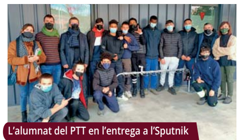
L'alumnat del PTT en l'entrega a l'Sputnik

Durant els darrers anys, l'alumnat de fabricació mecànica i soldadura ha creat objectes amb tota mena de finalitats, per a ús del poble, com prestatgeries per a la Biblioteca, roses forjades en metall per Sant Jordi, un mostrador per a l'Escola d'Hoteleria, barbacoes per a les entitats veïnals i escenografia per a La Remença. |