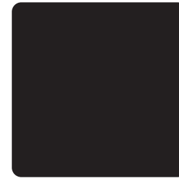
Contenidor noms equipaments