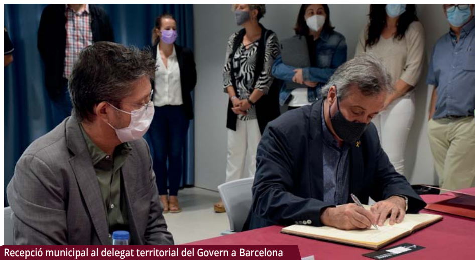
Recepció municipal al delegat territorial del Govern a Barcelona

Montornès ha posat sobre la taula, novament, la demanda llargament reivindicada de suport del govern al projecte de Residència Centre de dia.