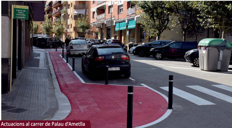
Actuacions al carrer de Palau d'Ametlla

Les millores afecten els carrers de Palau d'Ametlla, de Jacint Verdaguer i de Sant Isidre i se sumen al nou aparcament habilitat de 62 places.