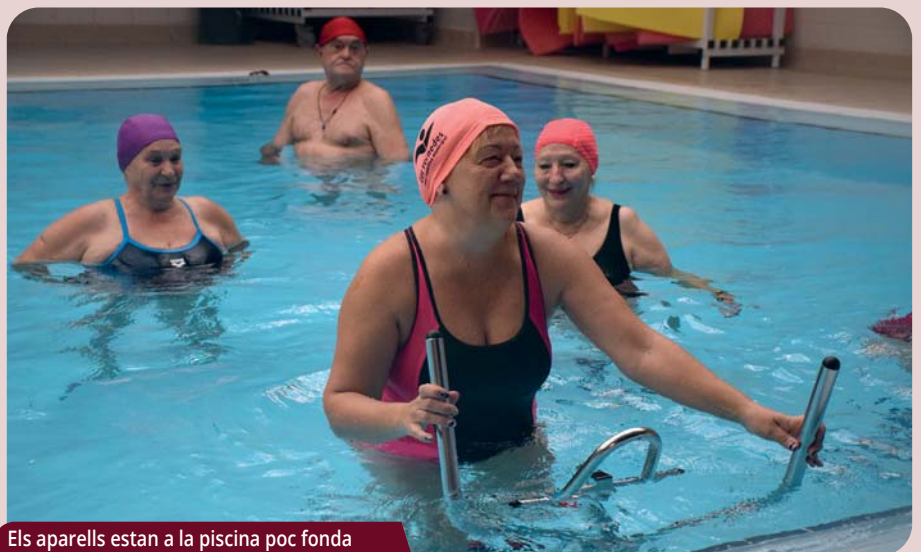
Els aparells estan a la piscina poc fonda

Nou servei "Poolbike" al CEM Les Vernedes. L'equipament ha posat en marxa un servei d'entrenament cardiovascular amb bicicleta i el líptica recomanat per a persones amb problemes físics o sobrepès. Per fer-ne ús cal fer una reserva prèvia a l'app del CEM o al web cemlesvernedes.cat . |