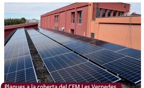
Plaques a la coberta del CEM Les Vernedes

L'Ajuntament va sol·licitar la subvenció el 2017 amb la intenció de continuar incorporant mesures que afavoreixin l'estalvi energètic i l'ús d'energies renovables.