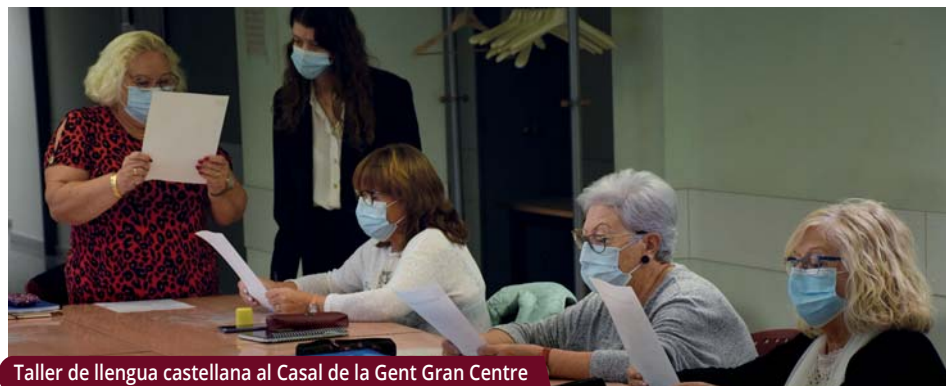
Taller de llengua castellana al Casal de la Gent Gran Centre

A més dels tallers habituals se'n posarà en marxa un de suport emocional contra la soledat no volguda i activitats amb motiu del Dia de la Gent Gran.