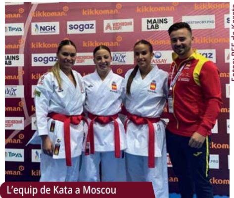
L'equip de Kata a Moscou