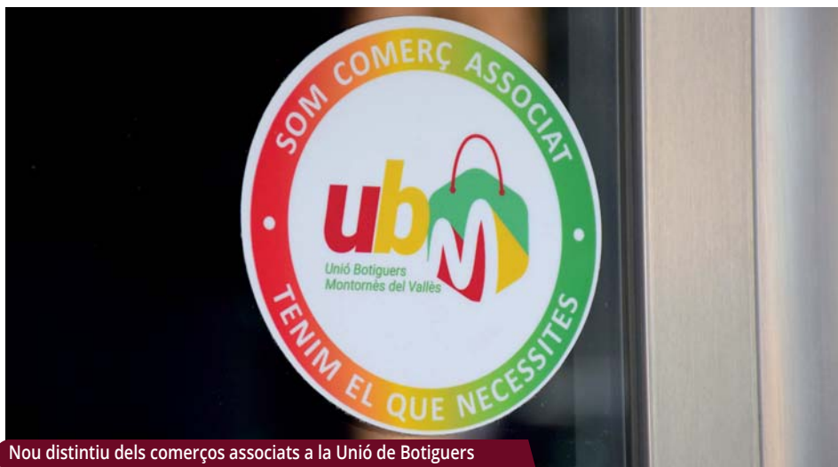
Nou distintiu dels comerços associats a la Unió de Botiguers

L'entitat ha creat un nou logotip modern i reconeixible i ha incrementat l'activitat a les xarxes socials.