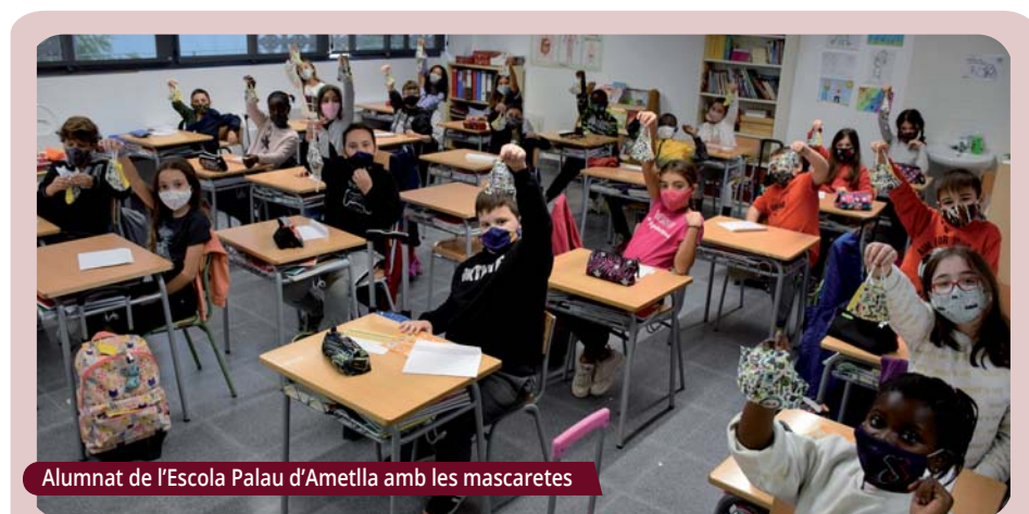
Alumnat de l'Escola Palau d'Ametlla amb les mascaretes