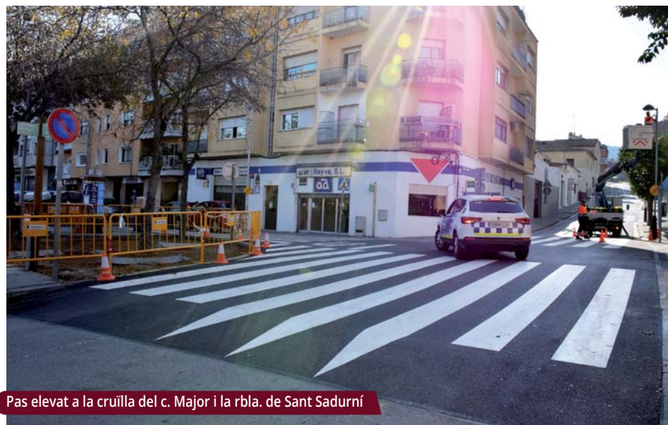
Pas elevat a la cruïlla del c. Major i la rbla. de Sant Sadurní

L'encreuament s'ha transformat en un pas elevat que millorarà la mobilitat dels vianants.