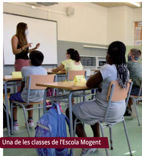
Una de les classes de l'Escola Mogent

El PEE, amb conveni amb la Generalitat des de 2016, es manté com a una eina global per respondre a les necessitats educatives del poble en tots els àmbits. El pla oferirà continuïtat a accions del curs passat i incorporarà novetats com un projecte d'orientació acadèmica o un catàleg municipal d'activitats extraescolars. |