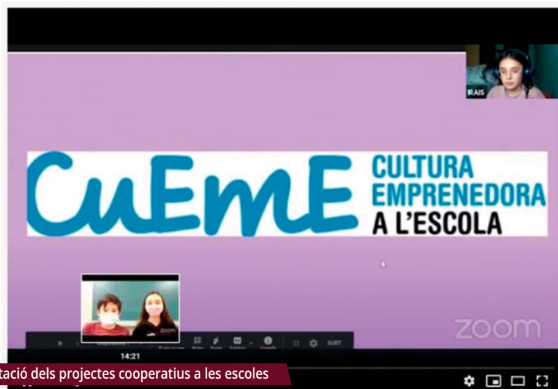
Presentació dels projectes cooperatius a les escoles

L'edició d'enguany de la FESS de Montornès ha mostrat projectes de cooperativisme local i ha plantejat propostes.