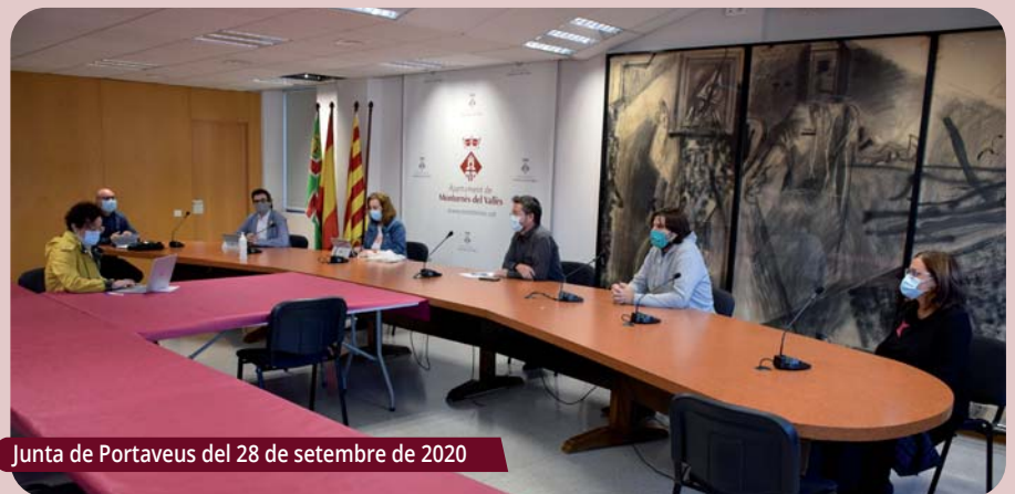
Junta de Portaveus del 28 de setembre de 2020

La nova normalitat dels òrgans de govern. Després de mesos de reunions telemàtiques, durant les darreres setmanes s'han reprès les sessions presencials dels òrgans municipals de govern (Junta de Govern, Comissions Informatives, Junta de Portaveus i Comissió Especial de Comptes). |