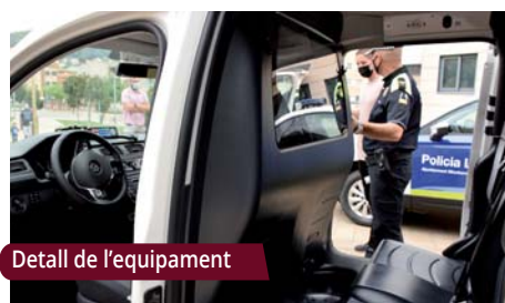
Detall de l'equipament

En aquests moments el parc mòbil de la Policia Local està integrat per tres vehicles retolats, un vehicle no logotipat i tres motocicletes.