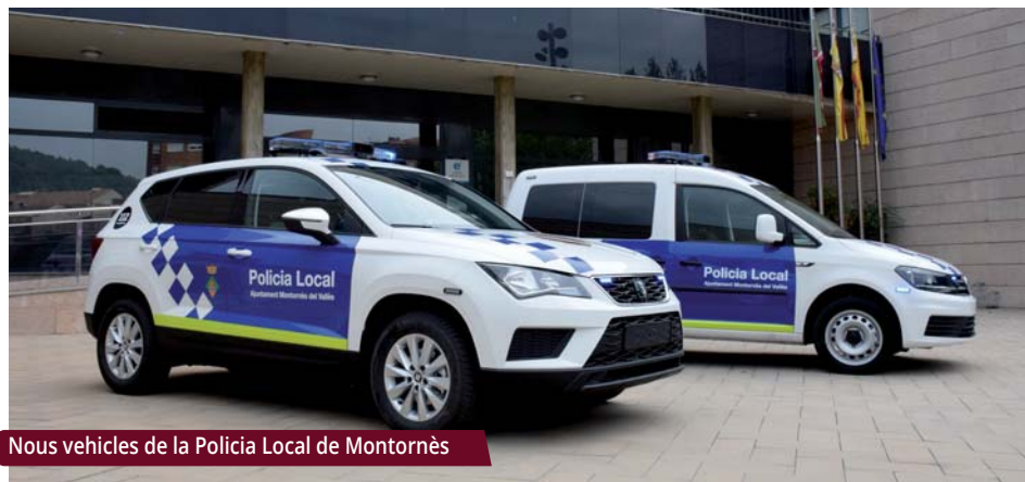
Nous vehicles de la Policia Local de Montornès

Els nous cotxes, homologats i equipats, en substitueixen altres de més antics i menys aptes per a l'actuació policial