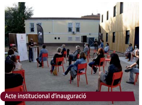
Acte institucional d'inauguració

L'edifici de l'Sputnik ha estat concebut com una infraestructura ecològica i eficient. En el seu disseny s'ha incidit en aspectes sostenibles pel que fa als aïllaments, materials i aprofitament energètic. Disposa de plaques solars fotovoltaïques i d'un sistema informatitzat de control de consums (aigua i llum) i de nivells de CO2.