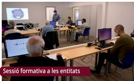
Sessió formativa a les entitats

El departament municipal de Participació Ciutadana ha posat en marxa un nou cicle d'activitats formatives incloses en la programació “Les entitats al dia”, que es desenvoluparà fins al desembre.