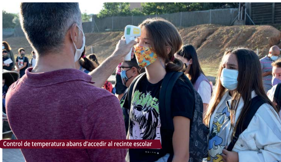
Control de temperatura abans d'accedir al recinte escolar

Les mesures de prevenció de contagis de la Covid-19 marquen el curs. Els centres educatius apliquen un pla d'obertura que té en compte tots els aspectes relacionats amb la seguretat comunitària.