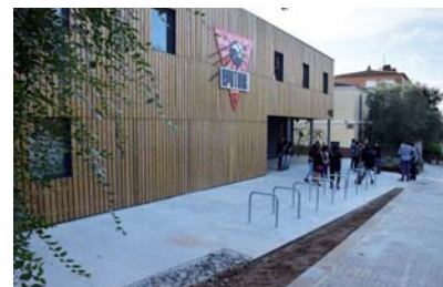
7 El nou Centre Juvenil Sputnik s'enlaira