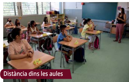
Distància dins les aules

També s'han traslladat les classes teòriques del PTT al nou equipament juvenil Sputnik, que permet complir les condicions d'aforament necessàries. |