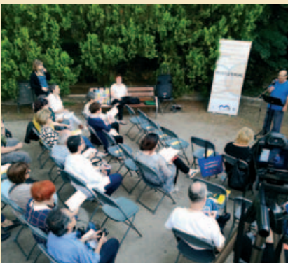
MONTORNÈS LLEGEIX... POESIA