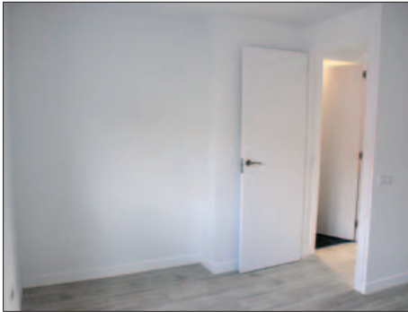
UN DELS PISOS DE LLOGUER

Deu sol·licitants opten als cinc pisos municipals de lloguer per a joves