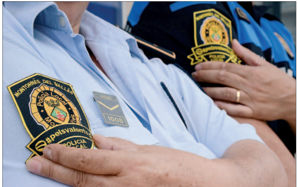
ESCUT SOLIDARI DE LA POLICIA LOCAL DE MONTORNÈS #PELSVALENTS

Els escuts amb la llegenda #pelsvalents es poden adquirir a la Prefectura de la Policia Local amb un donatiu de 4 €. Els diners recaptats es destinaran íntegrament a l'Hospital Sant Joan de Déu de Barcelona, per a la construcció del nou Pediatric Cancer Center.