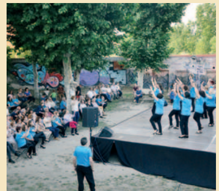
DEMOSTRACIÓ DE BALLS AL CASAL DE CULTURA

Fi de curs a la Biblioteca i al Casal de Cultura. Els equipaments han celebrat aquests dies la cloenda de la temporada. Entre les darreres propostes de la Biblioteca hi ha hagut el "Montornès llegeix... poesia", la visita de l'escriptor i periodista Xavier Bosch i una gran festa. El Casal ha organitzat un festival amb demostracions de dansa, tastets de cuina i exposicions. |