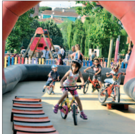
CIRCUIT DE BICICLETES EN LA VI DIADA D'ESPORTS AL CARRER

Les entitats esportives del municipi van treure al carrer el 8 de juny el seu potencial per mostrar les activitats que desenvolupen i permetre a tothom fer un tastet de les disciplines que practiquen.