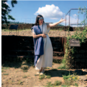
VISITA TEATRALITZADA A MONS OBSERVANS

El departament de Cultura, Festes i Patrimoni de Montornès promou un munt d'activitats aquest mes de juliol, però des de l'Oficina de Català voldríem destacar especialment aquelles que tenen com a marc incomparable el jaciment arqueològic Mons Observans. Darrerament els alumnes dels cursos de català hi van fer una visita i alguns d'ells es van sorprendre en descobrir que enmig dels polígons s'amagava aquest bonic testimoni de l'inici de la romanització de les nostres terres, cap allà el s. II aC. Si encara sou d'aquells que no han visitat mai Mons Observans, les activitats que s'hi faran aquest estiu són una bona excusa per apropar-vos-hi.