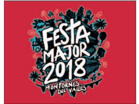
LA IMATGE DE LA FESTA MAJOR 2018