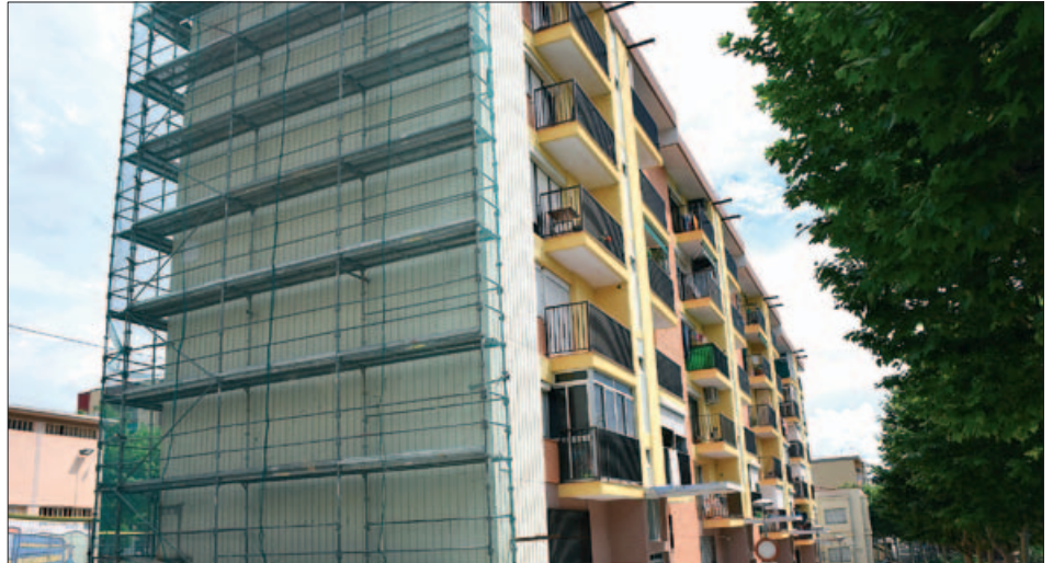
EDIFICI EN PROCÉS DE REHABILITACIÓ A LA PLAÇA DEL PRIMER DE MAIG

La rehabilitació d'edificis és una de les principals línies d'actuació desenvolupades durant els darrers anys dins del Projecte d'Intervenció Integral de Montornès Nord. |