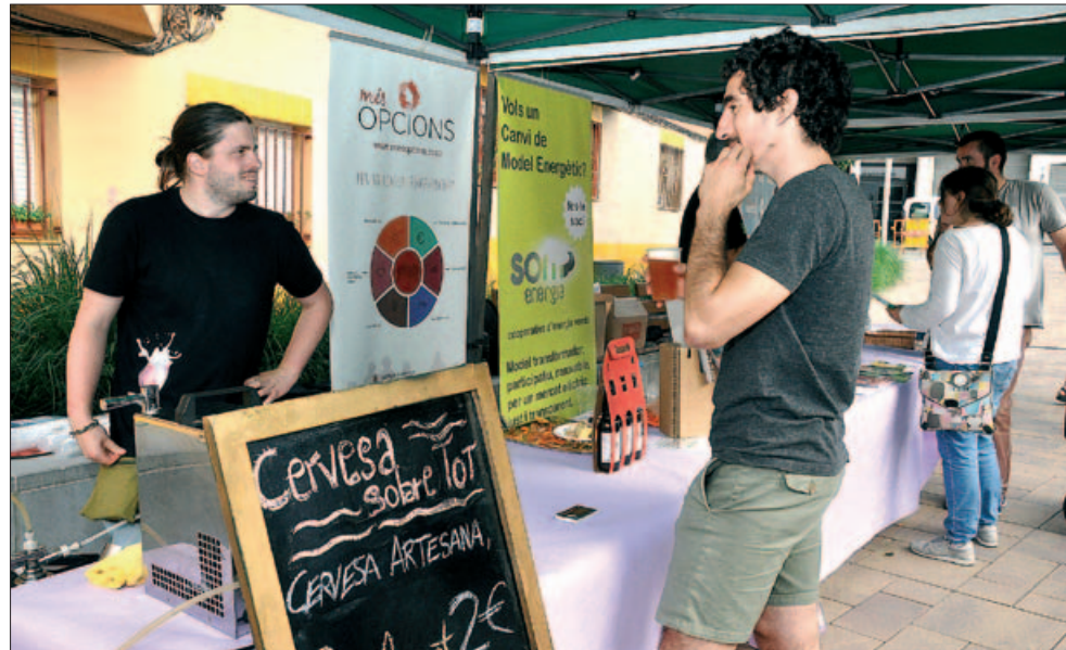
PARADES A LA PLAÇA DE JOAN MIRÓ

més consolidats en aquest tipus d'iniciatives. L'esdeveniment també ha servit per començar a donar a conèixer els valors d'aquesta forma d'economia al poble.