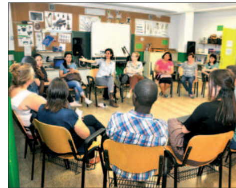
UN DELS RAONS DE DEBAT

A més de l'Ateneu Cooperatiu del Vallès Oriental i de Labcoop, que van col·laborar en l'organització, hi van participar entitats locals com l'Espai Panda, Can Galvany i El Cirerer d'Arboç i d'altres municipis com la fundació La Dinamo, Sostre Cívic, l'associació La Magrana Vallesana, el Casal Popular El Brot i propostes com Som Energia, que es dedica a la comerci-