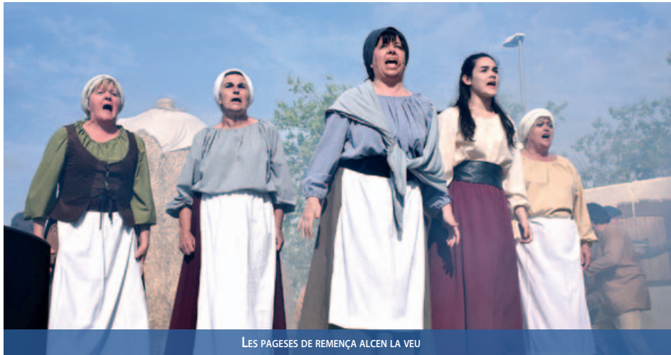
LES PAGESES DE REMENÇA ALCEN LA VEU