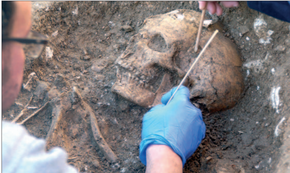
RESTES HUMANES DESCOBERTES DURANT LES EXCAVACIONS

Les sospites, avalades per anys de troballes parcials, que l'entorn de l'església de Sant Sadurní amagava al subsòl una necròpolis s'han confirmat amb les excavacions realitzades entre l'abril i el maig a la plaça de Joaquim Mir. En tan sols 16,5 m 2 , s'han localitzat 25 unitats funeràries o enterraments, dels quals s'han fet 15 exhumacions de restes humanes. Això fa pensar als experts que el perímetre excavat només és una part d'una necròpolis amb unes dimensions totals difícils de precisar.