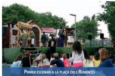
PRIMER ESCENARI A LA PLAÇA DELS REMENCES