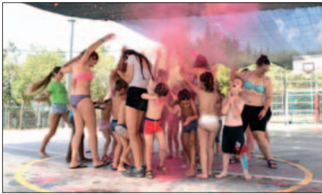
CASAL D'ESTIU A L'ESCOLA MARINADA (2017)

Els Casals d'estiu i esportiu ja tenen tot preparat per donar la benvinguda a infants i joves. Les dues propostes reuniran prop de 700 participants, més de 90 monitors i quatre joves en pràctiques que reforçaran els equips.