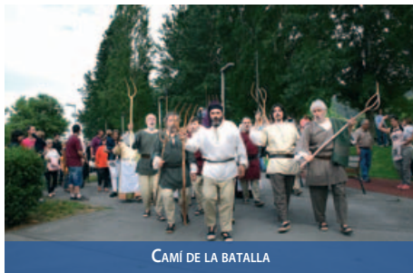
CAMÍ DE LA BATALLA