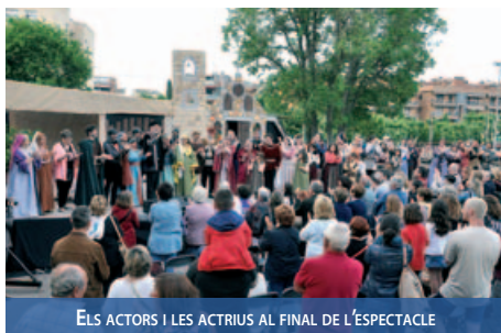
ELS ACTORS I LES ACTRIUS AL FINAL DE L'ESPECTACLE