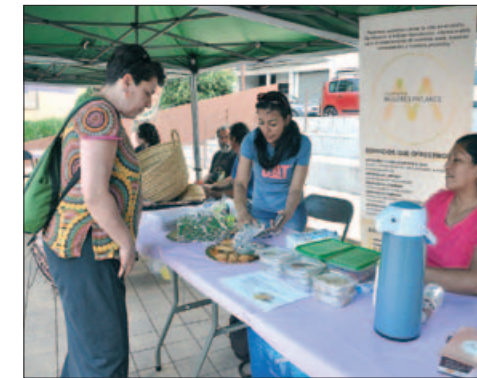
ESTAND D'EXPERIÈNCIES DE MUJERES PA'LANTE

Tres de les iniciatives que van despertar més interès i van trobar reflex en experiències locals van ser les proposades per l'associació Mujeres Pa'lante, l'Assoc. de Comunitats Autofinança-