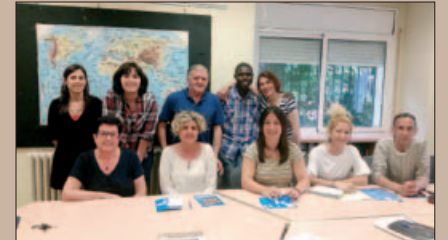
MIEMBROS DE LA COMISIÓN DE CONVIVENCIA DE MONTORNÉS NORTE

Con el objetivo de potenciar la convivencia, el civismo y la implicación del vecindario en los programas sociales y culturales del municipio, en noviembre de 2016 creamos la Comisión de convivencia de Montornés Norte. Está formada por 12 personas que viven o trabajan en el barrio, por técnicos/as municipales y el concejal del barrio.