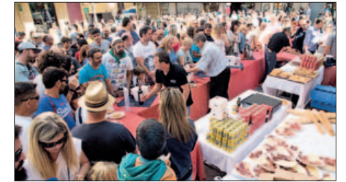
FONTAPA / FOTO: JA JIMÉNEZ

Van participar per 1a vegada a la FM Colla infantil dels Gegants Correfoc infantil amb colla convidada