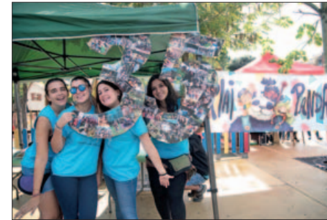
MOGUDA PANDA

Aniversaris durant la FM 35 anys de l'Esplai Panda 30 anys Centro Cultural Andaluz 20 anys la Penya Els Bartomeus 18 anys aniversari de la geganta Angeleta