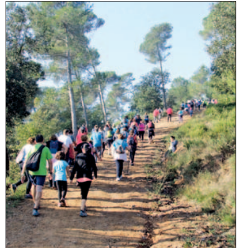
UN MOMENT DE LA MARXA DE L'ANY PASSAT

Més info: 93 572 36 13 (dl. dm. i dv. de 18 a 20 h) i al web del club. |