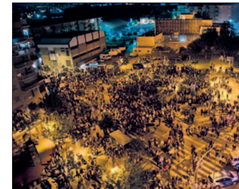
VISTA GENERAL DE L'AJUNTAMENT ABANS DEL PREGÓ