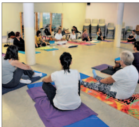
TALLER DE IOGA, AL CASAL DE CULTURA

El Casal de Cultura ha donat el tret de sortida al curs 2017-18 amb 43 tallers de dansa, manualitats, tecnologia, cuina, salut i costura. Més de 600 persones ja han començat les sessions que aquest any presenten més flexibilitat horària. A més, a la programació de l'equipament s'han incorporat dos nous cursos: biodansa i boixets. La varietat de propostes permet que n'hi hagi per a tots els gustos i edats. Enguany, les disciplines amb més demanda han estat pilates, ioga, hipopilates i gimnàstica hipopressiva. |