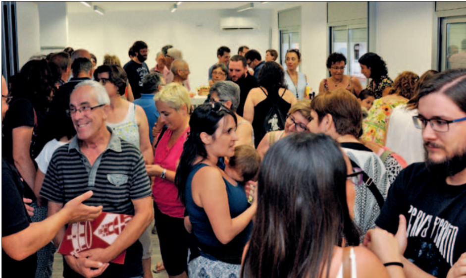
REPRESENTANTS D'ASSOCIACIONS SOCIOCULTURALS DURANT LA PRESENTACIÓ DE L'HOTEL D'ENTITATS (JULIOL DE 2016)

La Mostra tindrà lloc el 4 de novembre a la plaça de Pau Picasso. A més d'estands per mostrar el seu treball, les entitats preparen tot un programa d'activitats complementàries.