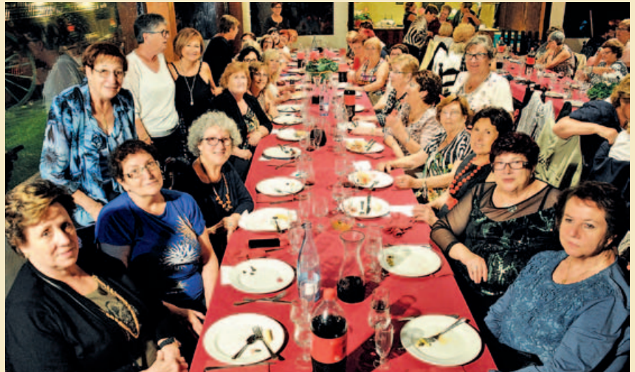
MOMENT DE LA TROBADA CELEBRADA EL 29 DE SETEMBRE

El remodelat edifici de Can Saurina esdevindrà un equipament cultural que, a més d'acollir Ràdio Montornès, serà l'emplaçament d'una sala d'exposicions, d'una sala multimèdia i tindrà un espai per a l'exposició permanent del Terminus Augustalis, la fita terminal d'època de l'emperador August ubicada fins ara a Can Xerracan. |