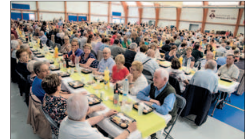
BERENAR PER A LA GENT GRAN