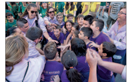
COLLA INFANTIL