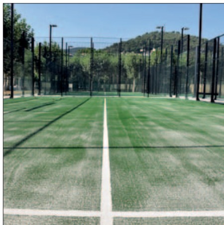
PISTES DE PÀDEL A LA ZONA ESPORTIVA MUNICIPAL LES VERNEDES

Durant els darrers mesos s'han continuat desenvolupant treballs de manteniment i millora al Complex Esportiu Municipal Les Vernedes entre els quals, la instal·lació d'una nova deshumectadora a la piscina coberta, l'adequació del sistema d'aigua a vestidors i piscina, l'arranjament de la zona d' spa i la substitució del paviment. A l'exterior, s'ha enllestit la construcció de quatre pistes de pàdel, instal·lades al costat de la remodelada pista de frontennis. Ara serà el torn de la sala de fitness i la renovació de l'equipament esportiu cardiovascular i muscular. |