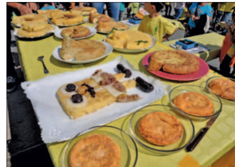
EL CONCURS "EL TORTILLANTÓN"