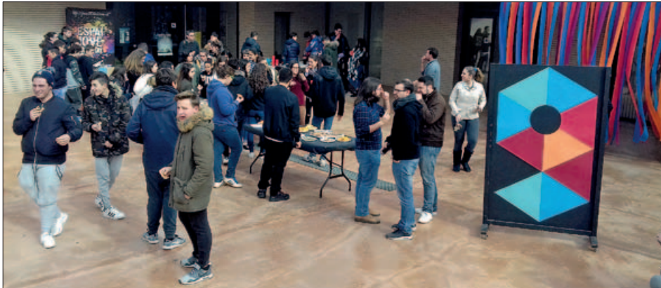
UNA DE LES SESSIONS DEL PROCÉS PARTICIPATIU PER ESCOLLIR EL MODEL DEL NOU CENTRE JUVENIL

L'Ajuntament ha descartat reformar algun dels edificis municipals existents per manca de condicions i planteja una construcció nova en un espai encara per determinar. El nou centre respondrà a les conclusions del procés participatiu celebrat fa uns mesos en què van intervenir més de 800 joves.