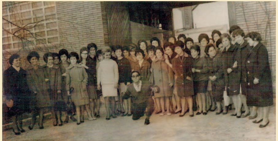
TREBALLADORES DE CYDSA VITAMOL DE MONTORNÈS I DE BARCELONA, A LA PORTA DE LA FÀBRICA DE MONTORNÈS, EL DIA D'UNA TROBADA DE LES QUE HABITUALMENT S'ORGANITZAVEN AL MES DE MAIG. PRIMERS ANYS DE LA DÈCADA DE 1960.

Un centenar d'antigues treballadores de CYDSA Vitamol , una de les primeres indústries de cosmètica que hi va haver al municipi entre els anys 50 i 60, s'han retrobat en un sopar després de més de 50 anys. |