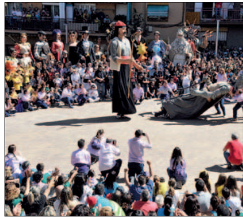
DANSA DE LA BATALLA, A LA PL. DE JOAN MIRÓ

Pregó i Cremada de l'Ajuntament: 1.500 persones Zona de concerts: 4.000 persones Fontapa: 2.500 persones Espectacle Corbacho 5.0: 1.000 persones Concert de l'Orquestra Maravella: 1.000 persones Berenar per a la gent gran: 800 persones Holi Jove: 800 persones Moguda Panda: 500 persones Castell de focs (final FM): 350 persones