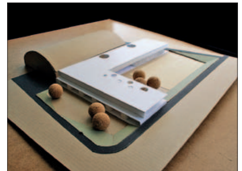
MAQUETA DE LA NOVA ESCOLA

La intenció municipal és que els treballs es puguin iniciar abans de final d'any. |