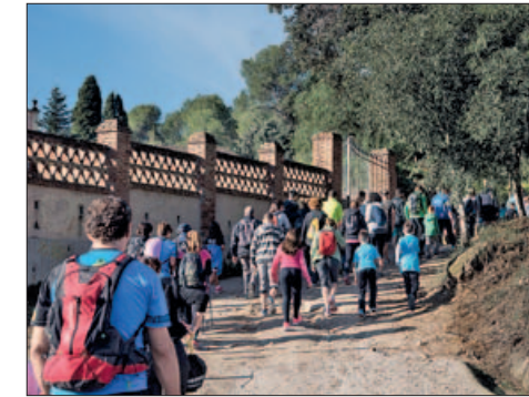
PUJADA AL CASTELL DE MONTORNÈS

Aniversaris durant la FM 35 anys de l'Esplai Panda 30 anys Centro Cultural Andaluz 20 anys la Penya Els Bartomeus 18 anys aniversari de la geganta Angeleta