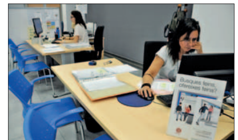
OFICINAS DE L'OPEC

El Consistori preveu contractar en pràctiques abans de final d'any entre 6 i 8 joves inscrits en el programa de Garantia Juvenil. Les persones interessades s'han adreçar al departament d'Ocupació, Promoció Econòmica i Comerç (c. de la Pau, 10). |