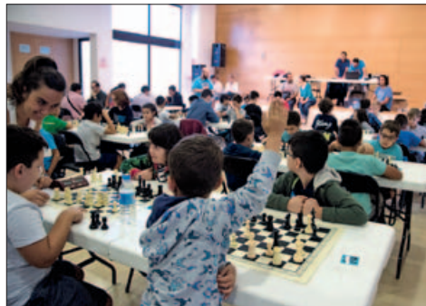
V CAMPIONAT D'ESCACS