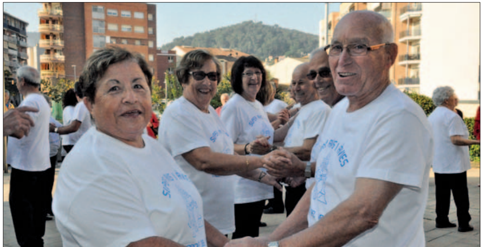
SESSIÓ DE BALLS DE SALÓ DURANT LA DIADA DE LA GENT GRAN 2016

Un any més la gent gran de Montornès farà visible el seu dinamisme i, durant aquest mes, celebrarà activament la seva Diada. També a l'octubre han arrencat les propostes per al nou curs als Casals.