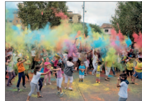
HOLI JOVE, A LA PL. DE PAU PICASSO