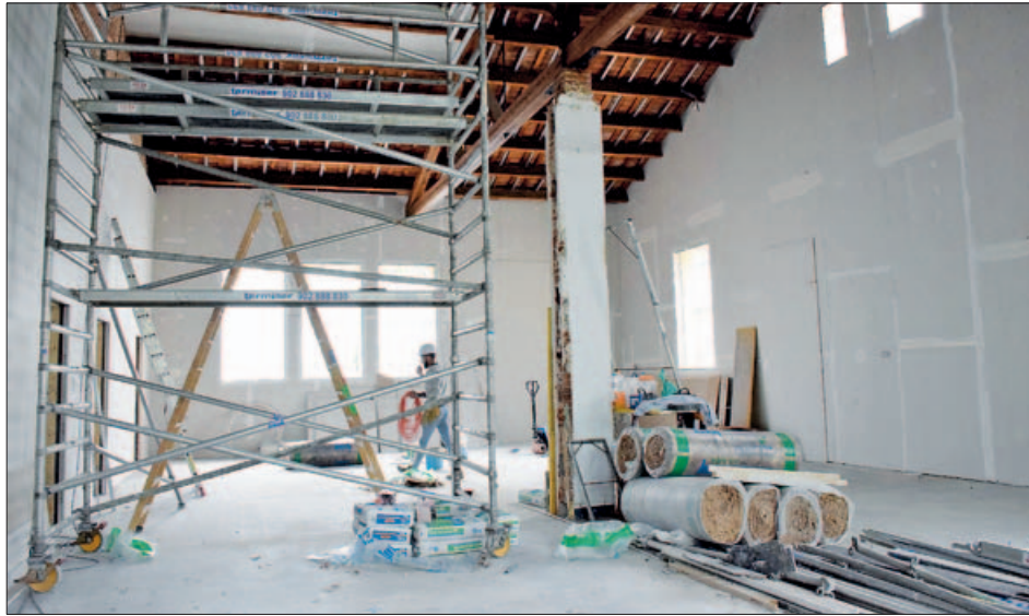
OBRES A L'INTERIOR DE L'EDIFICI DE PINTOR MIR

Les obres de remodelació que s'estan duent a terme a l'edifici de Pintor Mir, conegut com les "Antigues Escoles", serviran per habilitar-hi un centre amb prestacions i serveis dedicats a la infància.