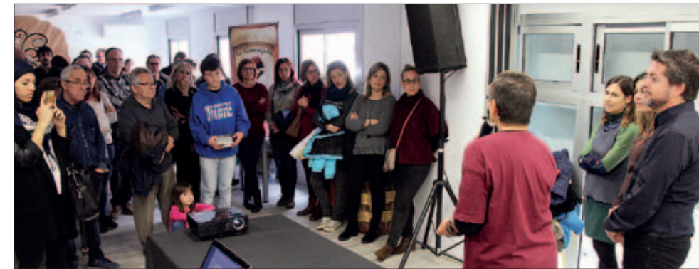
ACTE CENTRAL DE LA JORNADA DE PORTES OBERTES