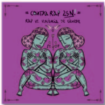
PORTADA DEL CD "CONTRARAP25N" (DISSENY DE MARTA MAGENTA)

L'àlbum es va posar a la venda el 25 de novembre al preu simbòlic de 2 €. Es pot adquirir al Centre Juvenil Satèl·lit i durant la celebració dels Parcs de Nadal. La recaptació es destinarà a col·laborar amb l'Associació de Dones per la Igualtat de Montornès (ADIM). |