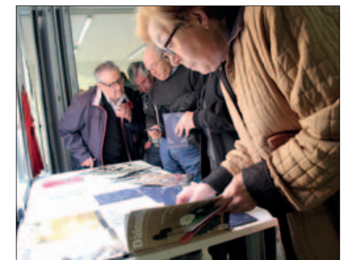
VISITANTS A L'HOTEL