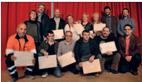
PARTICIPANTS EN EL CURS D'AUXILIAR DE GESTIÓ DE RESIDUS