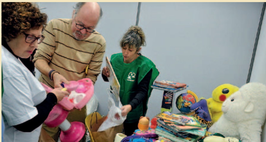
MEMBRES DE VOLUMONT PREPAREN ELS OBSEQUIS DE LA CAMpanyA

L'equip d'atenció primària de Montornès ha rebut el certificat d'acreditació de qualitat per la seva bona pràctica assistencial. A finals de novembre es va celebrar l'acte de lliurament dels certificats als 143 Equips d'Atenció Primària (EAP) de Catalunya que han aconseguit l'acreditació. |