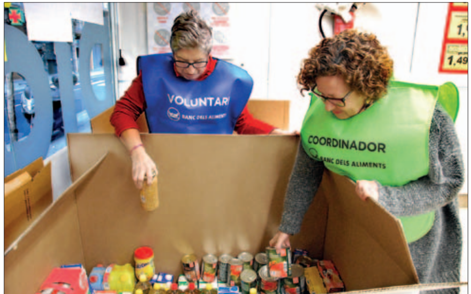
UN DELS PUNTS DE RECOLLIDA D'ALIMENTS

Els aliments recollits permetran atendre en bona part les necessitats bàsiques alimentàries de prop de 600 persones veïnes del poble, durant els propers 3 mesos.