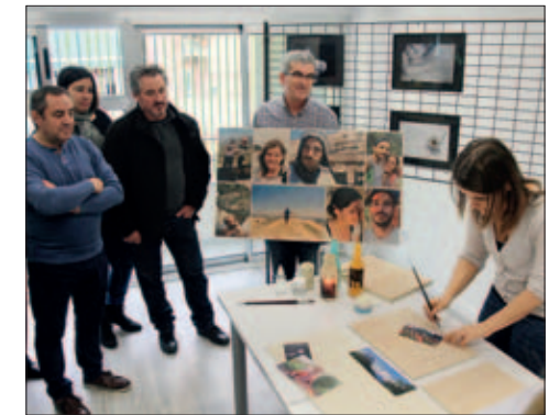
ACTIVITAT DE L'ASSOCIACIÓ FOTOGRAFICA DE MONTORNÈS