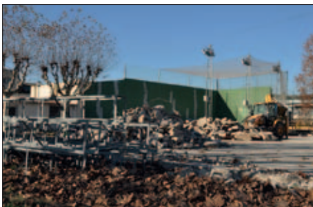
OBRES A LA PISTA POLIESPORTIVA I DE FRONTENNIS

En els darrers mesos també s'han millorat altres instal·lacions de la Zona Esportiva. S'han pintat les línies dels carrers de la pista d'atletisme i s'han reparat i pintat les pistes de tennis. Al camp de futbol s'ha renovat la gespa artificial i s'ha millorat el sistema de reg per mantenir en òptimes condicions l'estat del camp. |