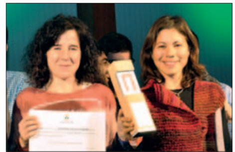
L'ÈQUIP VETERÀ DE CROS FEMENI DEL CLUB ATLETISME MONTORNÈS, MILLOR EQUIP SÈNIOR