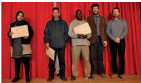
PARTICIPANTS EN EL CURS DE NETEJA D'EDIFICIS

Un total de 212 persones a l'atur han participat en el Dispositiu d'Inserció Laboral "DIL Barri", vinculat al Projecte d'Intervenció Integral de Montornès Nord, i subvencionat pel SOC a través del programa "Treball als barris".