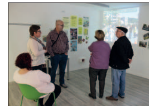
MOSTRA DE LES ACTIVITATS DE L'ASSOCIACIÓ DE VEÏNS I VEÏNES DEL CENTRE DE MONTORNÈS