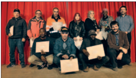
PARTICIPANTS EN EL CURS D'ALFABETITZACIÓ DIGITAL