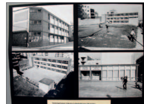
EXPOSICIÓ AMB DOCUMENTS HISTÒRICS SOBRE L'EDIFICI QUE ACULL L'HOTEL D'ENTITATS I L'ESCOLA SANT SADURNÍ