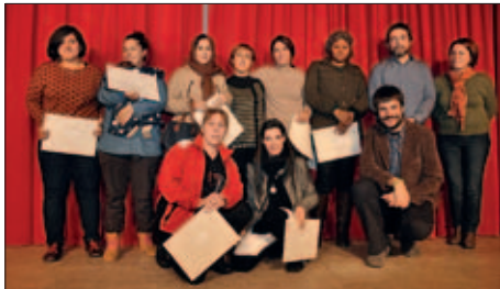
PARTICIPANTS EN EL PROGRAMA OLÍMPIA

En els darrers dies s'ha fet l'acte de cloenda del Dispositiu d'Inserció Laboral (DIL Barri-Olímpia) que s'ha desenvolupat durant l'any. El programa ha comptat amb més de 200 persones participants i una dotzena d'empreses col·laboradores. Les dones han estat objectiu específic del dispositiu amb la incorporació del programa Olímpia.