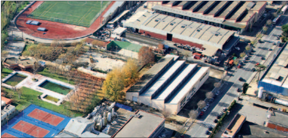
VISTA AÈRIA D'UNA DE LES ZONES INDUSTRIALS DE MONTORNÈS