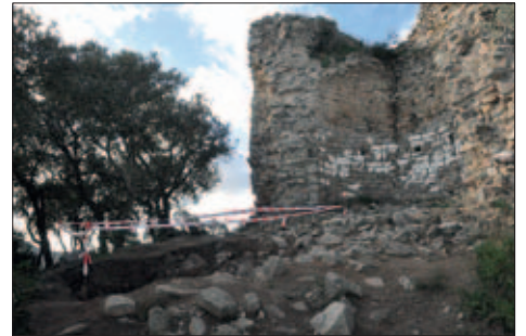
EXCAVACIONS AL CASTELL DE SANT MIQUEL

A principis de desembre van començar les excavacions al castell de Sant Miquel. Dels treballs arqueològics que s'estan fent en aquesta fase del projecte, s'extrauran fotografies, dibuixos, planimetria i una memòria que serviran per elaborar el Pla Director del Castell. Aquest pla determinarà el procés per aconseguir la consolidació i la museïtzació de l'espai.