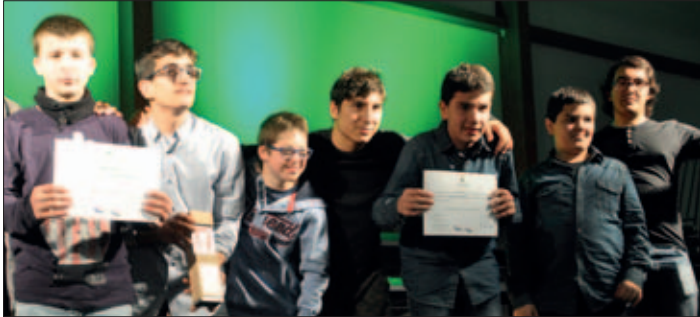
ELS SPECIALS DEL CLUB BÀSQUET VILA MONTORNÈS, MILLOR EQUIP INFANTIL

Més de 500 persones es van reunir el 2 de desembre a la carpa polivalent El Sorralet per premiar els millors esportistes de la temporada 2015-2016