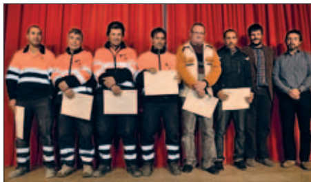
PARTICIPANTS EN EL CURS D'AUXILIAR DE COMERÇ I MAGATZEM