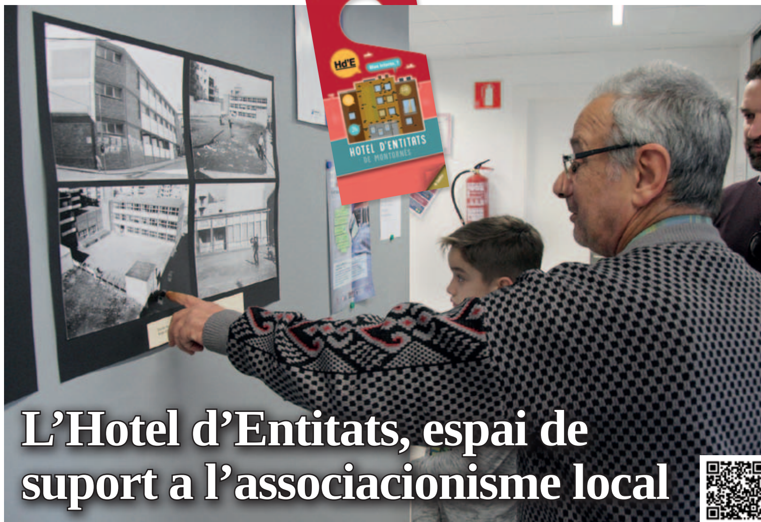
JORNADA DE PORTES OBERTES A L'HOTEL D'ENTITATS