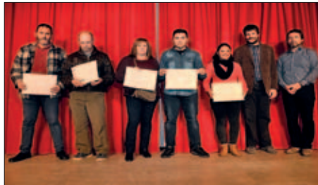
GRUP D'ACREDITACIÓ DE COMPETÈNCIES EN TECNOLOGIES DE LA INFORMACIÓ (ACTIC)