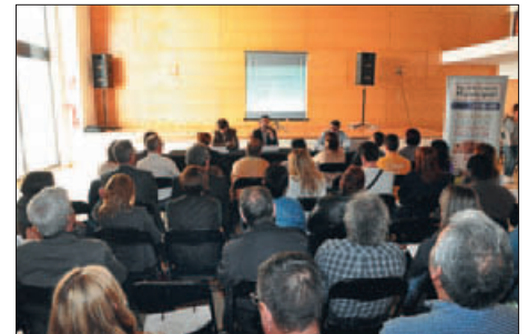
PRIMER TALLER REALITZAT EL 13 D'ABRIL