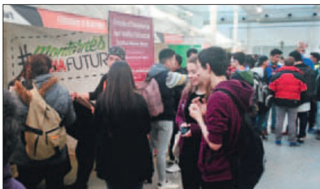
L’ESCOLA D’HOTELERIA DEL VALLÈS ORIENTAL, PRESENT AL FIRA GUIA’T

Els cicles han estat presents a la darrera edició del Fira Guia’t que s’ha celebrat a Granollers. |