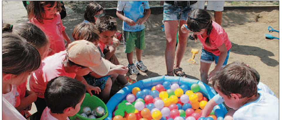
ACTIVITATS CASAL D'ESTIU (IMATGE D'ARXIU)

Dins d'una vessant més esportiva, hi ha el Campus Esportiu, gestionat directament per l'Ajuntament, que es desenvoluparà també del 27 de juny al 29 de juliol i que també ofereix serveis optatius d'acollida i menjador. Les persones ja preinscrites a les activitats hauran de formalitzar la inscripció del 2 al 15 de maig.