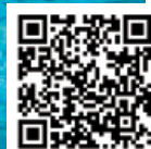
CURSETS DE NATACIÓ A LA PISCINA COBERTA DEL COMPLEX ESPORTIU

Les Vernedes celebrarà el 7 de maig el primer aniversari de l'obertura de les instal·lacions sota la gestió directa de l'Ajuntament. Amb la posada en marxa, quedaven enrere les dificultats per resoldre el contracte amb l'empresa concessionària per greus incompliments, i tres mesos