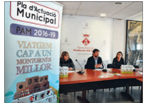
PRESENTACIÓ DEL PROJECTE ALS MITJANS DE COMUNICACIÓ