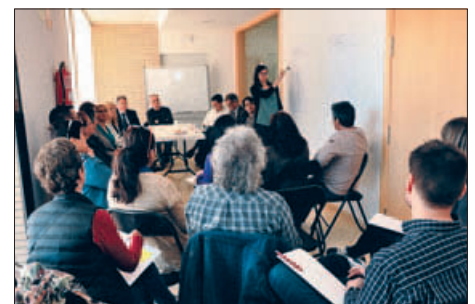
UN DELS GRUPS DE TREBALL