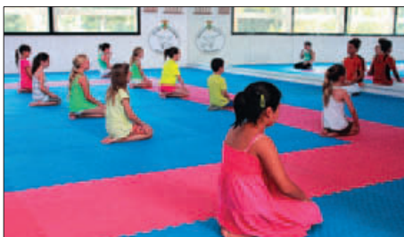
CAMPUS ESPORTIU DEL CLUB DE KARATE (IMATGE D'ARXIU)

A tot això se sumen les Colònies d'estiu de l'Esplai Panda que tindran lloc del 24 al 31 de juliol a la casa Els refugis (Serinyà, el Pla de l'Estany). El període d'inscripcions s'iniciarà el 2 de maig fins a exhaurir les places.