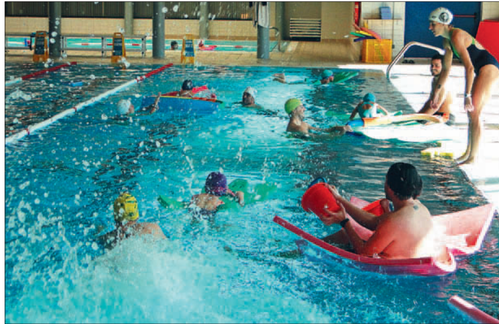
CURSOS DE NATACIÓ PER A INFANTS

feina per deixar l'equipament en condicions òptimes. Avui, el Complex Esportiu Les Vernedes té 1.850 persones abonades, atén més de 600 infants cada trimestre en els cursos de natació i, durant aquest estiu, acollirà el campus esportiu per a infants de 3 a 12 anys.