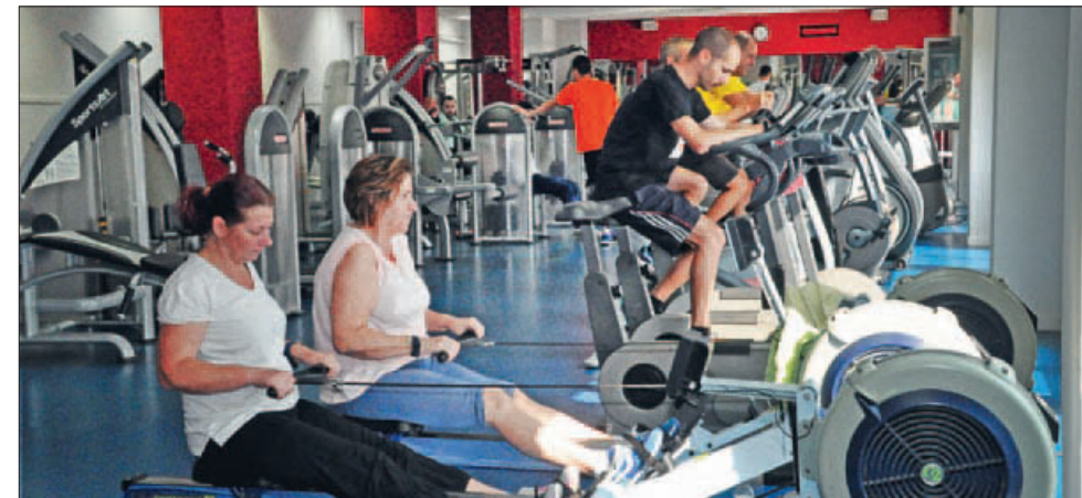
SALA DE FITNESS

En els mesos precedents a l'obertura, la Brigada Municipal d'Obres i tècnics municipals van treballar en el condicionament i la millora de totes les instal·lacions que anteriorment gestionava l'empresa concessionària (pavelló d'esports, piscines d'estiu, piscines cobertes, bar i vestí-