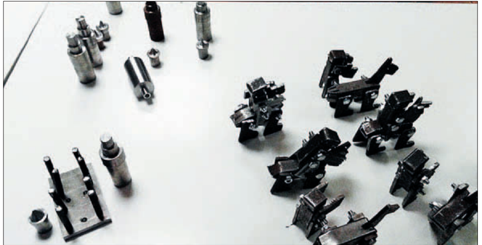
TREBALLS REALITZATS PER ALUMNES DE FABRICACIÓ MECÀNICA I D’AJUST I SOLDADURA

Aprendre a fabricar mecanismes, construir i muntar estructures i elements metàl·lics o soldar, són algunes de les habilitats que aprèn l’alumnat del curs d’Auxiliar de Fabricació mecànica i d’ajust i soldadura del Pla de Transició al Treball (PTT).