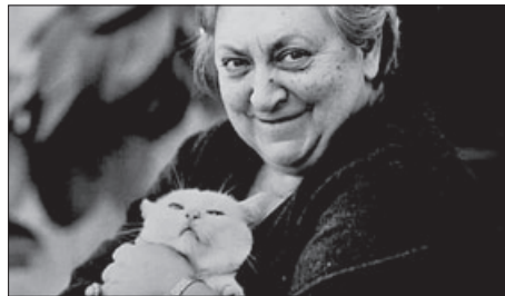
MARIA AURÈLIA CAPMANY

mes relacionats amb la dona. De fet, el seu feminisme es feia evident tant en la seva actitud pública com en molts dels seus escrits, entre els quals destaquem la novel·la Felicitat, jo sóc una dona (1983). En la seva vessant com a la política, va ser regidora i responsable de les àrees de Cultura i d'Edicions de l'Ajuntament de Barcelona en la primera legislatura del PSC i membre de la Diputació de Barcelona des del 1983 fins a la seva mort.