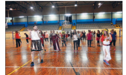
SESSIÓ D'AERÒBIC ESPECIAL CARNAVAL

porat 4 màquines cardiovasculars a la sala de fitness, s'han comprat 21 bicicletes de ciclisme indoor i, amb la voluntat d'integrar les aportacions de les noves tecnologies, hi ha classes amb un suport audiovisual que permet realitzar recorreguts virtuals sobre itineraris reals.