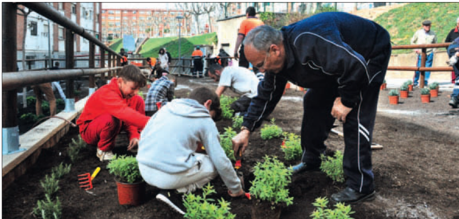
UN MOMENT DE LA PLANTADA DEL JARDÍ URBÀ

El jardí, que s'ha habilitat al carrer del Nou d'abril, respon al treball realitzat conjuntament pel veïnat, l'Oficina del barri i l'equip urbanístic del Pla Estel, amb qui també s'han desenvolupat processos participatius per a la remodelació d'altres espais del municipi com la plaça de Joan Miró.