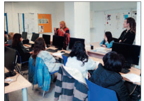
SESSIÓ INFORMATIVA SOBRE EL CURS DE MONITOR/A DE LLEURE

També aquest mes d'abril s'ha iniciat un curs de 310 hores, de monitor/a d'activitats d'educació en el lleure infantil i juvenil en què participen una quinzena de persones de la Borsa de Treball Municipal i del programa d'inserció laboral "Endavant Jove!" |