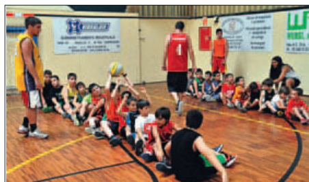
CAMPUS ESPORTIU DEL BÀSQUET VILA DE MONTORNÈS (IMATGE D'ARXIU)