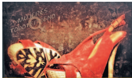
1r PREMI FOTOGRAFIA "MUJERES TODOTERRENO" DE SERGIO LÓPEZ