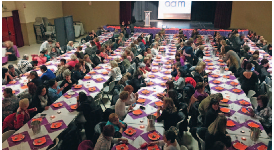
V SOPAR DE DONES