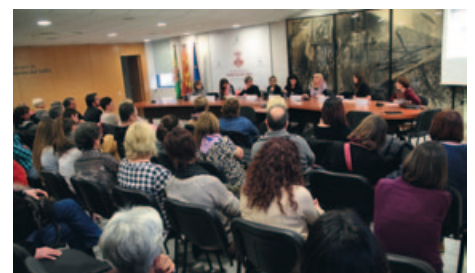
TAULA RODONA "AMB VEU DE DONA, LIDERATGES FEMENINS"