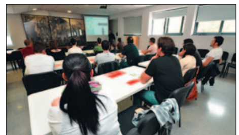
SESSIONS DE FORMACIÓ A L'AJUNTAMENT (IMATGE D'ARXIU)

Un total de 25 veïns en situació d'atur, i inscrits a la Borsa de Treball Municipal, participaran després de Setmana Santa en la formació de Cobega sobre les línies d'envasament. L'objectiu, igual que en altres edicions i ja en són sis de consecutives, és que les persones que superin la formació s'incorporin a la borsa de treball de l'empresa per reforçar la plantilla en properes campanyes.