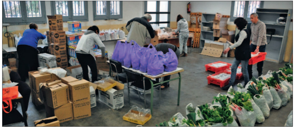
PER NADAL ES PREPAREN LOTS EXTRAORDINARIS AMB LA COL-LABORACIÓ D'EMPRESSES DE L'ENTORN (IMATGE D'ARXIU)

L'Ajuntament, la Unió de Botiguers, Volumont i Càritas de Montornès han renovat la seva col·laboració en la distribució d'aliments frescos per a famílies en situació de vulnerabilitat. També se seguiran cobrint les necessitats bàsiques alimentàries d'infants i de gent gran.