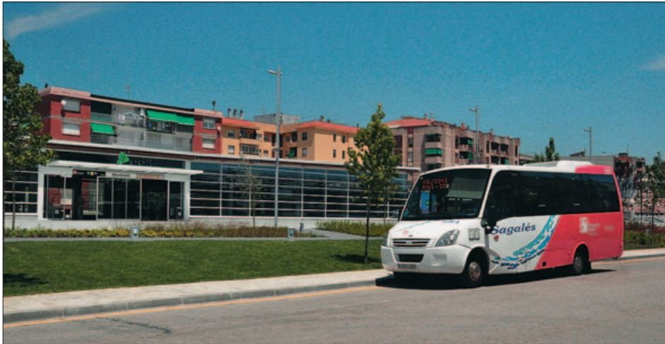
ESTACIÓ DE RODALIES DE RENFE A MONTMELÓ

L'Ajuntament manté dues propostes de treball: la millora de la freqüència de pas i puntualitat del servei de bus actual que connecta amb l'estació de Montmeló i la possible creació d'una línia que enllaci Montornès, Vilanova i Vallromanes amb el tren.