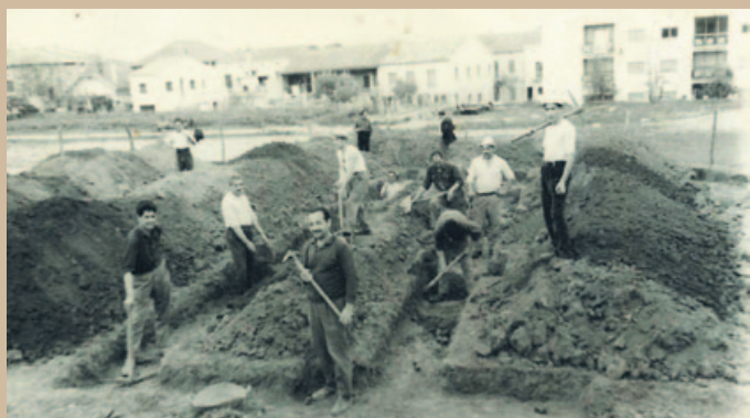
CAVANT PER FER ELS FONAMENTS DEL BLOC. 1965.