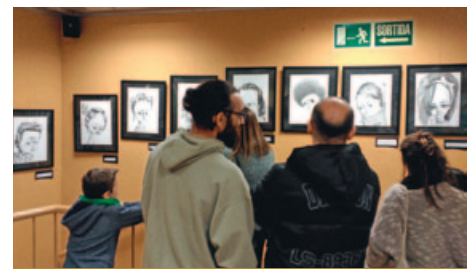
EXPOSICIÓ "ALGUNES" A LA BIBLIOTECA