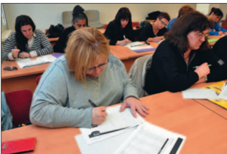
UN DELS DARRERS DIL ORGANITZATS PER L'AJUNTAMENT

El programa compta amb el suport del Servei Públic d'Ocupació de la Generalitat i acumula l'experiència dels DIL Jove de 2012 i 2013, el DIL Dona de 2013 i el DIL Barri de 2014. |