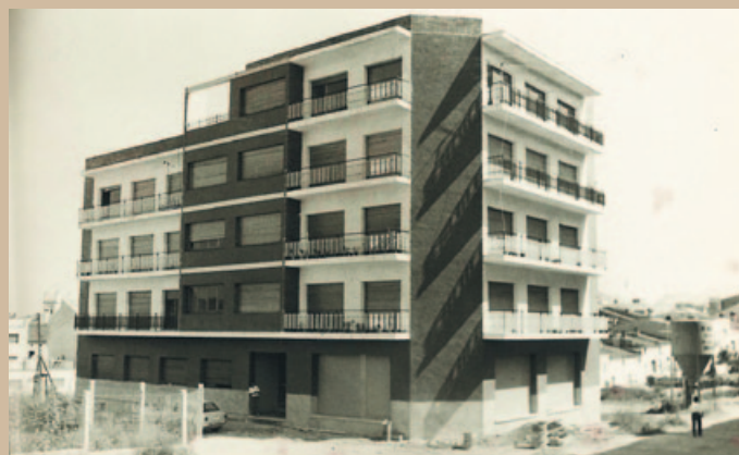
EL BLOC ACABAT, CAP A 1967. AMMV. COL·LECCIÓ DE JOAQUIMA BOLART. AUTOR DESCONEGUT