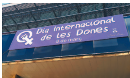
PANCARTA COMMEMORATIVA AL BÀLCÓ DE L'AJUNTAMENT