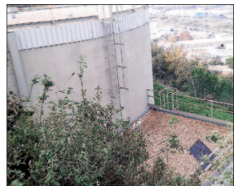
NOU DIPÒSIT D'AIGUA A CAN BOSQUERONS

L'abast de subministrament del dipòsit inclou el barri del Castell, Can Bosquerons de Dalt, Manso Coll, les zones del polígon industrial de Can Bosquerons de Baix, el Telègraf, Casablanca, Vinyes Velles, Can Coll, Can Comas, Can Sala i l'est de Can Xec. |