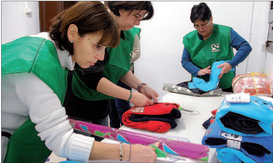
PERSONES VOLUNTÀRIES DE VOLUMONT PREPAREN ELS OBSEQUIS DE LA CAMpanyA "UN SOMRIURE PER A TOTHOM".

tribuit 50 lots familiars de productes bàsics i, amb l'ajut de Càritas i la Unió de Botiguers, es farà un lot especial d'aliments frescos a les famílies més necessitades.