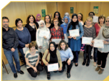
PARTICIPANTS EN EL PROJECTE CLARA