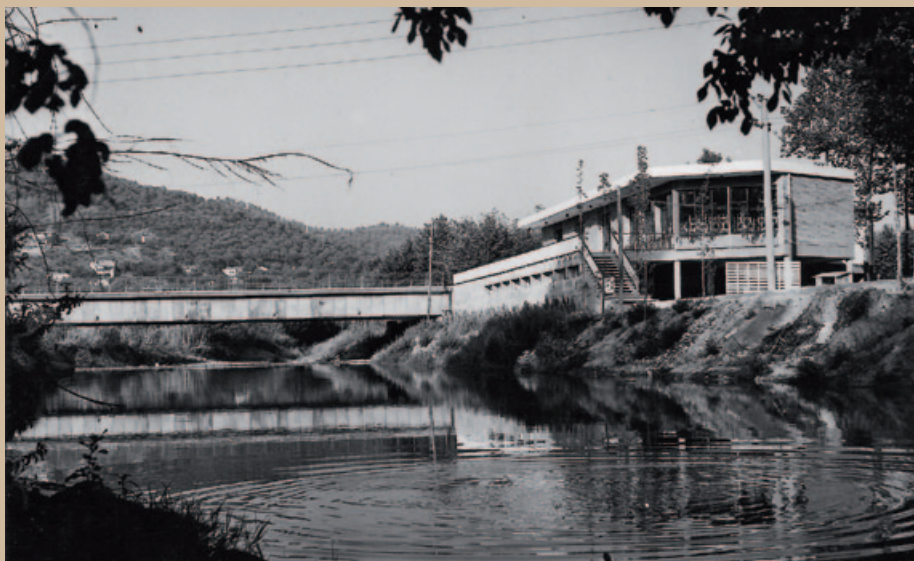
EL PONT DEL MOGENT AL COSTAT DE L'SNACK BAR, ACTUAL CASAL DE CULTURA. DÈCADA DE 1960. POSTAL EDICIONS GURRI. AMMV

El document, signat pel secretari Juste i per l'alcalde Torrents, parla del pont com de "una vieja y constante aspiración de