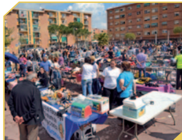
MERCAT DE SEGONA MÀ, A LA PLAÇA DEL POBLE