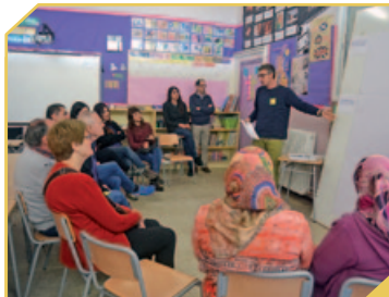
LA REFORMULACIÓ DEL PROJECTE, A DEBAT