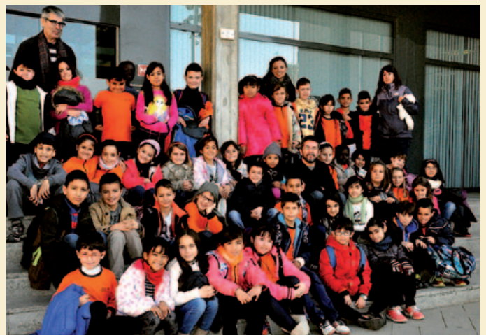
ALUMNES DE 3R DE L’ESCOLA MOGENT (3 DE DESEMBRE DE 2015)