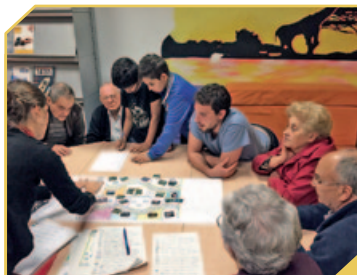
PLANIFICANT EL JARDÍ URBÀ