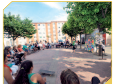
ESTIU EN CONVIVÈNCIA