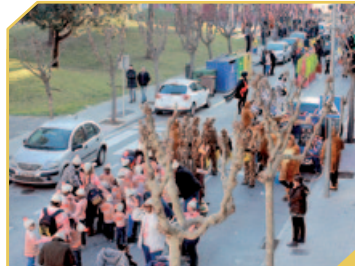
MONTORNÈS NORD GUARNIT PER AL CARNAVAL