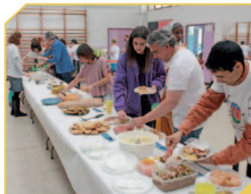
MENJARS DEL MÓN DEL PROGRAMA "FINDE CULTURAL"