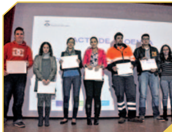
PARTICIPANTS AL DISPOSITIU D'INSERCIÓ LABORAL