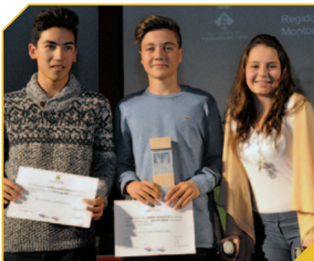
EL JUVENIL KATA MIXT DEL CLUB KARATE MONTORNÈS, MILLOR EQUIP INFANTIL