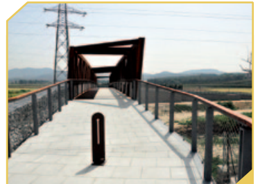
PASSAREL·LA SOBRE EL RIU MOGENT