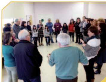
PRIMERA TROBADA DE MEMBRES DEL BANC DEL TEMPS