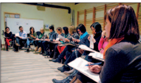
PRIMERA TROBADA DE L'EDE A L'ESCOLA CAN PARERA