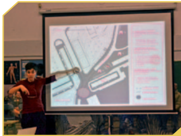
DISSENYANT L'ESPÀI PÚBLIC AMB EL VEINAT