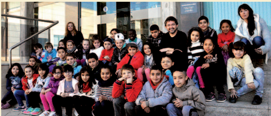
ALUMNES DE 3R DE L’ESCOLA MARINADA (17 DE NOVEMBRE DE 2015)

lebrada el 26 de novembre a l’Espai Cultural Montbarri va comptar amb la col·laboració de l’Escola Municipal de Música, Dansa i Aula de teatre, i de la Coral La Lira. |