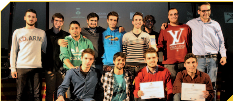
EL SOTS 21 MASCULÍ DEL CLUB BÀSQUET VILA DE MONTORNÈS, MILLOR EQUIP SÈNIOR