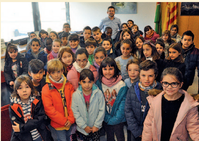
ALUMNES DE 3R DE L’ESCOLA CAN PARERA (24 DE NOVEMBRE DE 2015)