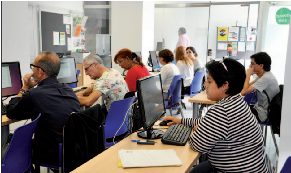
CLUB DE FEINA DEL DEPARTAMENT DE PROMOCIÓ ECONÒMICA

L'Ajuntament duu a terme els processos de selecció per ocupar 12 llocs en el marc de "Treball als barris" i engegarà el programa "Endavant Jove!" per ajudar a la inserció laboral de joves menors de 30 anys