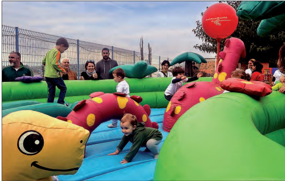
INFLABLES EN LA FESTA D'ANIVERSARI DE LA LLAR D'INFANTS

Al voltant de 450 alumnes d'entre 0 i 3 anys han passat pel centre durant els primers deu anys de funcionament. L'equipament potencia un ensenyament de qualitat orientat a la formació integral de les persones.