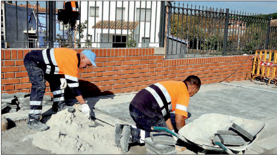
OPERARIS DE LA BRIGADA MUNICIPAL D'OBRES, CONTRACTATS A TRAVÉS DELS PLANS D'Ocupació LOCAL, FENT TREBALLS DE MILLORES A L'AVINGUDA D'ICÀRIA

Aquest dies s'enllesteixen les darreres contractacions previstes en els Plans d'Ocupació Local (POL) d'aquest any. Des de la posada en marxa del programa el 2013, l'Ajuntament ha donat feina a més d'una vuitantena de persones.