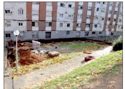
ESPai DESTINAT A JARDÍ URbÀ ALS DARRERES DELS BLOCs DEL CARRER DEL NOU D'ABRIL

El projecte es dinamitza a través del programa Viu i Conviu a l'espai públic que s'està desenvolupant a Montornès Nord. |