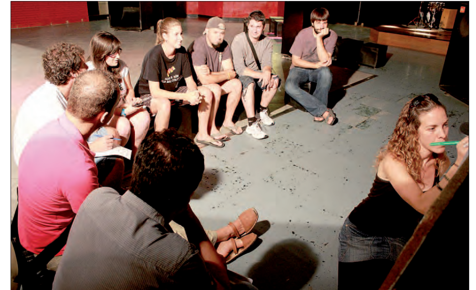
PRIMER FÒRUM JOVE. JULIOL DE 2014

Bona part de les actuacions, 29 en total, donen continuïtat a accions que ja s'han posat en marxa com els dispositius d'orientació i