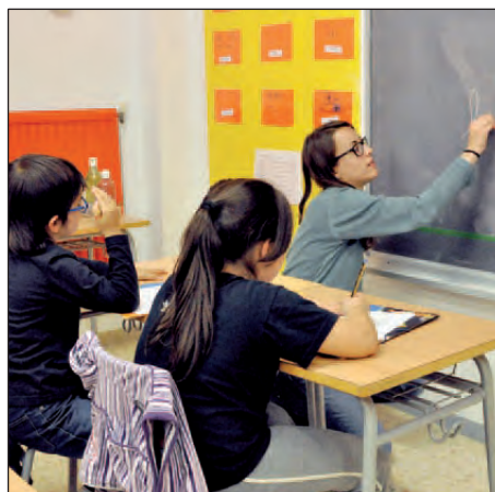
GRUP DE LECTURA I ESCRITURA DE PRIMÀRIA A L'ESCOLA PALAU D'AMETLLA

El projecte també inclou una aula de reforç per a estudiants de secundària a l'Institut Marta Mata. |