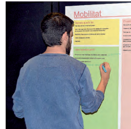
TREBALLANT PROPOSTES AL FÒRUM JOVE DE GENER DE 2015

De l'anterior Pla Jove, hi ha diverses actuacions