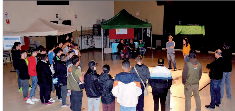
FESTA PRESENTACIÓ DEL PLA JOVE, AL TEATRE MUNICIPAL

El Pla Jove té la voluntat d'oferir oportunitats, recursos i serveis perquè el jovent pugui viure plenament; i pretén promoure'n l'empowerment i l'exercici de la lliure ciutadania. Tot plegat tenint en compte les transformacions