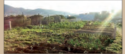
HORTS SOCIALS A MONTORNÈS NORD

Hace más de año y medio, el Ayuntamiento acondicionó unos terrenos en Montornès Norte, divididos en parcelas de unos 30 m2, destinadas al cultivo de verduras y hortalizas para el consumo propio.