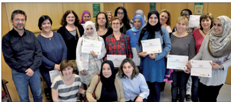
PARTICIPANTS EN EL PROJECTE CLARA

Durant les darreres setmanes ha finalitzat el projecte CLARA. Montornès és l'únic municipi de Catalunya que ha desenvolupat enguany aquest programa subvencionat per l'Institut de la Mujer.