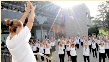
GIMNÀSTICA ALS JARDINS DE L'AJUNTAMENT

La Gent Gran torna a brillar en la seva Diada. Un any més, són moltes les persones grans del poble que participen activament i gaudeixen amb les activitats organitzades a l'entorn de la Diada de la Gent Gran. |