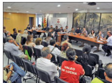
UNA REPRESENTACIÓ DE LA PLANTILLA DE VALEO AL PLE DE L'AJUNTAMENT

"Jo no venc alcohol a menors", una de les primeres accions de "la PEPA". Una cinquantena de persones entre fires, comerciants i representants d'entitats van participar al setembre en el primer curs de dispensació responsable de begudes alcohòliques que s'ha desenvolupat a Montornès. |