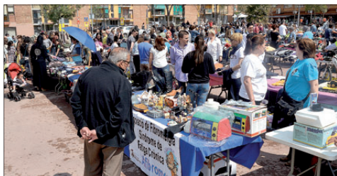
MERCAT DE SEGONA MÀ A LA PLAÇA DEL POBLE, UNA DE LES ACCIONS SOCIALS INCLOSES AL PII

L'Ajuntament prepara la petició de pròrroga per completar el Projecte d'Intervenció Integral de Montornès Nord. El document recollirà les línies de treball per continuar i reforçar els programes socials i incorporarà propostes i suggeriments del veïnat.