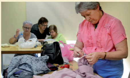
SESSIÓ "APUNTA'T A FER PUNT" A LA BIBLIOTECA

Les dones interessades a participar es poden adreçar a l'Oficina del Barri o posar-se en contacte a través del correu igualtat@montornes.cat |