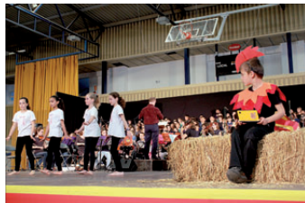
CANTATA DE SANT JOAN 2015

educatius del poble. Amb la seva participació activa en tota mena d'esdeveniments, s'ha convertit en un vehicle de transmissió cultural ple dels valors socials que caracteritzen un servei públic integrador i de qualitat.