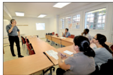
UNA DE LES SESSIONS DEL CICLE

És la quarta vegada que el Departament Municipal de Promoció Econòmica organitza una programació d'aquest tipus. El projecte compta amb el suport de la Diputació de Barcelona. |