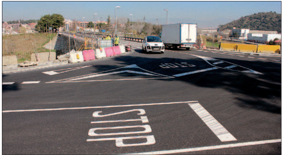
SITUACIÓ DE L'ACCÉS AL PONT DES DE LA CARRETERA DE LA ROCA

Durant les darreres setmanes ha començat a funcionar el tercer carril d'incorporació a la carretera i d'accés al pont, que ja torna a estar obert al trànsit. La Diputació enllesteix les darreres feines de senyalització, enllumenat i acabats.