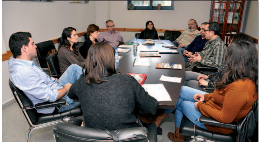
REPRESENTANTS DELS AJUNTAMENTS DE MONTORNÈS I DEL PRAT DEL LLOBREGAT

Els ajuntaments de Montornès i del Prat del Llobregat han intercanviat impressions sobre les intervencions en convivència que els dos municipis duen a terme a barris d'especial atenció.