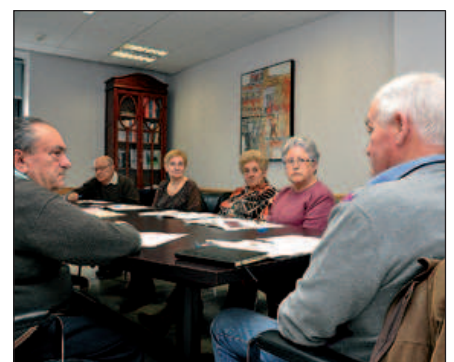
UN MOMENT DEL TALLER IMPARTIT PER L'SMC

Els membres de les Juntes dels Casals de la Gent Gran de Montornès han participat en un taller de gestió i resolució de conflictes impartit pel Servei de Mediació Ciutadana (SMC) que ha posat en marxa recentment l'Ajuntament.