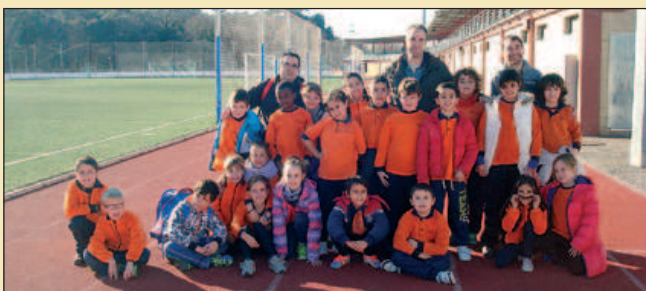
ALUMNES DE 3R A DE L'ESCOLA MOGENT

En resposta, la indignació dels pagesos esclata i expliquen a mossèn Benedicte la duresa de la seva vida sota el feudalisme, cosa que serveix per informar-ne el públic de La Remençada. |