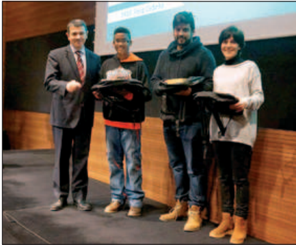
MOMENT DEL LLIURAMENT DEL PREMI. FONT: ESCOLA MARINADA

El vídeo titulat "Treball en equip" de l'Escola Marinada ha guanyat el 2n premi dels Mobile Learning Awards 2014, convocats amb motiu de la celebració del congrés mundial de telefonia celebrat al febrer a Barcelona.