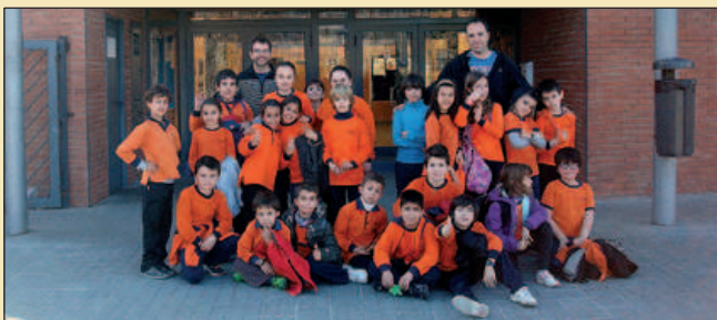
ALUMNES DE 3R B DE L'ESCOLA MOGENT