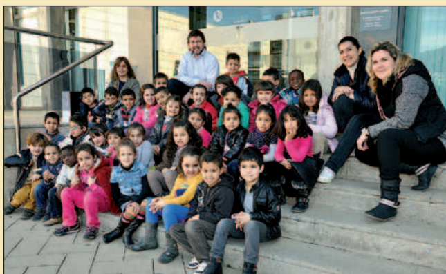
ALUMNES DE P5 DE L'ESCOLA MARINADA

Els escolars visiten les dependències municipals. El 4 i el 6 de febrer estudiants de 3r de l'Escola Mogent van visitar la Zona Esportiva Municipal. El 20 de febrer, els alumnes de P5 de l'Escola Marinada van fer un recorregut per l'Ajuntament guiats per l'alcalde, José A. Montero.