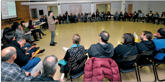
AUDIÈNCIA PÚBLICA DEL 4 DE MARÇ DEDICADA AL CIVISME I LA CONVIVÈNCIA

L'Ajuntament ha editat 500 díptics informatius sobre la nova ordenança reguladora de la tinença