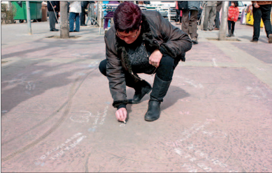
ACCIÓ REIVINDICATIVA DURANT LA VI FIRETA DEL CABÀS A LA PLAÇA FEDERICO GARCÍA LORCA

Bona part de les cites socials, culturals i esportives del mes de març han incorporat referències a la commemoració del Dia Internacional de les Dones i a la lluita a favor de la llibertat i del dret a decidir sobre el propi cos.