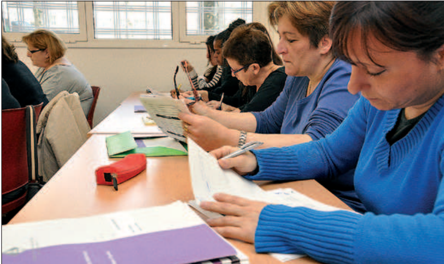
PARTICIPANTS AL TALLER DE COMPETÈNCIES LABORALS

Una seixantena de veïnes a l'atur han iniciat al març la formació del segon Dispositiu d'Inserció Laboral dedicat a les dones. En aquesta edició s'ha incorporat un espai d'alfabetització digital i el servei de "feinateca".