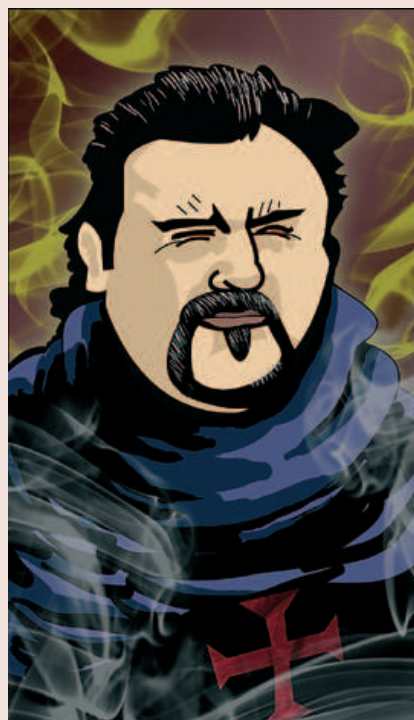
DIBUIX DEL PERSONATGE D'AUSIAS BERTRAN

L'obra comença amb l'incendi dels pallers de l'amo. Mossèn Benedicte intenta esbrinar si algun dels remences l'ha provocat i, tot seguit, els recorda la llei feudal: encara que un