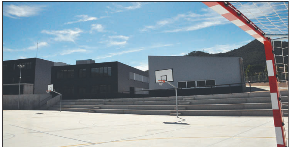
VISTES DE L'EDIFICI NOU DE L'INSTITUT MARTA MATA

L'Institut compta amb pistes esportives exteriors. L'Ajuntament, tot i no tenir les competències, ha avançat els diners per finançar les obres amb un import de sortida de 3.073.861,24 euros. |