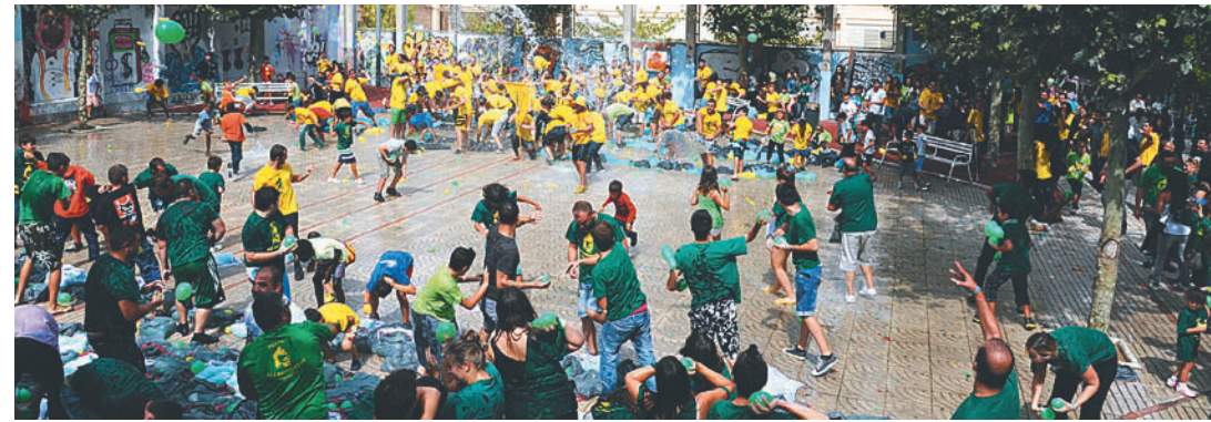
LES PENYES PERE ANTON I BARTOMEUS, A LA GUERRA DE GLOBUS D'AIGUA.

Des del pregó del Gran Wyoming i la cremada de l'Ajuntament fins al berenar i ball per a la nostra gent gran van passar tres dies intensos en què les entitats, les colles i el veïnat van vestir de festa, color i solidaritat el poble.