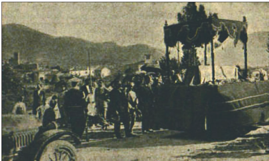
EL CARRUATGE AMB EL FÈRETRE D'ENRIC PRAT DE LA RIBA A L'ALÇADA DE LA CREU DE TERME. S'APRECIA A L'ESQUERRA EL CAMPANAR DE SANT SADURNÍ, I AL CENTRE LA TORRE DE CAN PRIMO.

L'impuls d'aquests anys també arribà a Montornès del Vallès, un poble eminent agrícola que tot just passava dels 1.100 habitants (on s'hi comptaven també els de Vallromanes i el Raval). La carretera, l'energia elèctrica, la línia telefònica i el primer pont de Montmeló van arribar en temps de la Mancomunitat.