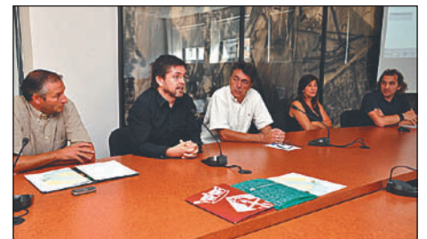
PRESENTACIÓ DEL PROJECTE A LA SALA D'ACTES DE L'AJUNTAMENT

L'objectiu és crear una plataforma d'accés als llocs de treball per tal que els demandants de feina es puguin adreçar a una Borsa de Treball virtual coordinada per totes les entitats. |