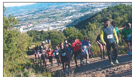
UN MOMENT DE LA MARXA POPULAR DE L'ANY PASSAT

El 27 d'octubre se celebrarà la XXII edició de la Marxa Popular. Com cada any, el Club Esportiu Montornès Atletisme proposa un recorregut de 8 Km per als menys preparats i un altre de 14 Km per als més agosarats. Els dorsals costen 8 euros i es poden trobar a diversos establiments de Montornès, Canovelles i Montmeló i també al web www.atletismemontornes.es . |