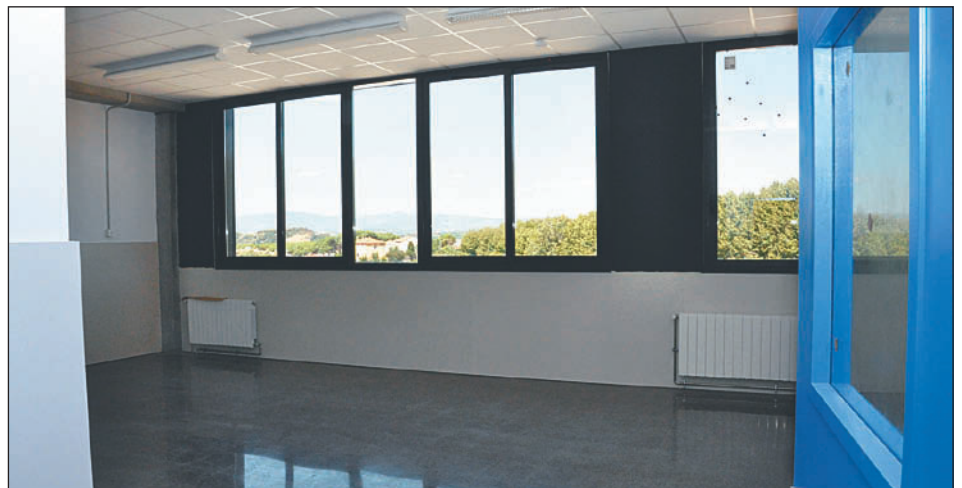
UNA DE LES AULES DE L'EQUIPAMENT