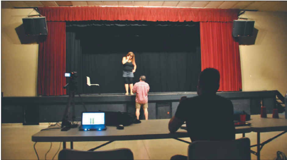
SESSIÓ DE CÀSTING AL TEATRE MUNICIPAL

Aquest mes d'octubre han començat els assajos de la Remençada, l'espectacle musical que recrea la darrera batalla de la Guerra dels Remences lliurada a Montornès el 1485. L'objectiu és poder estrenar el musical, que es representarà en moviment al carrer, el maig de 2014.