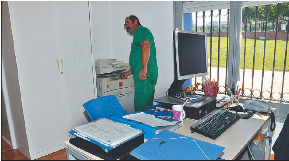
PERSONAL DE SUPORT A LA SEU DEL PLA DE TRANSICIÓ AL TREBALL

De les 27 contractacions previstes als Plans d'Ocupació Local (POL) de 2013, resta pendent la convocatòria de 9 llocs de treball. Els plans inclouen un total de 17 programes que abasten gran part dels àmbits d'actuació municipal.