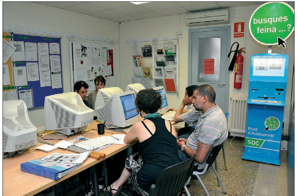
LA BORSA DE TREBALL MUNICIPAL OFEREIX ASSESSORAMENT ALS USUARIS

Els candidats han d'estar empadronats a Montornès i inscrits a la Borsa de Treball Municipal. Les persones interessades a inscriure's