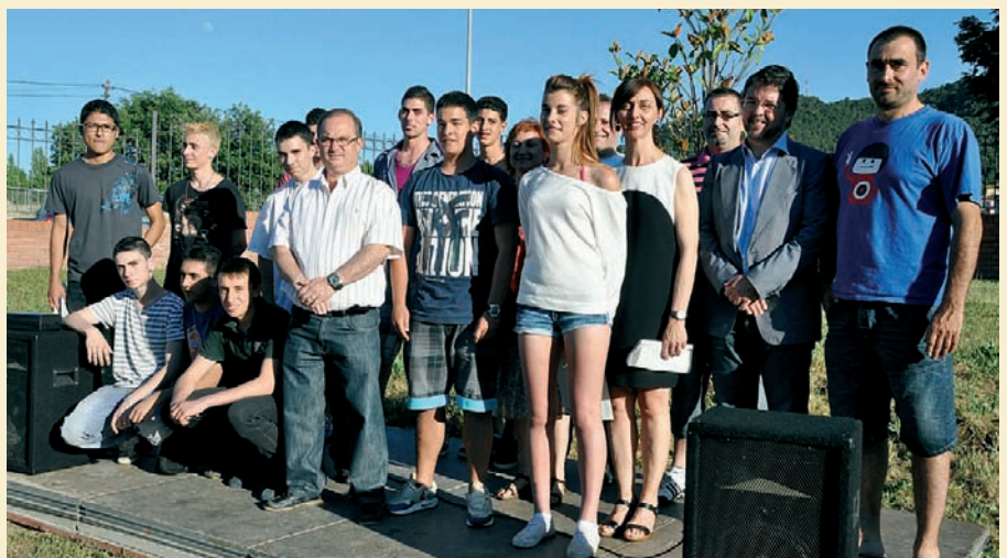
ALUMNES DEL MÒDUL D'AUXILIAR DE FABRICACIÓ MECÀNICA