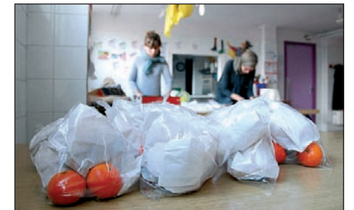
ESMORZARS I BERENARS PER ALS INFANTS

Els 5 plans que aglutina el projecte d'inclusió social per a la infància, la família i la gent gran es van posar en marxa al febrer. Es van contractar 4 persones durant sis mesos amb l'ajut del