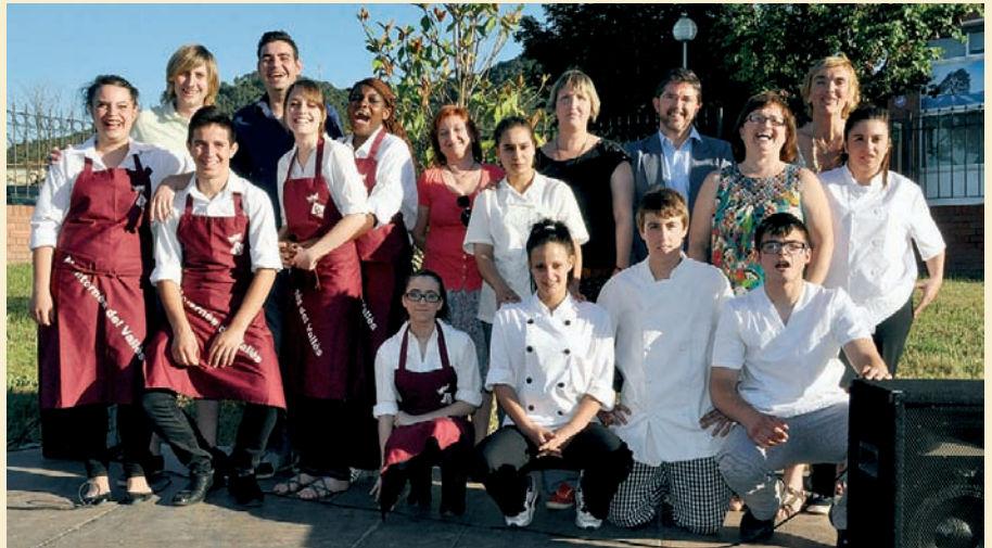
ALUMNES DEL MÒDUL D'HOTELERIA, CUINA I SERVEIS DE RESTAURANT

L'actualitat local es pot seguir des de fa unes setmanes a través del twitter que l'Ajuntament ha posat en marxa sota el perfil @ajmontornes. Amb la nova eina es pretén millorar el nivell d'informació que reben els veïns i potenciar la presència municipal a la xarxa, complementant el web montornes.cat, que durant aquest any ha rebut més de 80.000 visites, i el butlletí electrònic setmanal que compta amb 939 subscriptors. |