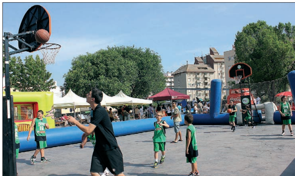
I DIADA SOLIDÀRIA D'ENTITATS ESPORTIVES, A LA PLAÇA DE PAU PICASSO

Les entitats esportives del poble van protagonitzar el 29 de juny una jornada presidida per la promoció de l'esport i dels valors solidaris. A més de mostrar la riquesa i diversitat de l'esport local es van recaptar fons per al projecte de distribució d'aliments frescos