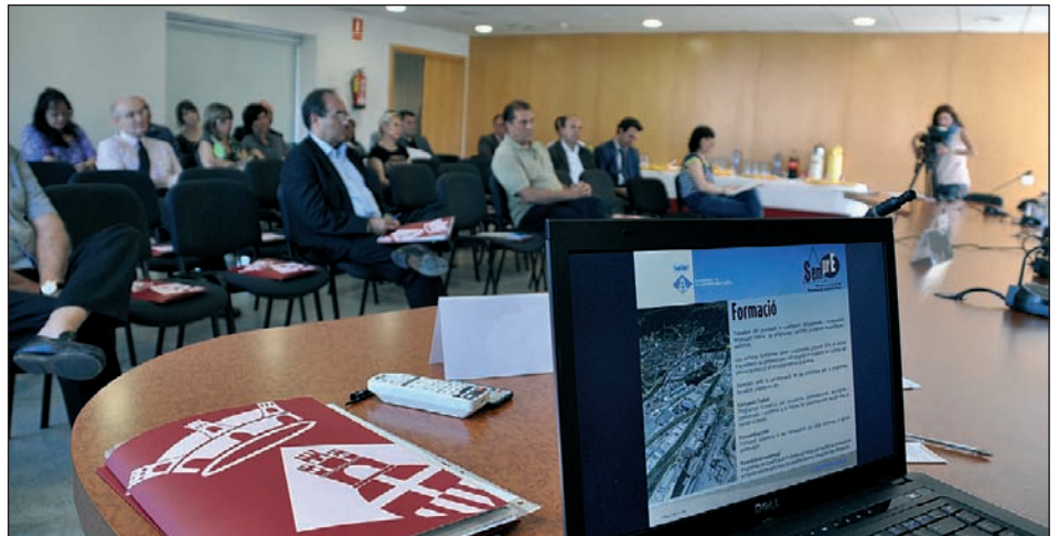
PRESENTACIÓ ALS EMPRESARIS DE LES MESURES PER ACTIVAR L'ECONOMIA LOCAL (12 DE JUNY DE 2013)

La partida dedicada a subvencions s'ha dotat amb 58.000 euros, dels quals 18.000 es dedicaran a la contractació de joves inclosos