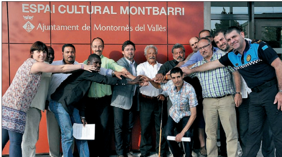
REPRESENTANTS DE L'AJUNTAMENT, DE L'AVV DE MONTORNÈS NORD I DE LES COMUNITATS ISLÀMICA, MUSULMANA AFRICANA I GITANA DEL BARRI

L'Ajuntament, l'AVV de Montornès Nord i els representants de les comunitats Islàmica, Musulmana Africana i Gitana del barri han signat un manifest de compromisos per al foment de la convivència als espais públics a l'estiu.