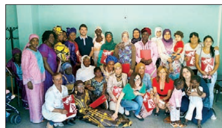
PARTICIPANTS EN LA PRIMERA EDICIÓ DEL "CATALÀ ACOLLIDA"

Aquest dies s'han engegat les classes de la segona edició del "Català acollida" amb una vintena d'alumnes, veïns de diverses procedències. En la primera edició, que es va impartir al Centre Infantil la Peixera, van participar 29 alumnes. Aquesta és una de les actuacions que formen part del programa d'inclusió social vinculat al Projecte d'Intervenció Integral de Montornès Nord. |