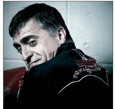
EL GRAN WYOMING