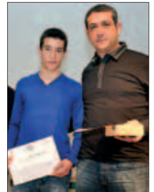
CADET A DEL CF MONTORNÈS