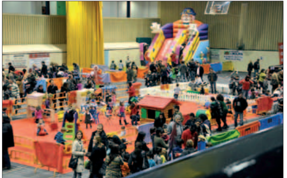
IMATGE DEL PARC DE NADAL INFANTIL DE L'ANY PASSAT

El preu d'accés serà de 2 euros i l'abonament per a tots els dies de 5 euros. Hi haurà servei de bar a càrrec dels mateixos alumnes.