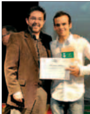
L'ATLETA ARTUR BOSSY