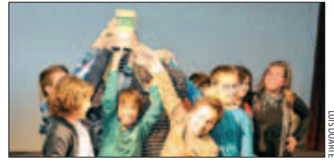
PRE MINI A MASCULÍ DEL CLUB BÀSQUET VILA DE MONTORNÈS

Durant la vetllada, també es van fer mencions honorífiques a persones i entitats per la seva dedicació a l'esport local durant la temporada 2011-2012. |