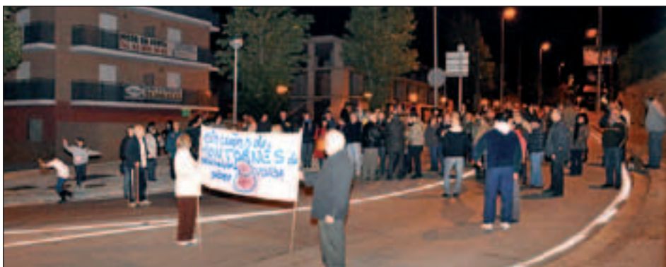
TALL DE TRÀNSIT A LA BV5001

(BV5001), a la rotonda de la cruïlla de les avingudes de Barcelona i d'Ernest Lluch i s'han fet marxes pels carrers del centre del municipi.