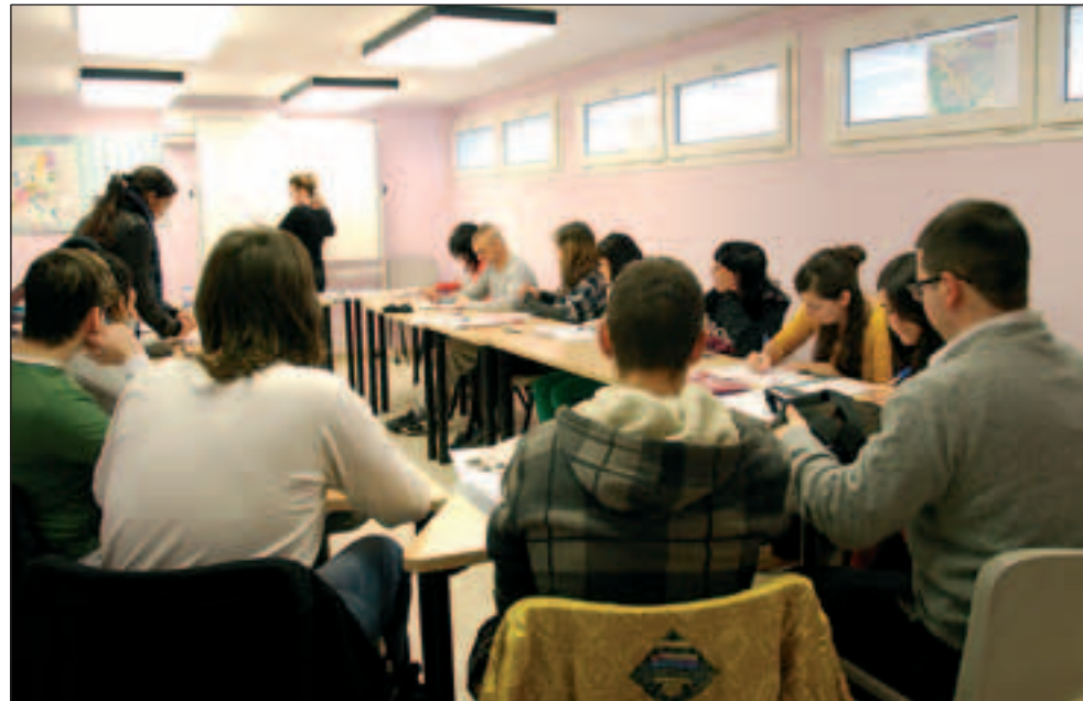
CLASSES DE FORMACIÓ PER ALS PARTICIPANTS EN EL DISPOSITIU D'INSERCIÓ PER A JOVES

dedicarà a formació. En cada convocatòria es definiran els perfils professionals de les persones que podran optar al pla. Aquest programa és l'alternativa local a la desaparició dels Plans d'Ocupació de la Generalitat.