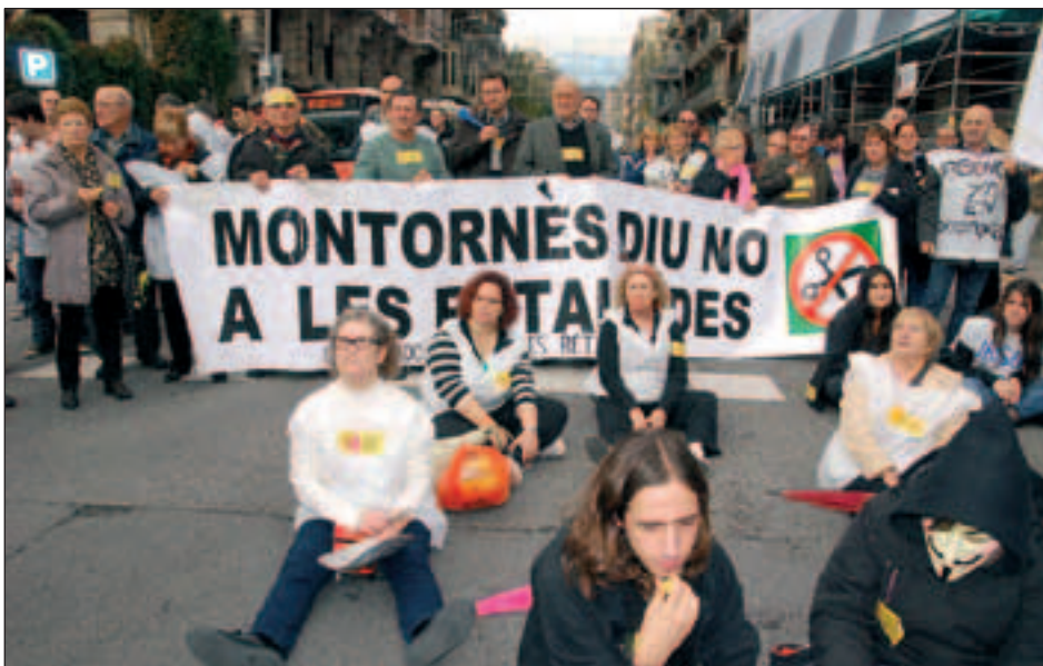
MANIFESTACIÓ A LA GRAN VIA DE LES CORTS CATALANES, A BARCELONA (10 DE NOVEMBRE DE 2012)

A més, els darrers divendres del mes de novembre s'ha tallat la carretera de la Roca