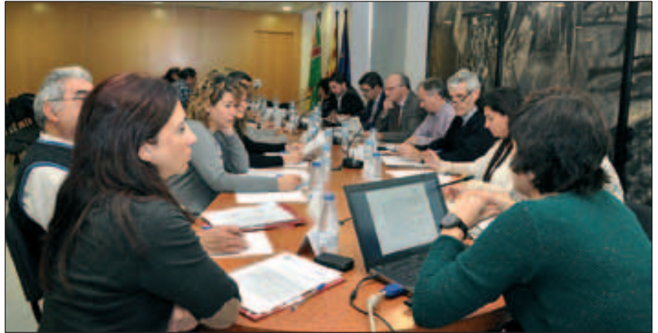
UN MOMENT DE LA REUNIÓ DEL COMITÈ D'AVALUACIÓ I SEGUIMENT DEL PII

Tenint en compte la situació de crisi econòmica i les limitacions pressupostàries, s'ha decidit que les actuacions de millora de l'espai públic s'executin amb un pressupost inferior al previst inicialment. Es faran intervencions puntuals als carrers de Federico Garcia Lorca i d'Antonio Machado i una de més integral al carrer de la Llibertat. Amb l'estalvi aconse-