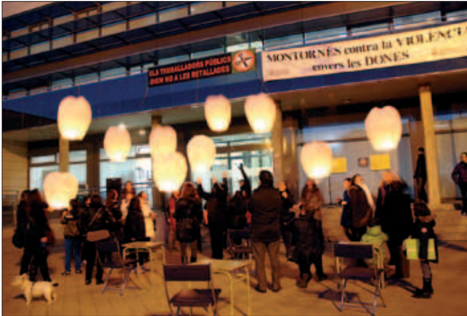
ENLAIRAMENT DE FANALS EN MEMÒRIA DE LES VÍCTIMES DE VIOLÈNCIA MASCLISTA

Els joves han tingut un pes específic en les activitats organitzades a l'entorn del Dia Internacional contra la violència masclista que es commemora el 25 de novembre.