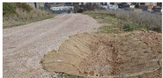
Bassa d'infiltració d'aigües pluvials