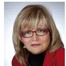
Cristina Tarrés Candidata a la Alcaldía

Por eso vuestro voto es decisivo para hacerlo popular el 22 de mayo. Si queréis seguir avanzando, si queréis erradicar políticas perniciosas, si queréis luchar contra el paro, si queréis salir de la crisis económica, si queréis soluciones a los problemas reales, confiad en el Partido Popular.