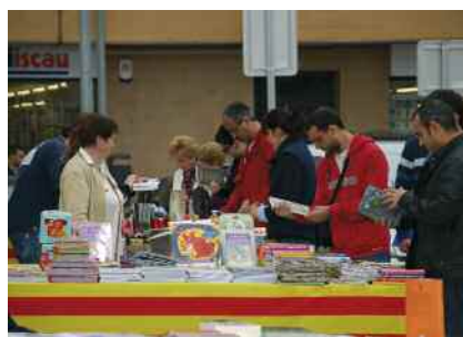
Sant Jordi 2011 Pàg. 13