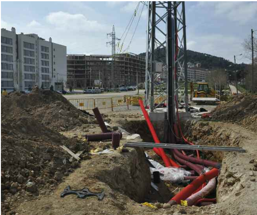
Treballs per a les noves connexions soterrades

Durant aquest mes de març s'enllestiran els treballs previs per al desmantellament de les cinc torres d'alta tensió que travessen el parc del torrent de Vinyes Velles. Abans, però, s'ha soterrat un quilòmetre de la línia de 110 quilowats en el tram comprès entre can Coll i l'avinguda del Riu Mogent.