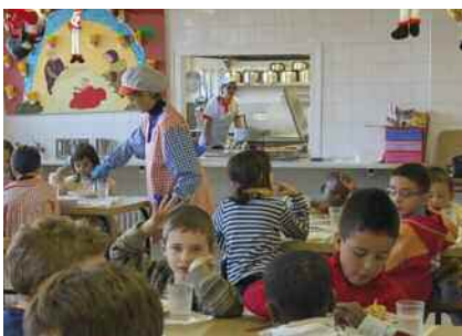
Ajuts per al menjador escolar Pàg. 12