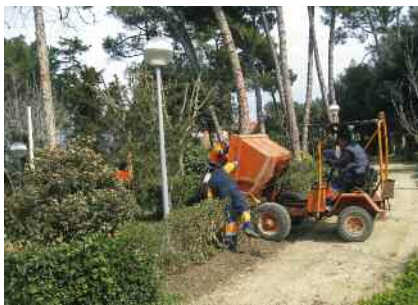
Arranjaments al parc dels Castanyers Pàg. 8