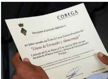
Col·laboració per a la formació i l'ocupació Pàg. 10