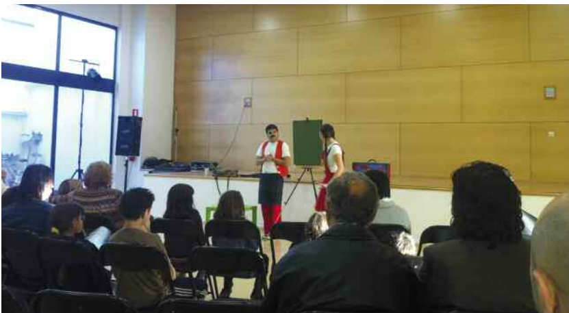
Representació de l'espectacle "Ningú més que l'altre" a l'auditori de la parròquia de Sant Sadurní