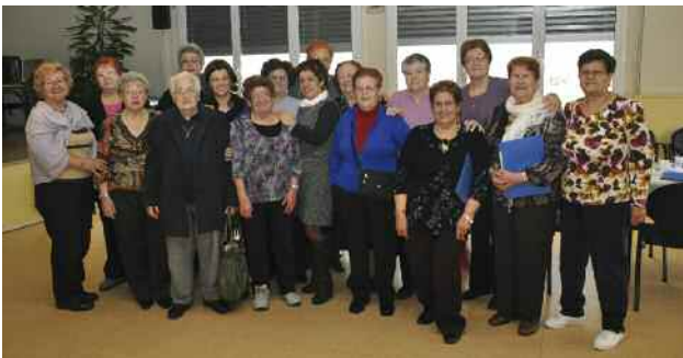
Participants al taller de memòria del Casal de la Gent Gran Nord

Aquest mes de març s'ha fet la cloenda dels tallers de memòria que s'han dut a terme en els darrers mesos als Casals de la Gent Gran de Montornès. En total hi han participat 43 persones, 26 a Montornès Centre i 17 a Montornès Nord.