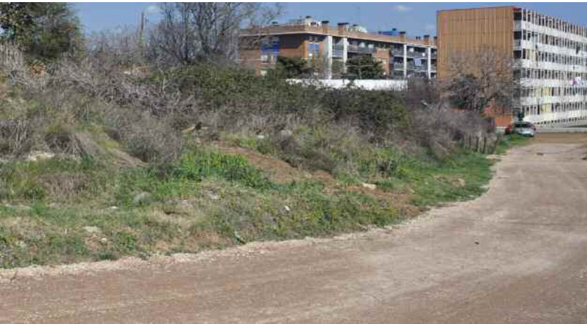
Pujada de les Tres Creus

La Junta de Govern Local ha aprovat aquest mes de març dos convenis amb l'Institut Català d'Arqueologia Clàssica relacionats amb el projecte de creació d'un centre observatori de la Via Augusta