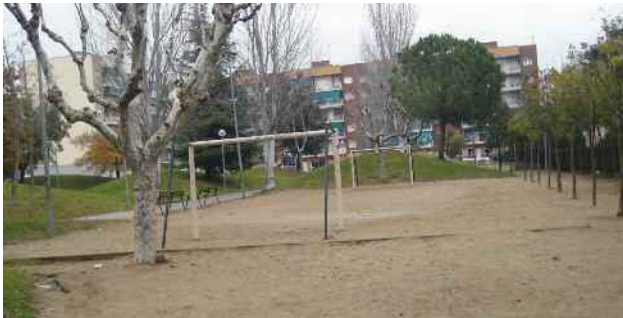
Plaça de Lluís Companys

El recompte definitiu ha confirmat la plaça de Lluís Companys com la que ha obtingut més vots seguida molt de prop per la plaça de Joan Miró