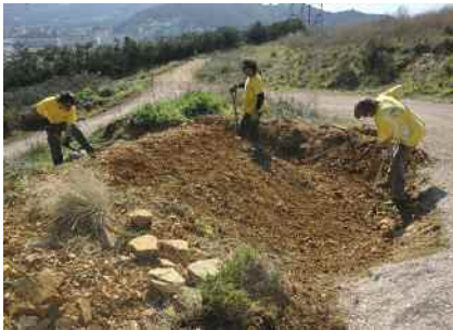
Actuacions als turons de les Tres Creus Pàg. 7