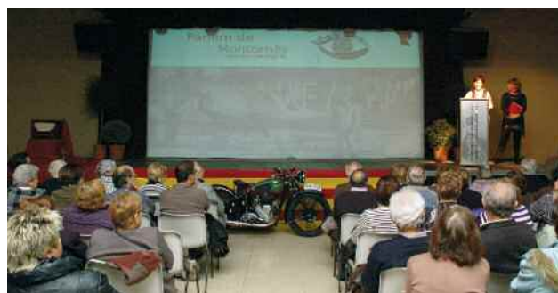
Presentació del documental "Parlem de Montornès. El traspals d'una guerra"

Durant l'acte, que va comptar amb l'assistència d'unes 120 persones, també es va fer la primera projecció pública del segon documental de la sèrie "Parlem de Montornès". El treball, editat en format DVD, es titula El traspals d'una guerra i està dedicat al període de la Guerra Civil.