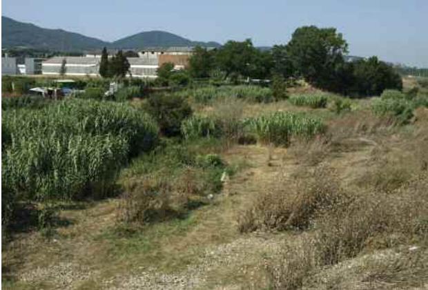
El riu Mogent aigües avall del pont de la ctra. de Granollers al Masnou

Fa uns dies, el Consorci per a la Defensa de la Conca del Besòs va iniciar els treballs de millora dels hàbitats fluvials i de recuperació dels canals secundaris del riu Mogent, al punt de desembocadura de la riera de Vallromanes situat entre els termes municipals de Montornès i de Vilanova del Vallès