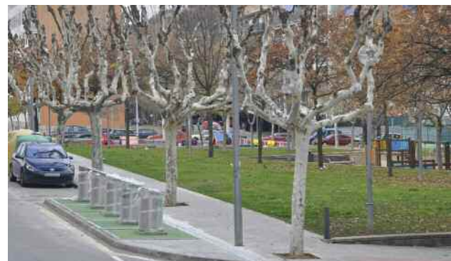
Plaça de l'Autonomia