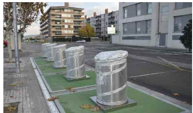
Avinguda d'Ernest Lluch

L'actuació s'emmarca en el projecte Espai Gràfit a Montornès (EGAM) inclòs al Pla Jove Local, que han treballat de forma transversal els departaments de Joventut, de Medi Ambient, de Seguretat Ciutadana, de Serveis Socials i de Cultura. L'objectiu és regular la pràctica del grafit al municipi.