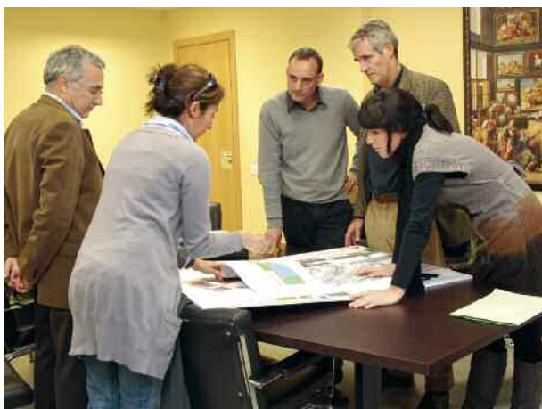
Moment de lliurament del projecte per part de la Diputació

Representants de l'Àrea d'Infraestructures, Urbanisme i Habitatge de la Diputació de Barcelona van lliurar a l'Ajuntament, a final del mes de novembre, el projecte d'obres de reforma de la plaça del Poble, una de les actuacions incloses al Pla d'Intervenció Integral de Montornès Nord.