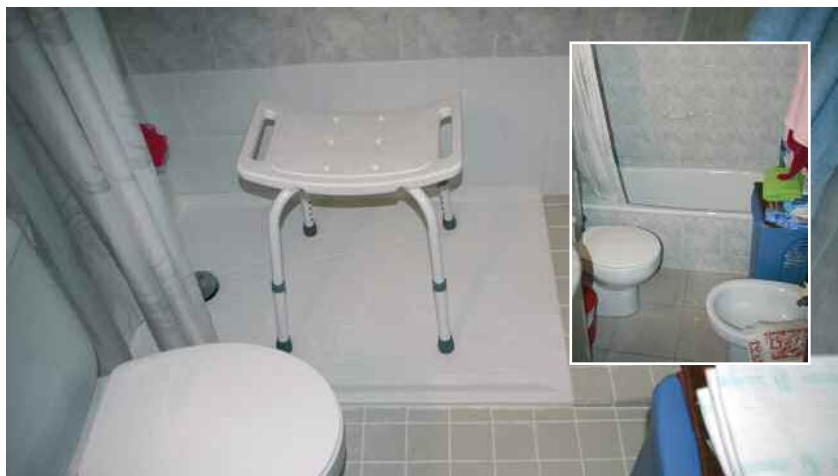
Reformes d'adaptació realitzades en un dels domicilis

Les reformes bàsiques (canviar una aixeta, col·locar un plat de dutxa, revisar la instal·lació elèctrica, situar ele-