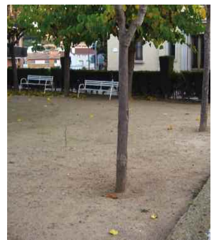
Plaça de Joaquim Mir