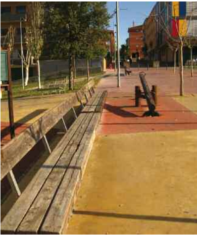
Plaça de Pau Picasso

Del 14 de desembre i el 16 de gener els veïns podran escollir quina obra de manteniment i millora de l'espai públic es durà a terme l'any vinent amb els 80.000 euros reservats per aquest procés. Els espais proposats són les places de Pau Picasso, de Joaquim Mir, de Joan Miró i de Lluís Companys.