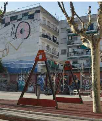
Plaça de Joan Miró