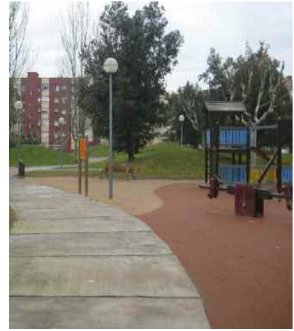
Plaça de Lluís Companys

Durant el període de votació, la Biblioteca acollirà una exposició sobre l'evolució i els fruits del procés durant els darrers dos anys.