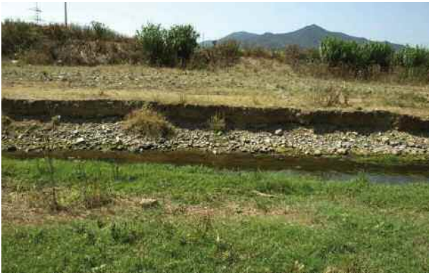
Incisió del riu a la llera.