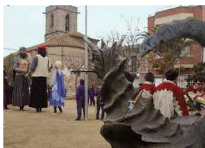
Festes de tardor 2010 Pàg. 10