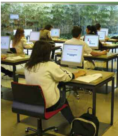
Alumnes de Montornès a les instal·lacions de Barcelona Activa

La proposta preveu que la matèria s'imparteixi a l'edifici nou de l'Institut Marta Mata, al camí de la Justada