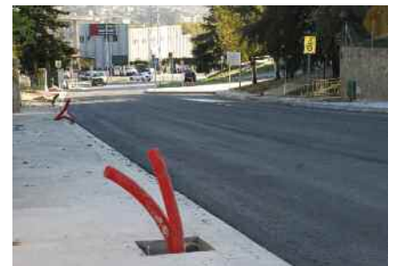
Millores urbanístiques al carrer de Carles Riba Pàg. 6