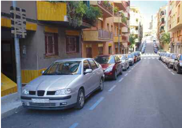
Carrer de Joan XXIII

L'Ajuntament ha introduït un canvi en l'ordenança municipal reguladora de l'estacionament limitat, perquè la zona blava dels carrers de Joan XXIII i d'Euskadi funcioni els divendres o dies de mercat setmanal, de 8 a 14 h. Dins d'aquest termini de temps, es permetrà l'aparcament durant 1 h i 30 min, tal com estableix la normativa.