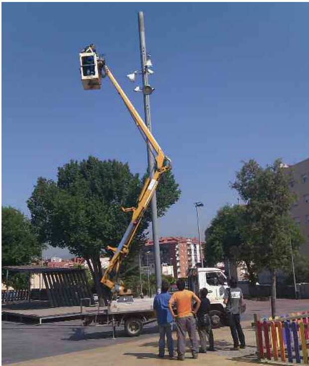
Habilitació d'un dels punts de connexió a la plaça de Pau Picasso

El projecte s'ha finançat amb les aportacions del Fons Estatal per a l'Ocupació i la Sostenibilitat. Els treballs han anat càrrec de l'empresa Retevisión per un import de 84.775,58 euros.