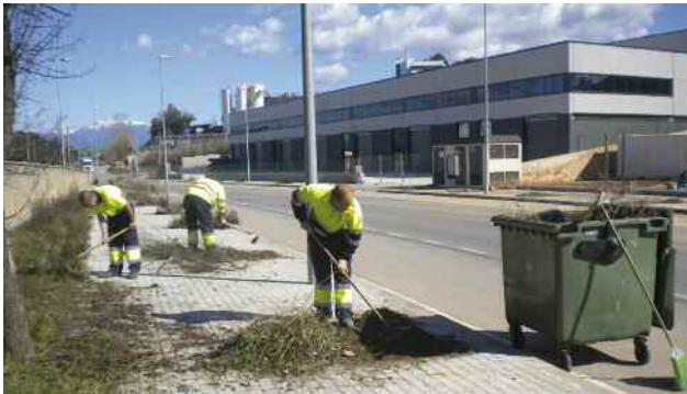
Pla d'ocupació desenvolupat entre gener i juny de 2010

treballadors es contractaran a temps parcial, un 70% de la jornada laboral, i durant un període de 6 mesos. La contractació s'iniciarà abans del dia 15 de novembre i finalitzarà l'11 de maig del 2011