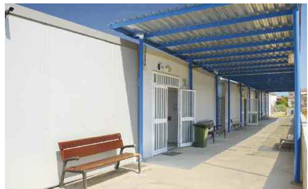
Instal·lacions actuals de l'Institut Marta Mata

El Departament d'Educació, per la seva banda, tornarà en terminis la inversió prevista que és de 6.210.233,20 euros i