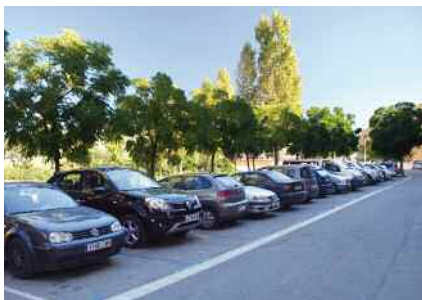
Canvi en les zones blaves a Joan XXIII i Euskadi Pàg. 3