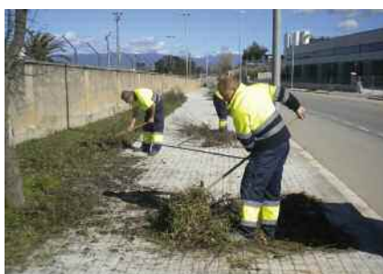
Posada en marxa de nous Plans d'Ocupació Pàg. 8