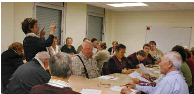
Sessió del taller de memòria al Casal de la Gent Gran Centre

A final d'octubre es va posar en marxa als Casals de la Gent Gran una nova edició dels tallers de memòria que organitza el Departament de Serveis Socials de l'Ajuntament.