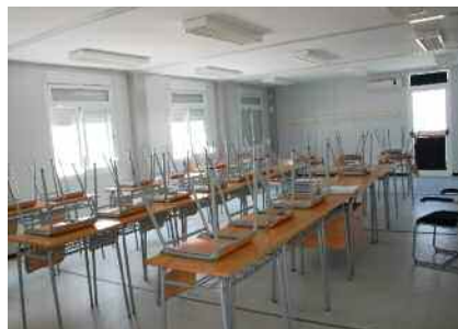
Redacció del projecte tècnic de l'Institut Marta Mata Pàg. 5