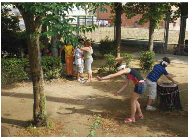
Activitats del Casal d'estiu de l'any passat

Un total de 208 infants participen a les activitats del Casal d'Estiu