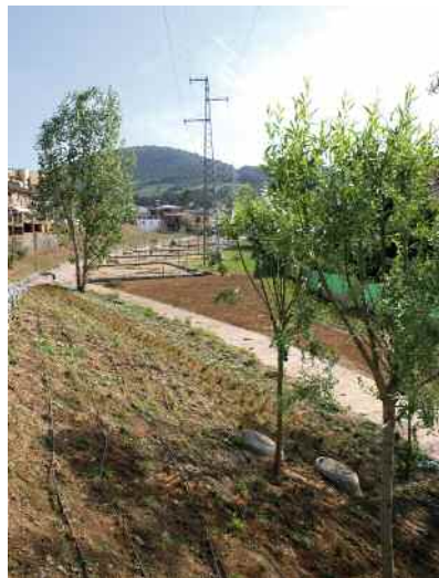
Sistema de rec al torrent de Vinyes Velles