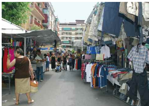
Mercat setmanal dels divendres

Aquests canvis actualitzen la darrera modificació que es va dur a terme l'any 2008 i responen a les demandes dels mateixos paradistes.