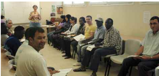
Cursos de català per a persones nouvingudes

Els alumnes que hagin assolit un nivell prou adequat es podran inscriure als cursos bàsics generals que el Consorci ofereix anualment.