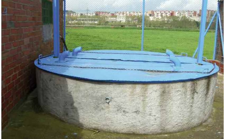
Un dels pous de la plana de can Vilaró

D'altra banda, Montornès també va posar en marxa durant 2009 un conjunt d'actuacions per a la promoció de l'eficiència energètica en diversos equipaments municipals.