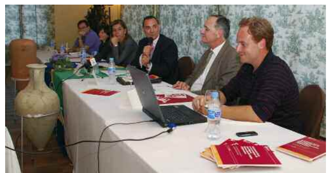
Un moment de la presentació

Acompanyant l'acte, celebrat a la torre Tavernera de Vallromanes, es van mostrar públicament dues àmfores restaurades a partir de fragments trobats al jaciment.