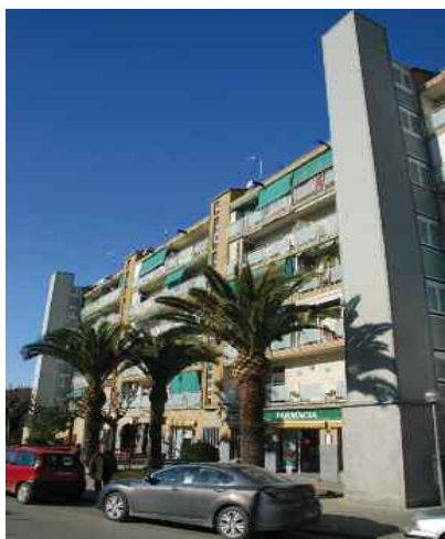
En els darrers anys s'han instal·lat ascensors a diversos edificis del carrer de Fco. G. Lorca

La propera sessió de treball serà el 13 de setembre, a les 20.30 h, al Centre Infantil la Peixera.