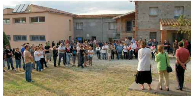
Un centenar de persones van assistir a l'acte de cloenda del curs 2009 - 2010 del PTT

Per al proper curs, la branca de mecànica d'ajust i soldadura incorporarà com a novetat formació específica de reparació de maquinària industrial, resultat d'un acord amb Henkel Ibérica.