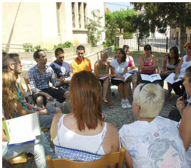
Sessió de treball d'un dels cursos a Pintor Mir

Un cop superada la formació, els participants obtindran un títol acreditatiu per treballar com a monitor de temps de lleure. El darrer curs d'aquestes característiques es va fer a l'octubre de 2009.