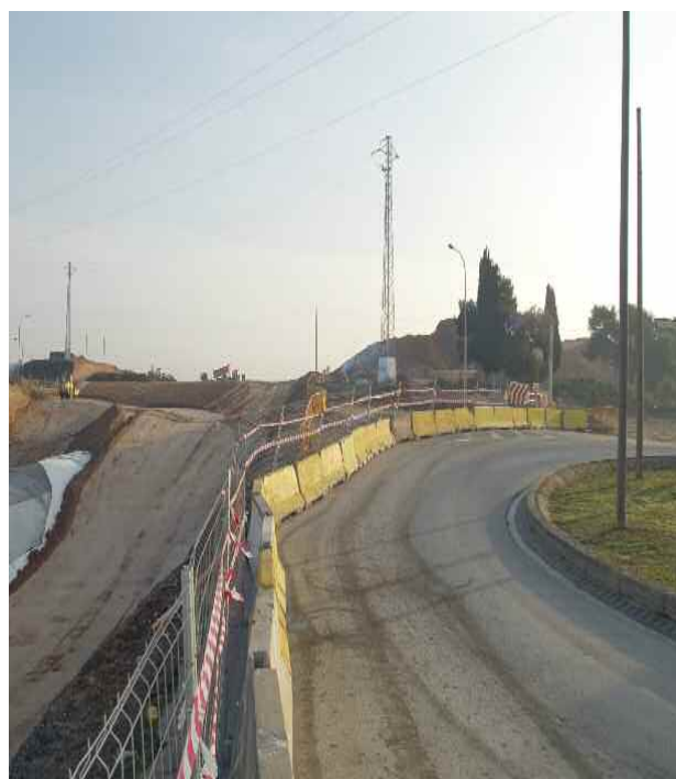
Intersecció entre els carrers de Can Parellada, Carles Riba i Fco. G. Lorca

Des de l'estiu de 2008, l'empresa ALDESA PEI ha dut a terme, entre d'altres treballs, la construcció del fals túnel de 182 metres que es va projectar entre els carrers d'Antonio Machado i de Carles Riba.