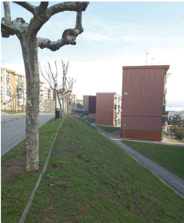
Desnivell entre la plaça del Primer de Maig i el carrer del 9 d'abril

El condicionament de l'immoble situat a la planta semisoterrani de l'església Nostra Senyora del Carme és un dels projectes que es desenvoluparan aquest any 2010