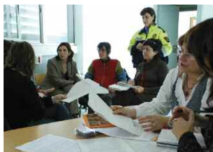
Programa de mobilitat segura