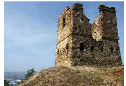
Rehabilitació de la torre del Telègraf