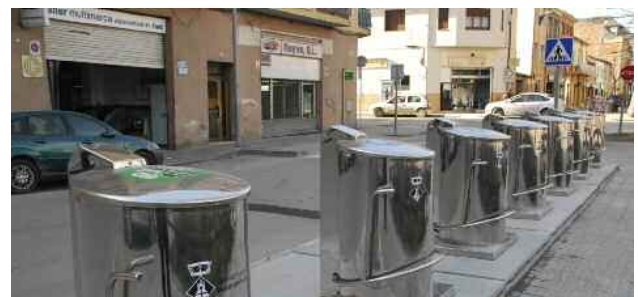
Contenidors al carrer Major

En aquests contenidors es poden dipositar fraccions de paper i cartró, vidre, envasos, matèria orgànica i rebuig.