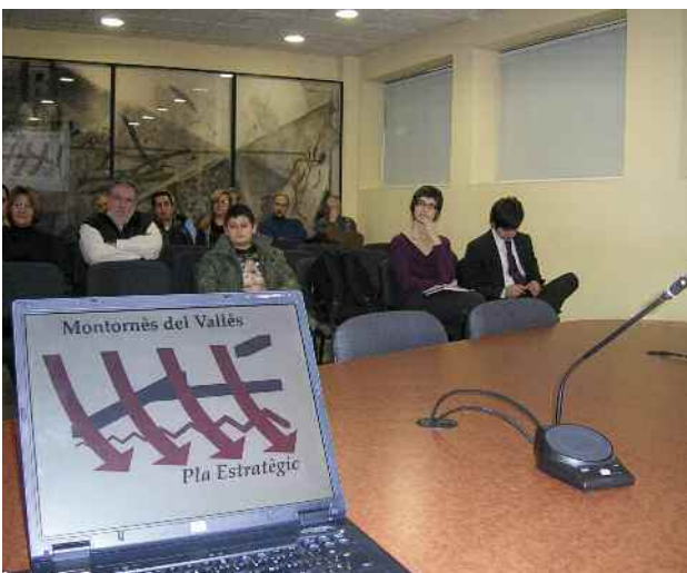
Presentació del procés a la Sala d'Actes de l'Ajuntament

Properament es crearan els grups de treball que desenvoluparan les tres línies bàsiques del Pla: el servei a les persones, l'activitat econòmica i el territori