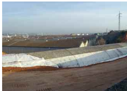
Obertura del carrer de can Parellada