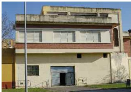
Actuacions de la Llei de barris