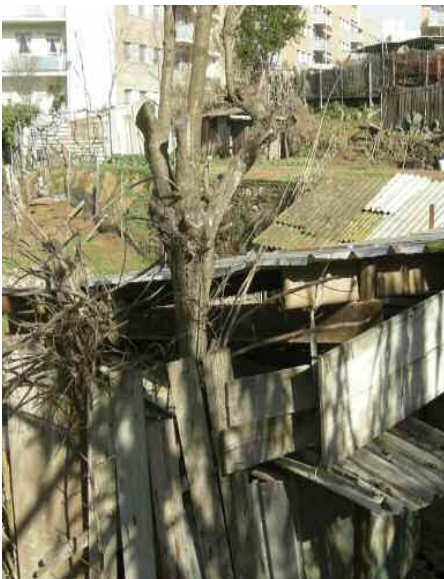
Estat del torrent a la zona del carrer Montseny

Es rehabilitarà el vial de vianants que segueix la línia de l'antic cabal del torrent, es crearà un carril per a bicicletes i espais