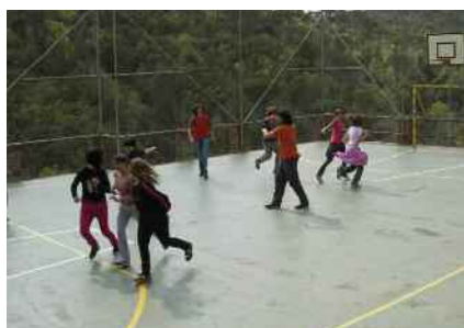
DIEP: Dinamització de l'Espai Públic