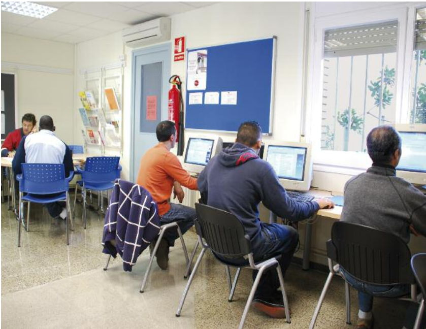
A dalt, espai destinat als usuaris del Club de feina, i a sota altres dependències reformades del departament