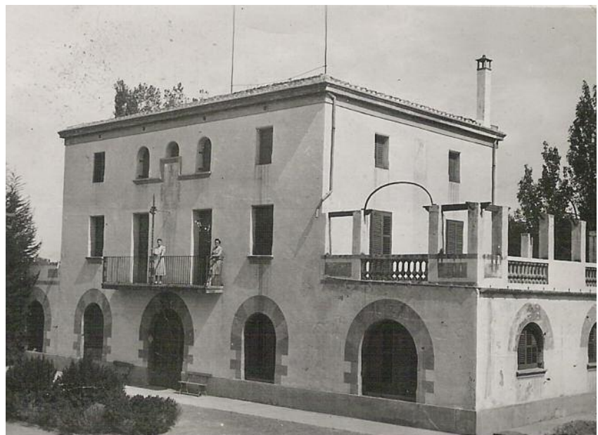
La casa de can Parera cap als anys 40-50 del s.XX. L'aula escolar ocupava la sala de la dreta de la planta baixa, just sota la gran terrassa.

Acabat el conflicte bèl·lic, la colla dels petits va tornar a les escoles de la plaça: els nois i les noies, per separat; la llengua, el castellà.