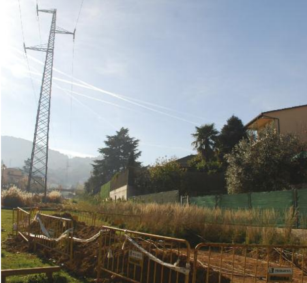
Treballs d'inspecció de les canalitzacions per les quals passarà el cable d'alta tensió