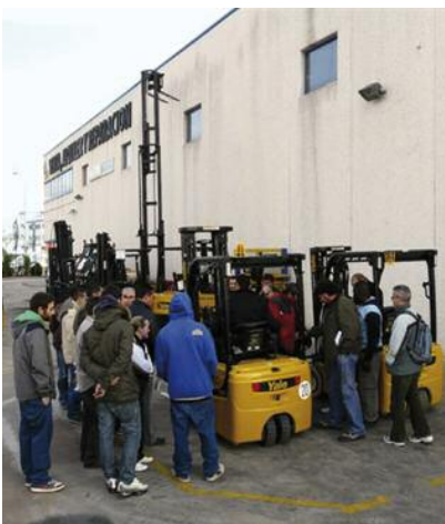
Curs de conductors de carretons elevadors

La acció, finançada amb una subvenció de 122.945,85 euros atorgada pel Servei d'Ocupació de Catalunya del Departament de Treball, ha servit per contractar, durant un termini de sis mesos, onze persones desocupades amb situacions d'extrema precarietat.