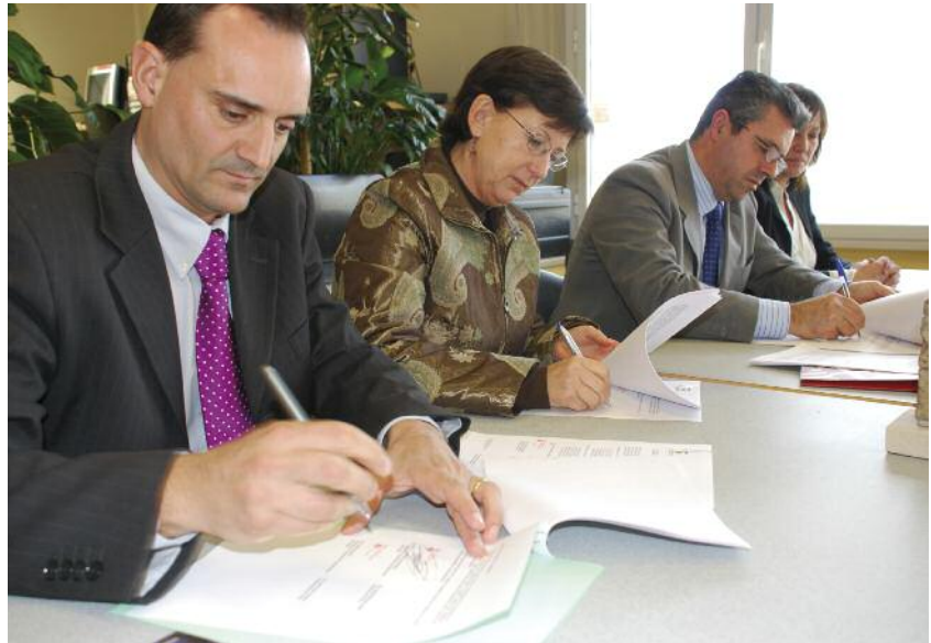
Signatura del conveni per part dels alcaldes de Montornès i de Montmeló, i de la directora de l'ICAC

L'actuació, que pretén que la zona esdevingui un important focus d'interès lúdic i cultural, preveu la restauració paisatgística de la muntanya de les Tres Creus, l'arranjament de les principals vies d'accés al jaciment i al futur parc, i la construcció d'un punt d'informació per als visitants. El cost de la proposta és d'1 milió d'euros, dels quals a l'entorn de 500.000 són finançats pel Fons Europeus de