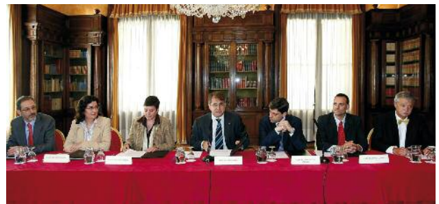
Acte de signatura del conveni al Palau de Pedralbes (Maig de 2006)

Pel que fa a l'obra civil, aquella que té a veure amb la construcció de rases i canalitzacions per les quals s'ha de soterrar el cable d'alta tensió, una part es va integrar en el projecte d'urbanització del torrent de Vinyes Velles i l'altra, la feta al tram comprès entre l'avinguda de Barcelona i l'avinguda Mogent, es va executar amb els recursos aportats pels promotors d'habitatges del sector de Manso Calders i de la Unitat d'Actuació situada a l'avinguda de la Llibertat.