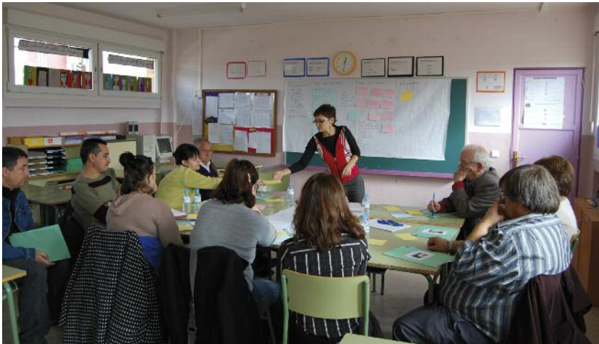
Taller de participació ciutadana a les aules del CEIP Marinada

Les conclusions del taller serviran de base per a la redacció del projecte tècnic de reforma de l'espai