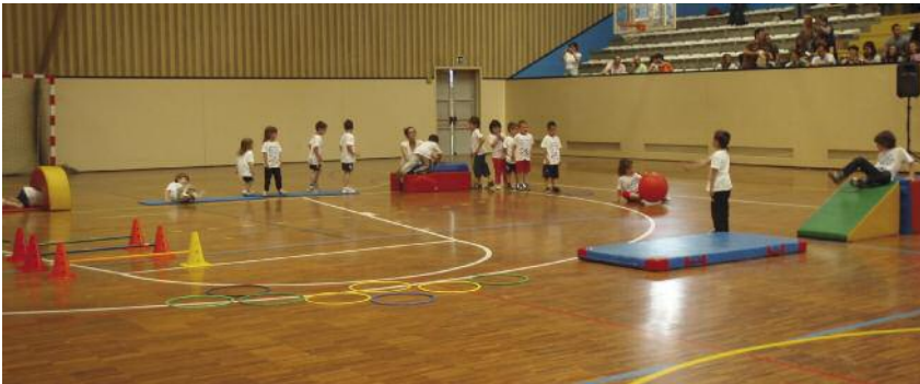
Alumnes de psicomotricitat de les EEM del curs 2008-2009

Un total de 172 infants participen aquest curs 2009 – 2010 a les activitats esportives extraescolars dels centres d'ensenyament de Montornès, organitzades pel Departament d'Esports i les Associacions de Mares i Pares d'Alumnes