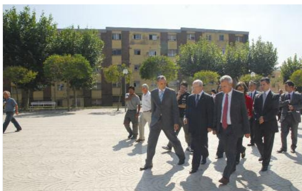
Recorregut per la plaça del Poble

El projecte de Montornès per a la recuperació dels turons de les Tres Creus rebrà ajuts del programa de Fons Europeus de Desenvolupament Regional, FEDER, per al període 2007 – 2013