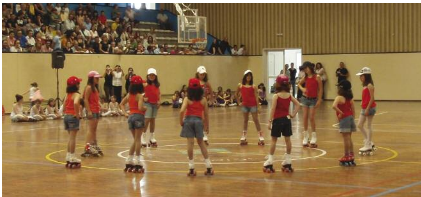
Exhibició de patinatge a la cloenda de les activitats esportives extraescolars del curs 2008-2009

Les EEM estan obertes a tots els esports sempre que les possibilitats del centre, pel que fa a la demanda dels seus alumnes, els horaris i les instal·lacions ho permetin.