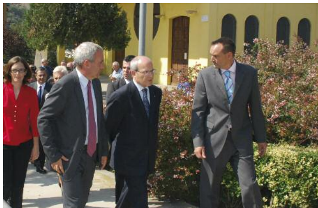
La comitiva a la plaça de l'Església

El projecte d'intervenció integral a Montornès Nord preveu 38 actuacions i té un pressupost de 9,99 milions d'euros. Les actuacions, que es desenvoluparan durant els propers 4 anys, han obtingut una subvenció de 4,99 milions d'euros de la Generalitat a la sisena convocatòria dels ajuts de la Llei de millora de barris, àrees urbanes i viles que requereixen una atenció especial.