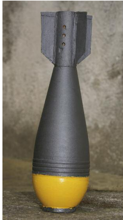
Bomba de 80 mm fabricada a la Samesfort de Montornès.