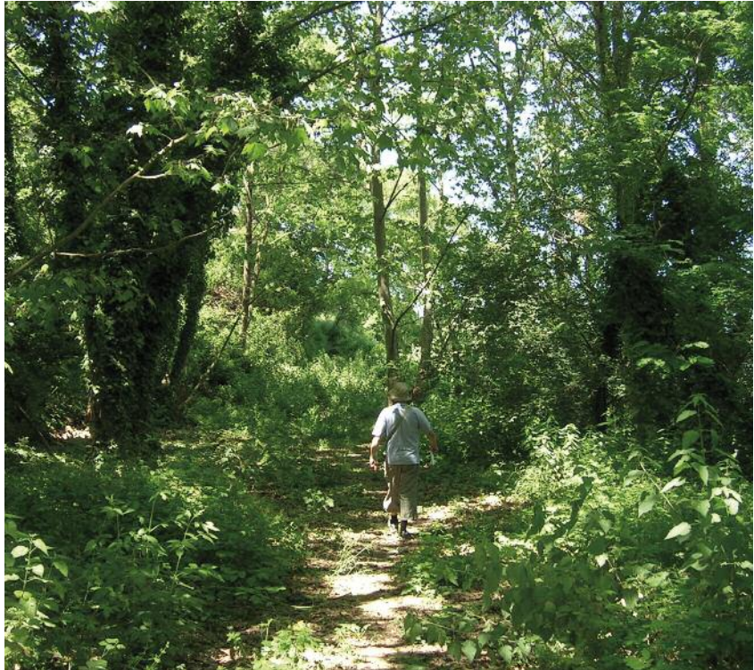
El camí de la font de Santa Caterina és un dels accessos que s'arranjaran i se senyalitzaran

En general, els Plans d'Ocupació serveixen per facilitar la inserció laboral de persones desocupades amb situacions d'extrema precarietat.