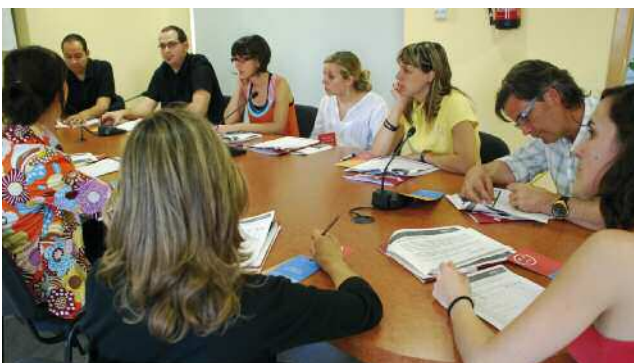
Primera sessió de treball prèvia a l'elaboració del Pla Educatiu de Ciutat

L'Ajuntament de Montornès, amb el suport de la Diputació de Barcelona, ha iniciat el procés d'elaboració del Pla Educatiu de Ciutat