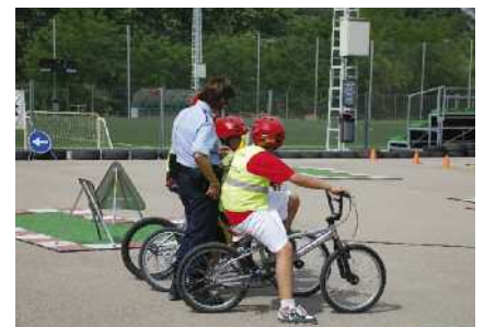
Recta final del programa d'educació viària Pàg. 6