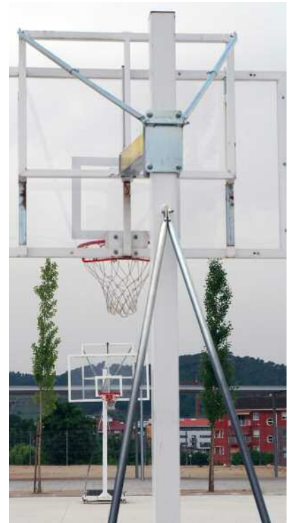
Cistelles noves del CEIP Mogent

En total l'Ajuntament ha invertit prop de 103.000 euros.