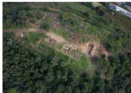
VII Intervenció a can Tacó - turó d'en Roina Pàg. 5