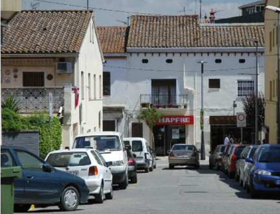
Carrer de Jacint Verdagner

La Junta de Govern Local, reunida en sessió ordinària el 21 de maig, va aprovar l'adjudicació provisional del projecte de renovació del paviment i de les xarxes de serveis dels carrers de Jacint Verdagner, del Riu Mogent i del Bruc a l'empresa Grup Mas Constructores, SLU per un import de 425.091,01 euros.