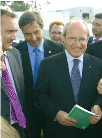
L'alcalde va lliurar el llibre L'aeròdrom 329, relacionat amb el refugi de ca l'Arnau, al President de la Generalitat durant una visita realitzada el 28 de maig al Centre Comarcal de Tractament de Residus

l'assessorament tècnic dels especialistes i dels professionals del sector per desenvolupar actuacions de divulgació i difusió exterior del valor del patrimoni històric, cultural i natural de Montornès. És el cas del jaciment romà de can Tacó – turó d'en Roina i el refugi antiaeri de ca l'Arnau que, amb més de 100 metres de galeria, és un dels més llargs que s'han posat al descobert de l'època de la Guerra Civil.