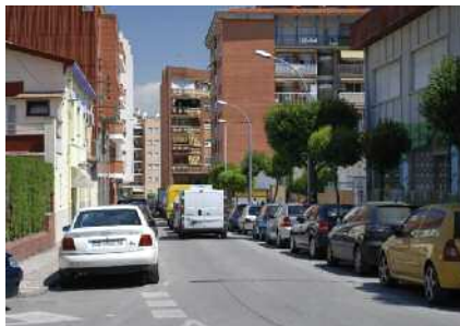
Obres subvencionades pel PUOSC Pàg. 3