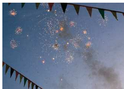
Sant Joan 2009 Pàg. 10