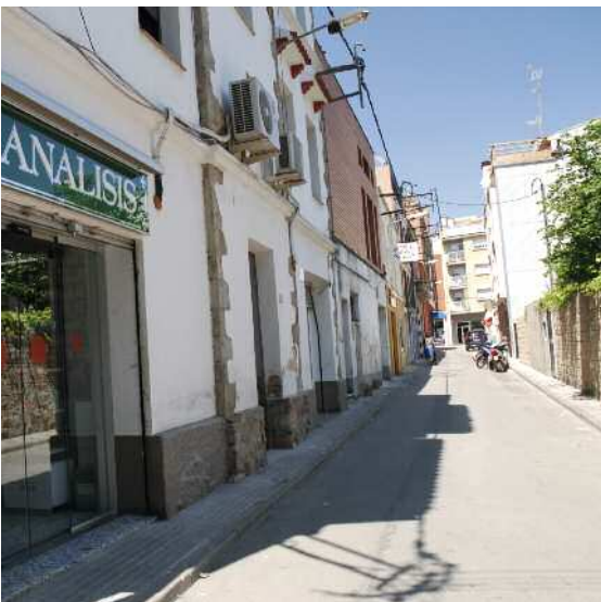
Carrer del Bruc

El 29 de maig acabava el termini de presentació de les ofertes dels equips redactors interessats.