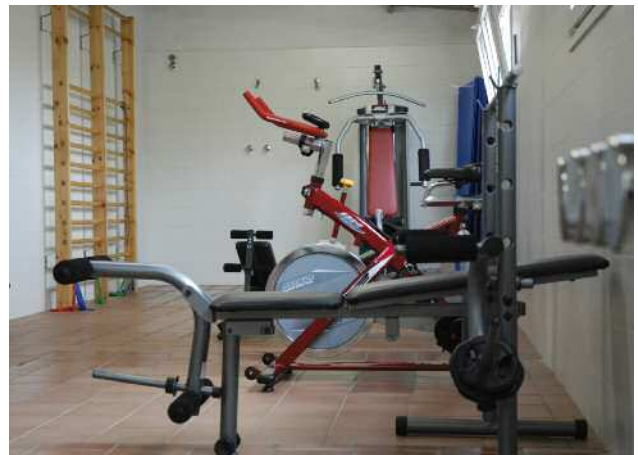
Gimnàs de la Zona Esportiva Municipal destinat a les entitats esportives