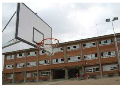
Nou material esportiu per als equipaments Pàg. 7