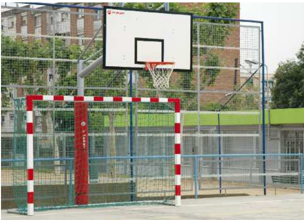
Instal·lacions esportives del CEIP Marinada