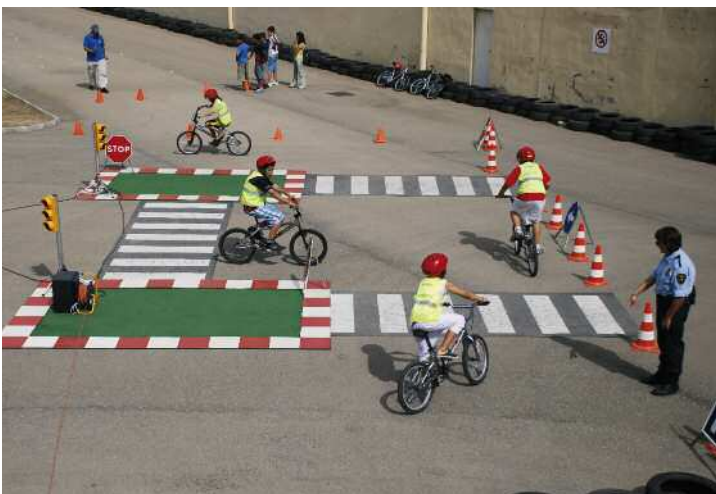
Circuit d'educació viària a la Zona Esportiva Municipal