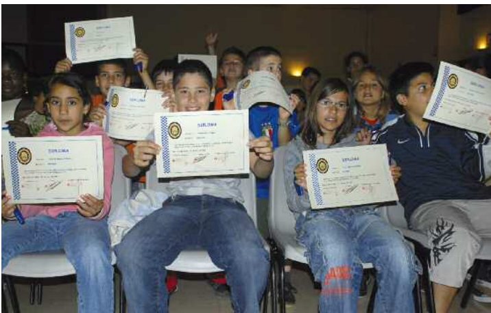
Infants participants a l'edició de l'any passat, amb els diplomes

Les darreres sessions sobre mobilitat segura es dediquen als escolars de la llar d'infants pública El Lledoner i als alumnes de 1r a 4rt de primària i inclouen la maleta viatgera, gimcanes, tallers i un espectacle teatral específic sobre la matèria. Els dies 11 i 12 de juny el Teatre Municipal acollirà l'acte de cloenda i el lliurament de diplomes als participants.