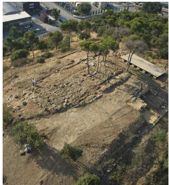
Vista aèria del jaciment

Per dur a terme la campanya, els Ajuntaments de Montornès i de Montmeló i l'Institut Català d'Arqueologia Clàssica (ICAC) han signat un acord complementari al conveni marc de col·laboració de l'any 2004. Aquest document regula la gestió i execució del projecte arqueològic del jaciment. Les tres institucions destinaran 45.000 euros als treballs nous de recerca.