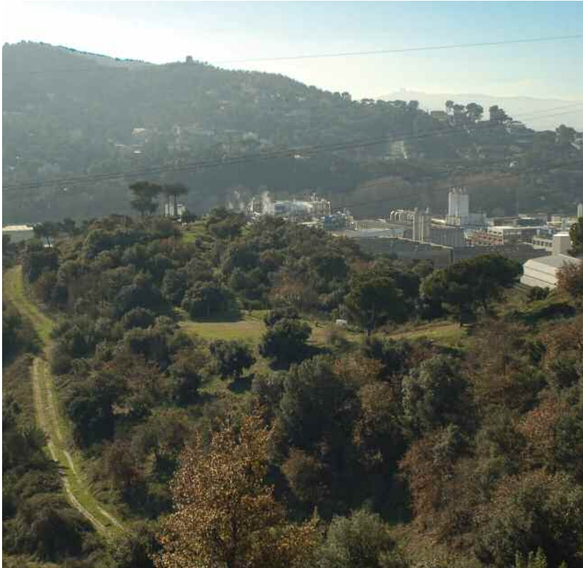
Vista del turó d'en Roina des del turó del dipòsit d'aigua

Les dues actuacions per a la recuperació dels turons de les Tres Creus pretenen que la zona esdevingui un important focus d'interès lúdic i cultural