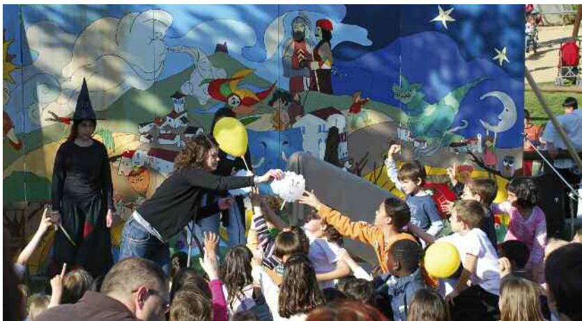
Marató de contes de l'any 2008

Les activitats de Sant Jordi programades per l'Ajuntament, juntament amb les entitats, començarà el proper 16 d'abril.