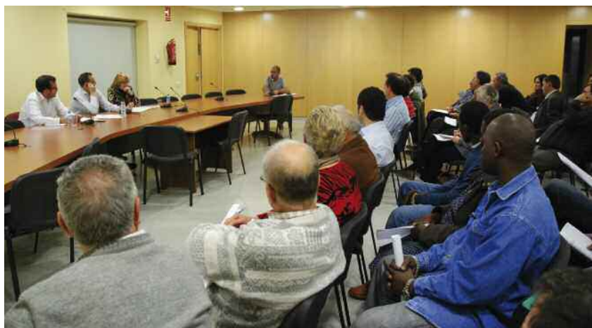
Sessió de presentació del procés, celebrada el 26 de març a la Sala d'Actes de l'Ajuntament

jançant butlletes que es podran dipositar en diverses urnes situades a equipaments municipals. Les actuacions que es proposaran dur a terme se seleccionaran en un taller.