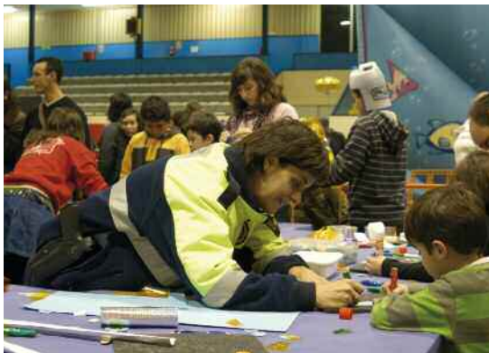
Tallers per la mobilitat segura al Parc de Nadal

Ja formant part de les activitats previstes per al curs 2008 - 2009, la Policia va dur a terme diverses accions formatives adreçades als alumnes de l'IES Vinyes Velles, jornades dirigides als joves del Pla de Transició al Treball (PTT), tallers al Parc de Nadal, així com també col·laboracions a l'Institut del municipi de veí de Vilanova.