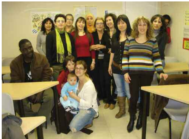
Alguns dels participants en aquesta 7a edició

Amb la intenció de donar a conèixer més àmpliament aquest programa i amb el desig d'aplegar en un acte totes aquelles persones que estan fent esforços per conèixer la llengua catalana, el proper 21 d'abril, a les 18 h, a la sala d'actes de la Biblioteca de Montornès, alguns dels participants en el Voluntariat i alumnes de català dels cursos del Consorci per a la Normalització Lingüística i de l'aula de català dels dos casals dels avis de Montornès del Vallès, ens llegiran poemes d'amor en un acte que s'emmarca dintre de les activitats de la diada de Sant Jordi, dia de llibres, roses i amor.