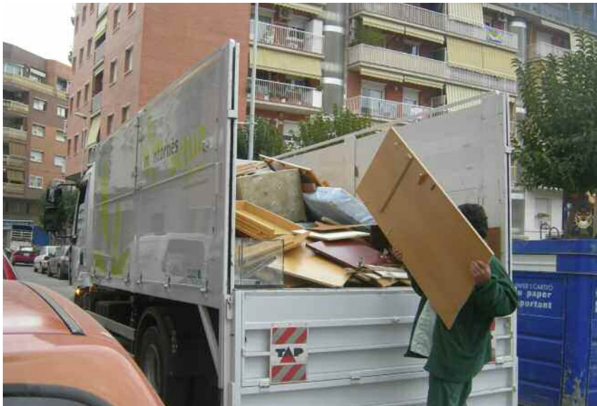
Servei municipal de recollida de voluminosos

De la memòria sobre la gestió de residus municipals de 2008, destaca l'increment del reciclatge de la fracció orgànica en un 17% respecte 2007. De 732,14 tones de l'any 2007, s'ha passat a recollir 856,24 tones de matèria orgànica. La freqüència del servei de recollida és diària.