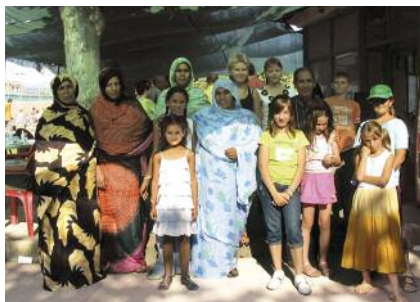
Acollida d'infants sahrauís Pàg. 9