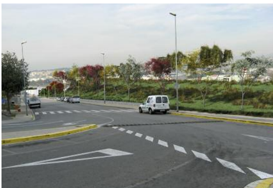
Projecció virtual del carrer Vallès després de les obres

Les molèsties que ocasionaran els treballs, que tenen una durada prevista de dos anys, així com també les incidències sobre la mobilitat, van ser altres aspectes tractats en aquesta trobada.