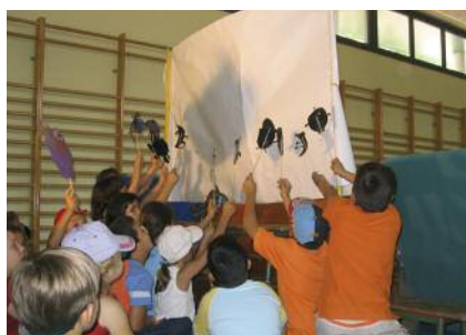
Activitats d'estiu 2008 Pàg. 10