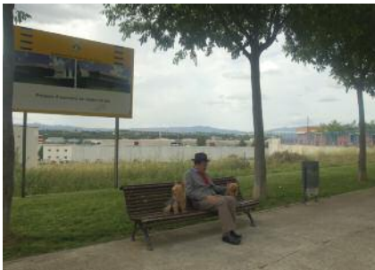
Demanda de més ajut per al Centre de dia Pàg. 8