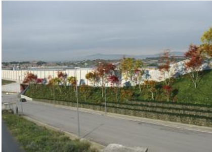
Punt d'informació sobre les obres del TAV Pàg. 3