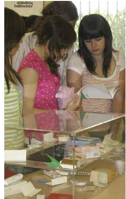
Activitats organitzades l'any 2007

Les activitats aniran a càrrec de l'Associació per a la Prevenció i Promoció de la Salut; de Joves per a la Igualtat i la Solidaritat; i del Centre Jove d'Anticoncepció i Sexualitat.