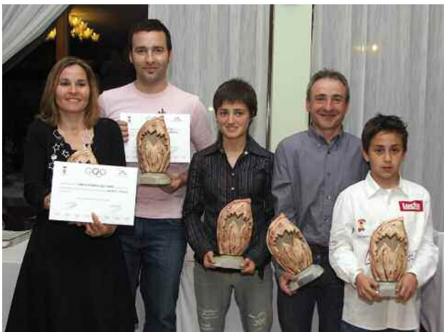
Quadre de guanyadors de la VIII Festa de l'Esport

Un any més, l'esport local s'ha reunit per premiar els millors esportistes, clubs i empreses patrocinadores. Enguany els premis han incorporat dos guardons nous per als millors equips infantils i sèniors de les entitats i clubs de Montornès.