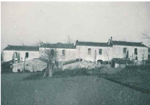
Veïnat de can Parellada. Anys 40 del segle XX.

Les famílies que vivien al veïnat de can Parellada van veure com els seus camps de patates eren requisats i transformats en una pista sorrenca per als avions de combat.