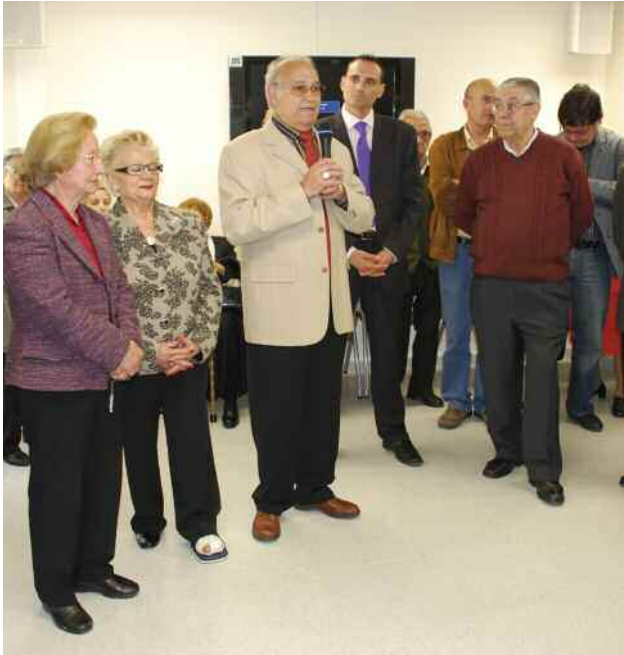
Acte institucional en el decurs de la jornada de portes obertes del 13 d'abril