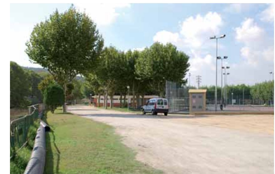
Zona afectada per les obres de remodelació

El passat mes de maig, la Junta de Govern Local va adjudicar les obres d'urbanització de l'aparcament de la zona esportiva municipal i dels accessos a la piscina coberta i el camp de futbol. L'import de la licitació va ser 289.977,71 euros.