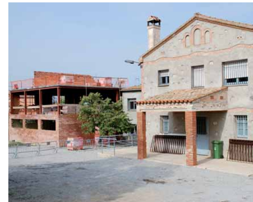
Masia del Molí

La Brigada Municipal d'Obres treballa en l'ampliació de les dependències de la masia del Molí que acullen la formació del Pla de Transició al Treball (PTT)