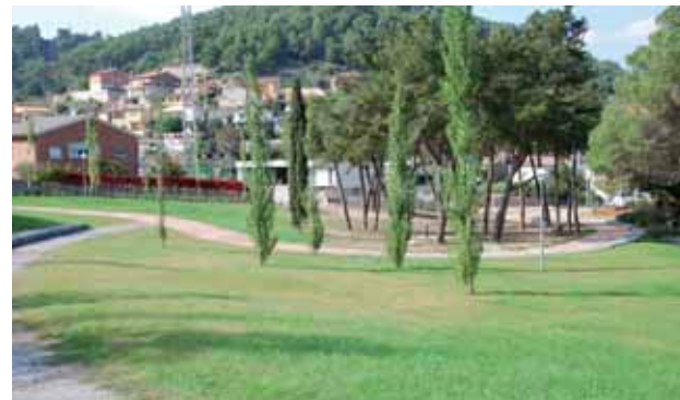
Parc de Vinyes Velles

La Diputació, a través del programa Xarxa Barcelona Municipis de Qualitat, ha concedit una subvenció de 11.040 euros.