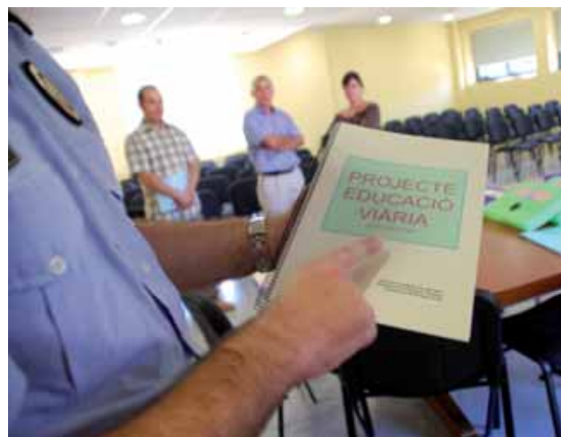
Projecte d'educació viària 2007 - 2008

El mes d'octubre es va presentar el programa d'educació viària 2007-2008, adreçat a tots els centres d'ensenyament del municipi.