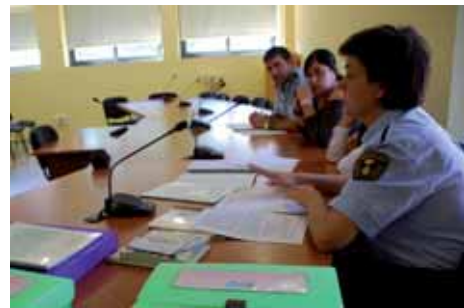
Programa d'educació viària 2007 - 2008 Pàg. 12