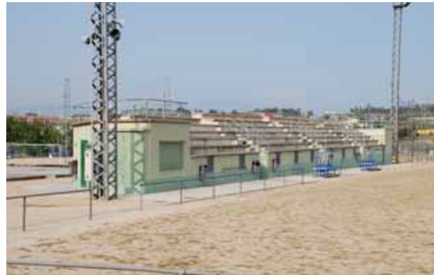
Grades del camp de futbol de Montornès Nord

A la sessió extraordinària, celebrada el 18 d'octubre, el Ple Municipal va aprovar una modificació pressupostària per fer front a la despesa del projecte de cobriment de les grades del camp de futbol de Montornès Nord.