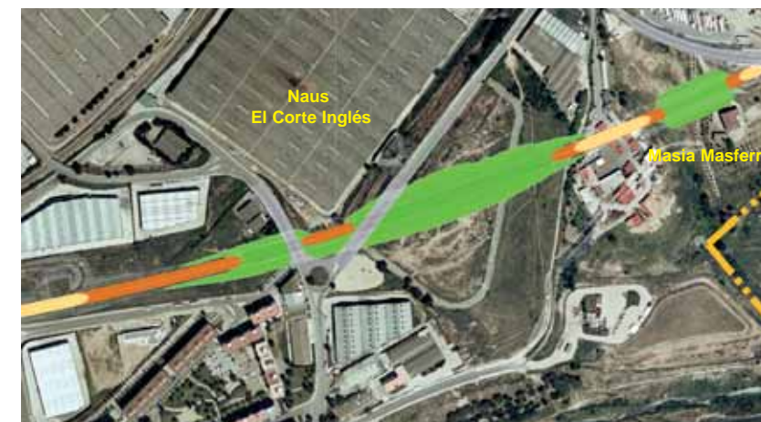
Detall del traçat

El traçat del TGV al tram Mollet - Montornès - La Roca, amb una longitud que no arriba als 14 quilòmetres, s'ha dividit en dos sectors. El primer preveu la construcció de la línia ferroviària entre Mollet i Montornès (3,34 quilòmetres); i el segon sector, les obres entre Montornès, Vilanova del Vallès i la Roca del Vallès (10,2 quilòmetres).