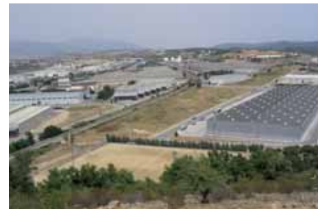
Proper inici de les obres del TGV a Montornès Pàg. 13