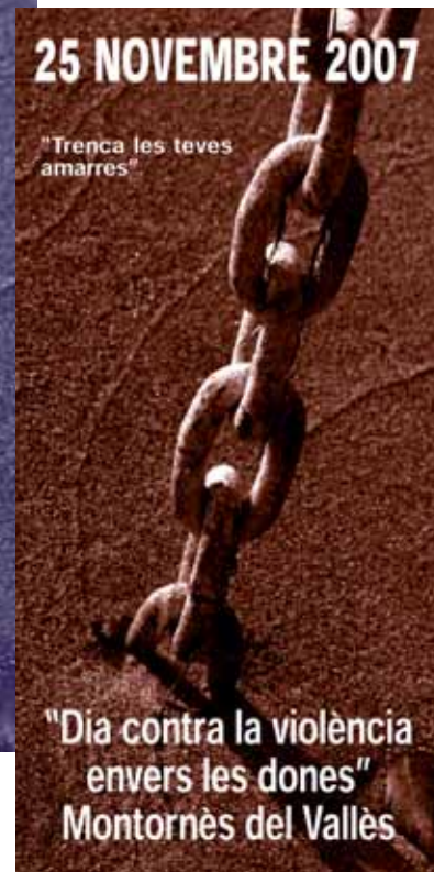
"Dia contra la violència envers les dones" Montornès del Vallès