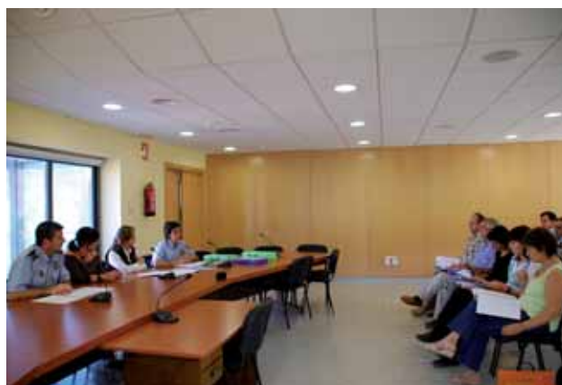
Presentació del projecte, a la Sala d'Actes de l'Ajuntament

La programació d'educació viària per als centres d'ensenyament de Montornès començarà el mes de febrer de 2008.