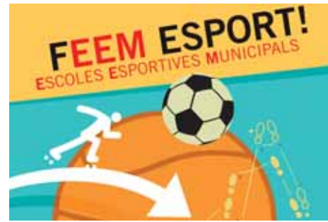
Escoles Esportives Municipals Pàg. 8