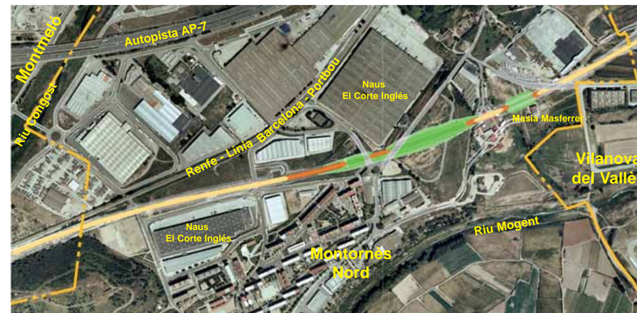
El traçat del TGV al seu pas pel terme municipal de Montornès

La primera zona a la qual es treballarà a Montornès serà la del sector de Can Parellada i els terrenys de la masia Masferrer