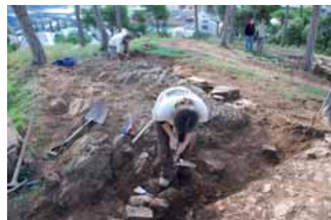
Cinquena intervenció arqueològica a Can Tacó Pàg. 14