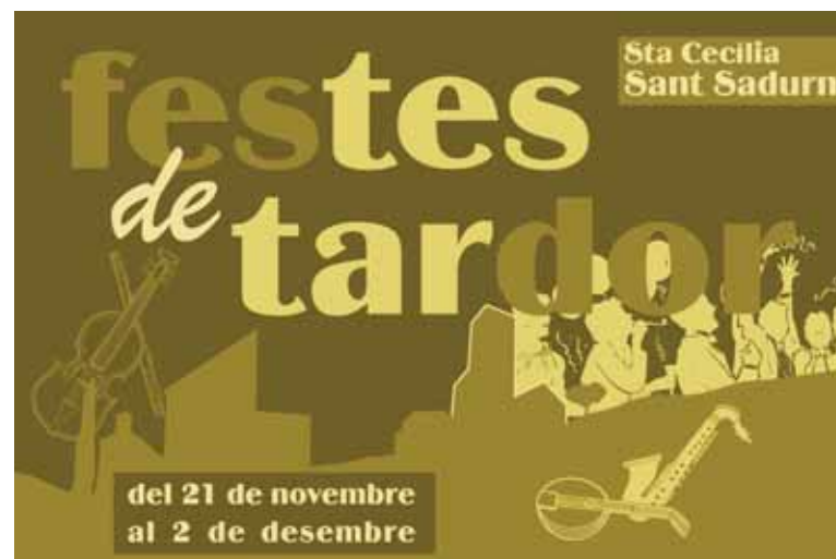
Més informació, pàg. 15