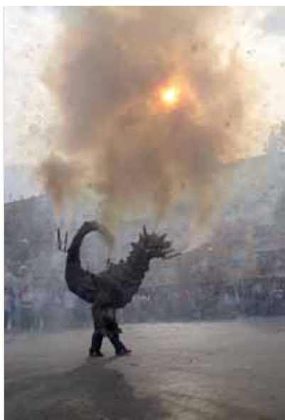
Actuació d'en Ceballot, el Drac de Montornès

L'Aplec, organitzat per l'Associació per a la Difusió del folklore (ADIFOLK), se celebrarà entre el 4 i el 6 d'agost a Frankfurt