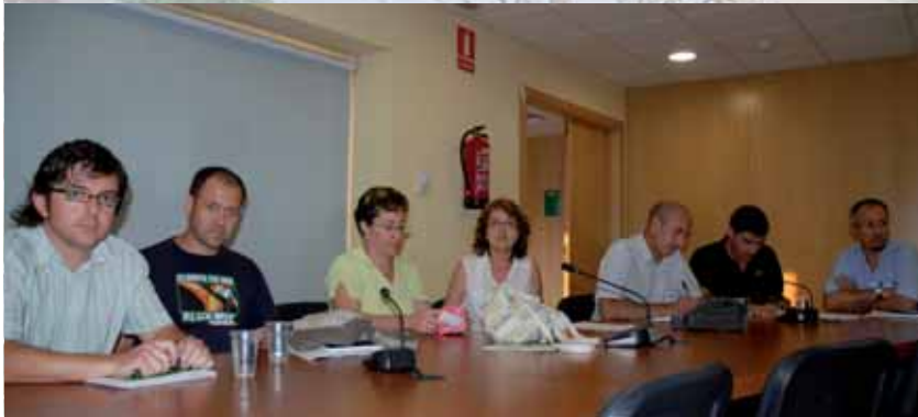
Grup municipal d'ICV-EUiA