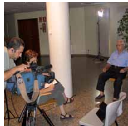
Entrevista a una de les persones grans del municipi

Qualsevol persona pot col·laborar en aquest projecte, aportant fotografies antigues i, especialment, pel·lícules casolanes en format super8 o altres, on es recullin imatges tant dels nuclis urbans de Montornès Centre i Montornès Nord com dels entorns del poble.