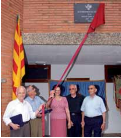
Homenatge als socis més antics i descoberta de la placa commemorativa