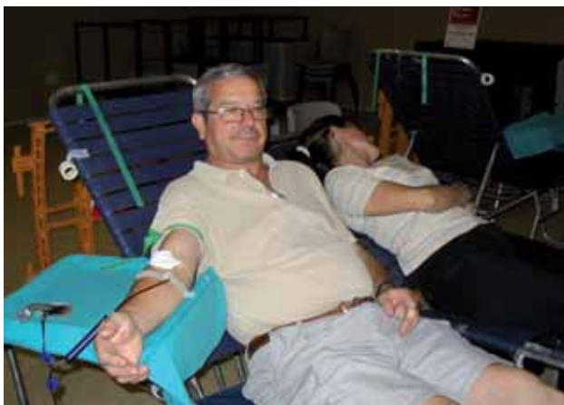
Donació de sang a la I Marató de Montornès

El proper 20 de setembre el Banc de Sang i Teixits instal·larà la unitat mòbil d'extraccions al Centre d'Atenció Primària (CAP). La visita s'inclou en la campanya anual que finalitzarà a Montornès el 20 de desembre.