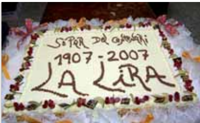
El pastís del centenari

Segons consta als estatuts, la Societat Coral la Lira es va constituir el 16 de juny de 1907, tot i que oficiosament ja existia des de final del segle XIX, la qual cosa la converteix en la més antiga de Montornès.