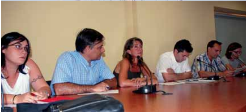
Grup municipal del PSC