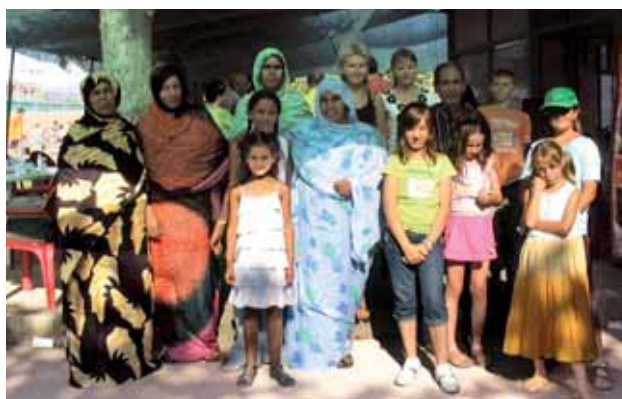
Infants amb els monitors que els han acompanyat en el viatge

En el cas dels infants sahrauís, aquest és el dotzè any que Montornès participa en el projecte organitzat per la delegació del Front Polisari de Catalunya, l'Associació d'Amics del Poble Sahrauí i el Consell Comarcal.