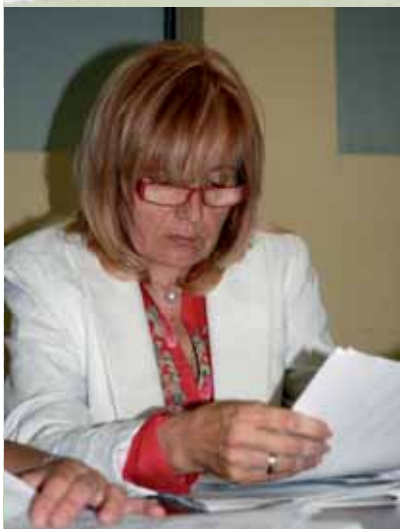
Grup municipal del PP