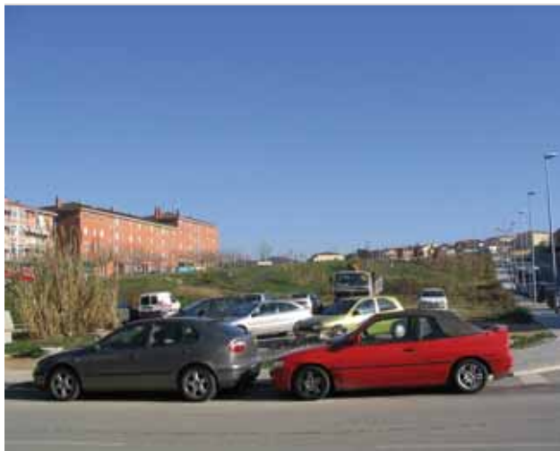
Parc dels Gegants

La UTE CESPÀ SA i Ferroviària Agroman SA té previst dur a terme els treballs de replanteig de la urbanització de la zona a final de febrer.