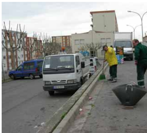
Servei de neteja als mercats setmanals de Montornès

Finalment, els agents de la via pública de l'Ajuntament s'integren en el sistema de control i vigilància municipal tant en la prestació del servei de recollida de residus com en el servei de neteja viària.