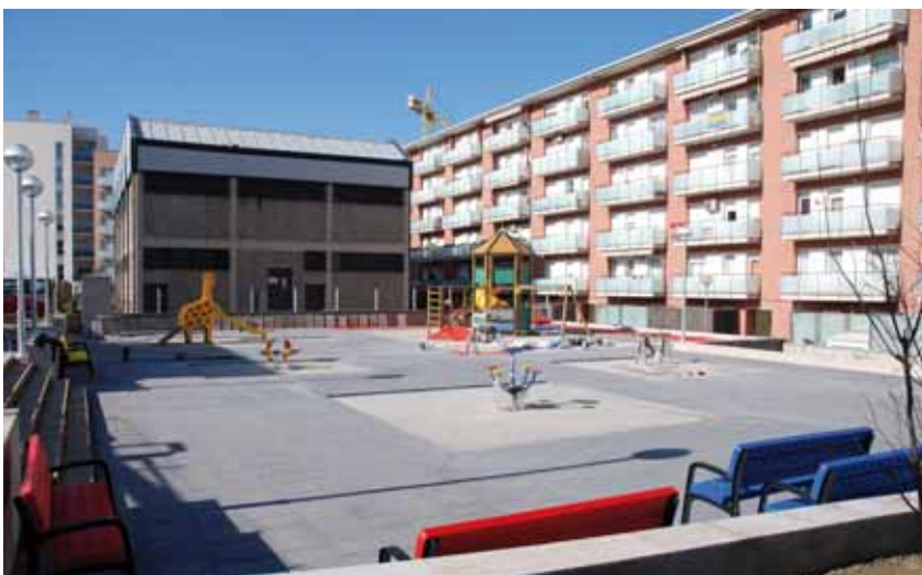
Plaça nova al carrer dels Castanyers

La Brigada Municipal d'Obres enllestirà les obres de condicionament de la plaça que disposa d'una superfície de 738,95 m 2 . A l'espai, s'hi han instal·lat jocs infantils amb terra de cautxú.