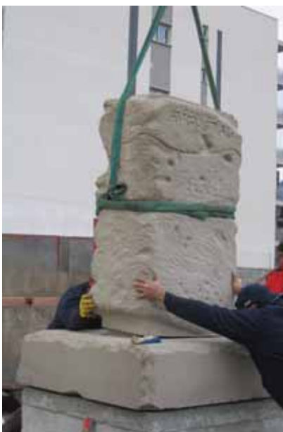
Feines d'instal·lació del Terminus Augustalis

El Servei d'Arqueologia de la Generalitat de Catalunya va determinar que es tractava d'un senyal de la via pública, és a dir, la van identificar com a un terminus augustalis . Per la seva forma i el seu volum, és un exemplar únic a Catalunya.