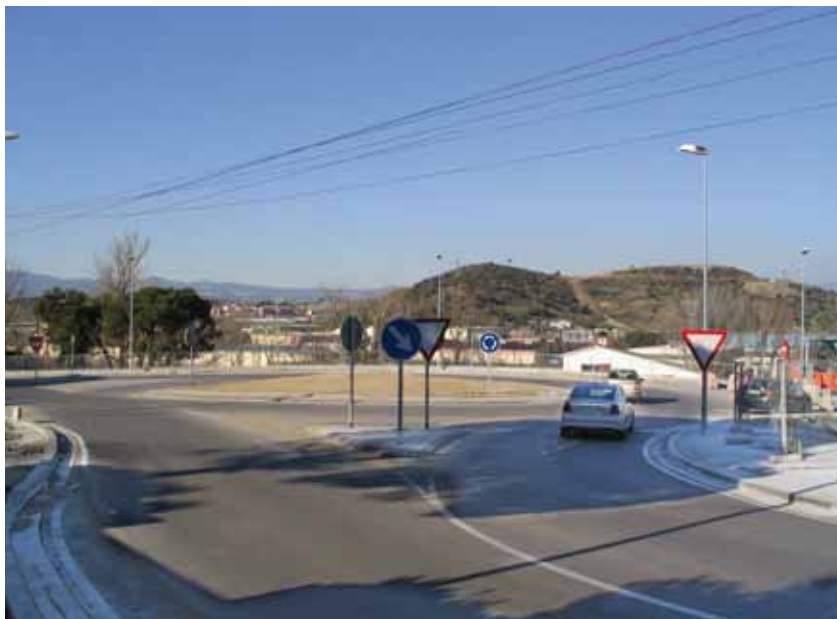
Rotonda a la confluència de les avingudes de Barcelona i d'Ernest Lluch

terme Terminus Augustalis presideix la rotonda situada a la cruïlla entre les avingudes de la Llibertat, de Can Vilaró i d'Ernest Lluch.