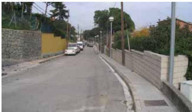
Vista del carrer de Princesa Sofia, a tocar de Joan Carles I