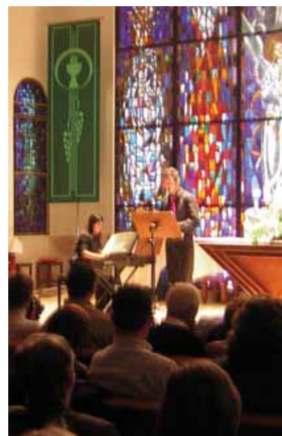
Un moment del primer concert del cicle

Tots dos són músics molts joves i han estat alumnes de l'Escola Municipal de Música, amb la qual mantenen la relació.