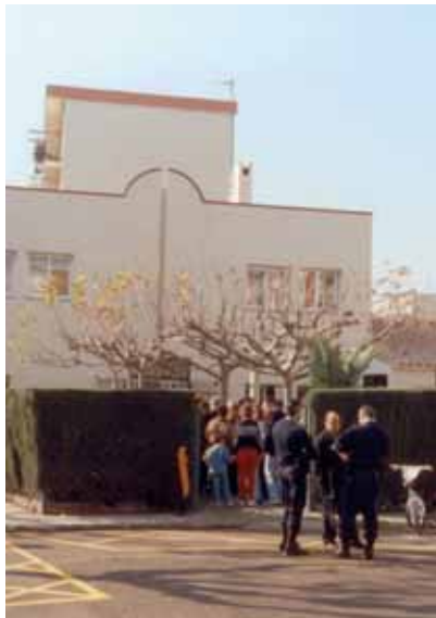
Inauguració del CIJC, al novembre de 2001

L'objectiu del concurs que s'ha convocat és dotar l'equipament amb un nom i una imatge que identifiqui plenament el sentit de l'activitat que s'hi desenvolupa: l'educació d'infants i joves del municipi en el seu temps de lleure.