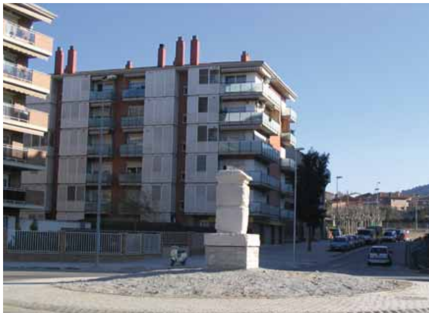
La peça presideix la rotonda a la cruïlla de les avingudes de la Llibertat, Can Vilaró i d'Ernest Lluch