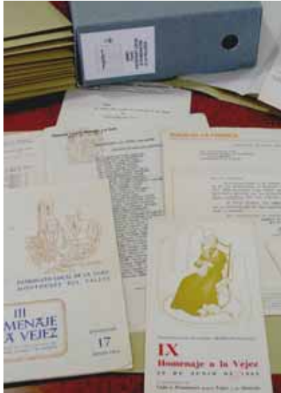
Documents del fons del patronat