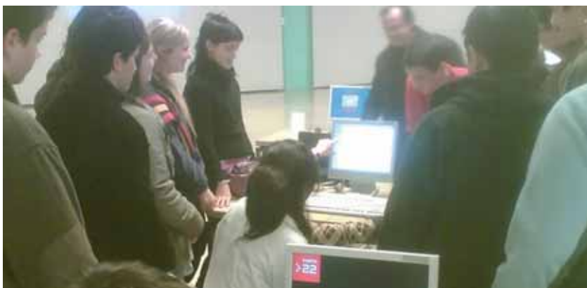
Alumnes de 4t d'ESO van visitar l'espai de noves ocupacions Porta22 de Barcelona Activa.

Una visita al Saló Estudia, entre els dies 21 i 25 de març, clourà les activitats del programa local d'orientació laboral i acadèmica.