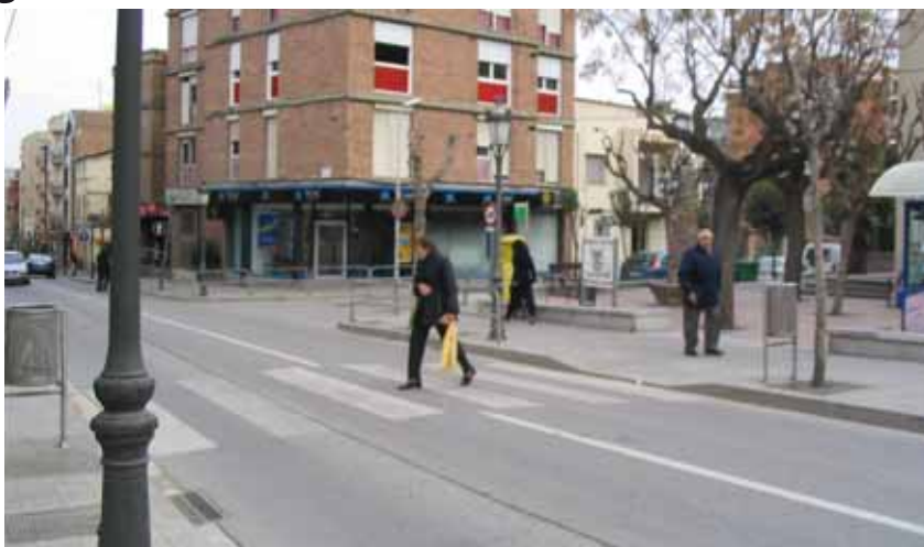
Pas de vianants al davant del Casal dels Avis de Montornès Centre

L'Ajuntament ha adjuntat a la sol·licitud un informe emès per la Prefectura