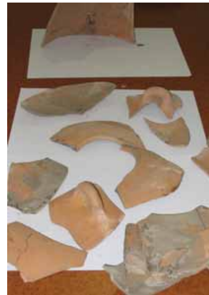
Peces iberes del castell de Sant Miquel

La restauració de les peces va a càrrec dels mateixos experts que han participat en la restauració de part de les troballes del jaciment arqueològic de Can Tacó - Turó d'en Roina.