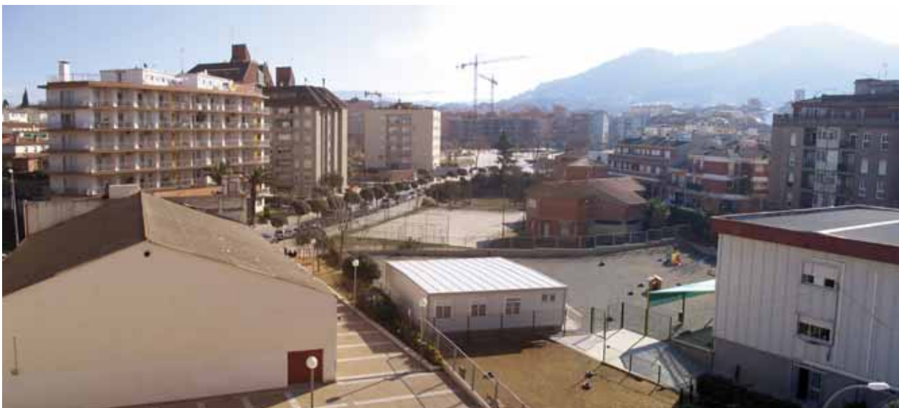
Vista panoràmica de la zona que inicialment es proposa per a la creació d'un centre d'instal·lacions culturals polivalents

Tècnics de l'àrea de Cultura de la Diputació de Barcelona treballen en un estudi sobre els usos, les necessitats i els recursos de Montornès en l'àmbit cultural.