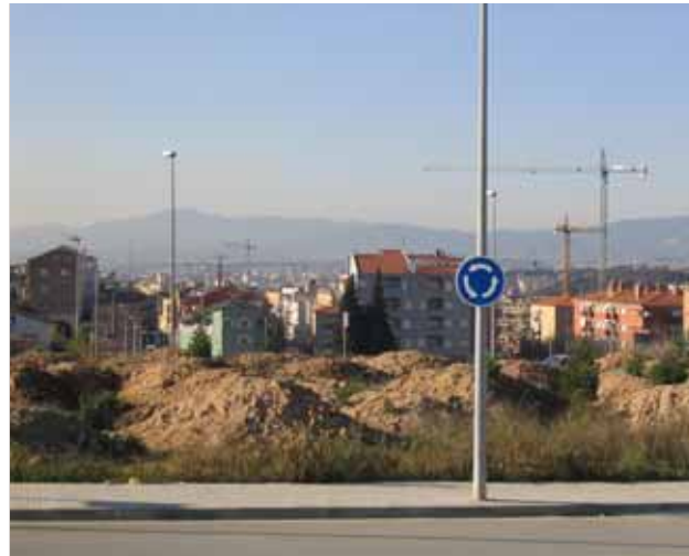
Plaça dels Remences

El parc dels Gegants i la plaça dels Remences estan situats entre els carrers de Francesc Layret, Narcís Monturiol i Major.