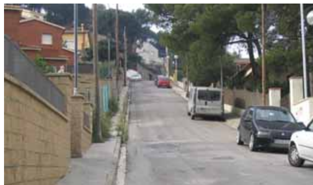
Vista del carrer de Catalunya (a dalt) i del carrer de Joan Carles I (a baix)

La Junta de Govern Local va aprovar la contractació dels treballs a l'empresa REQUENA Societat Anònima per un import de 192.206,25 euros.