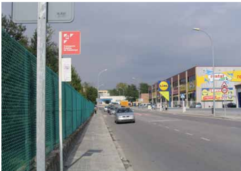
Parada de bus al vial Mogent