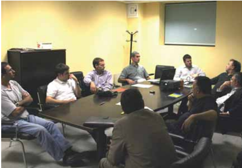
Sessió de debat celebrada a l'Ajuntament de la comissió d'infraestructures

Aquest mes de novembre continua el procés de debat estratègic inclòs en el projecte d'elaboració del Pla Director de la Societat de la Informació i del Coneixement per als municipis de Montornès, Montmeló, Vilanova i Vallromanes.