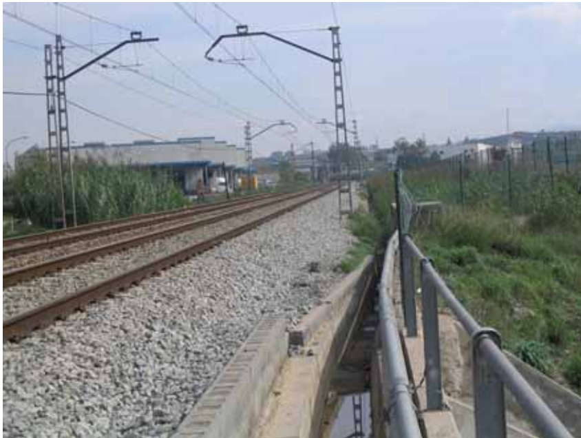
Línia de rodalies de Renfe a Montornès

Així les coses, l'endemà del referèndum sobre la reforma de l'Estatut, el