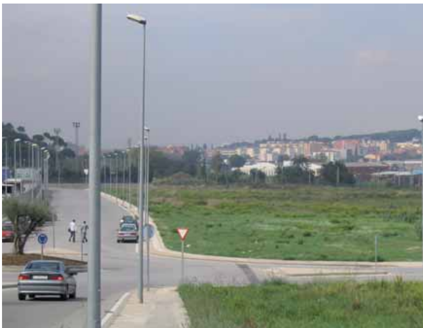
Terrenys proposats als carrers del Vallès i d'Antonio Machado

A més, l'estació de Montornès Nord permetria situar una parada a uns 400 metres dels 4.500 habitants de Montornès Nord i a un quilòmetre i mig del centre urbà.