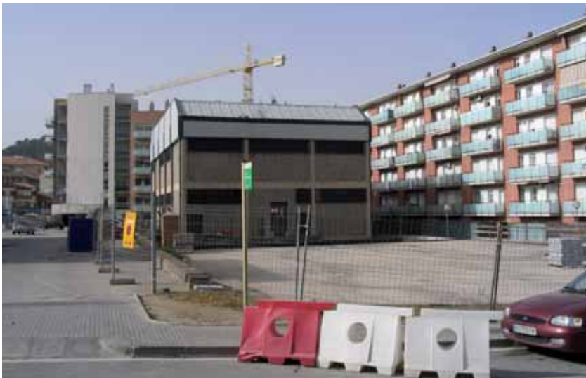
Espai per a la plaça nova al carrer dels Castanyers

Després de la retirada de l'antena de telefonia mòbil a l'avinguda de la Llibertat, l'Ajuntament crearà una plaça a l'espai públic situat al darrera de l'edifici de Telefònica