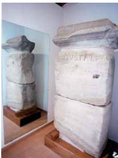
Terminus Augustalis, pedra de terme de Montornès, esposada a Can Xerracan

Del 19 de desembre al 14 de gener, la regidoria de Cultura engegarà un programa d'activitats amb l'objectiu de promoure el patrimoni històric local heretat de l'estada dels romans al municipi (segles I i II abans de crist)