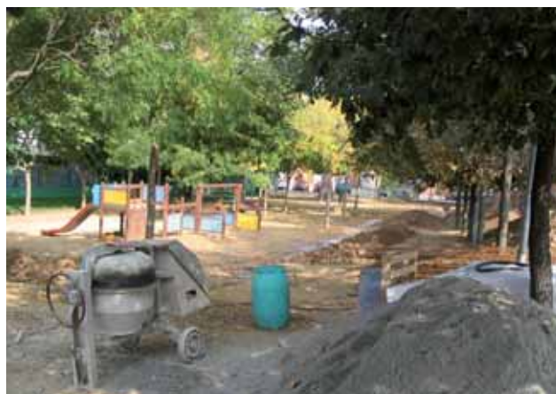
Obres a la plaça de l'Autonomia

Les places de Lluís Companys i de l'Autonomia han estat objecte de diverses obres de condicionament. En el cas de la plaça de Lluís Companys, la Brigada Municipal d'Obres ha fet treballs de pavimentació, col·locarà un terra de cautxú sintètic i instal·larà bancs nous. A la plaça de l'Autonomia continuen les feines d'arranjament per a la instal·lació de jocs infantils amb un terra de cautxú sintètic, la remodelació de la zona enjardinada, la ubicació de bancs i papereres, i la construcció de rampes per facilitar l'accés a les àrees que tenen desnivell.