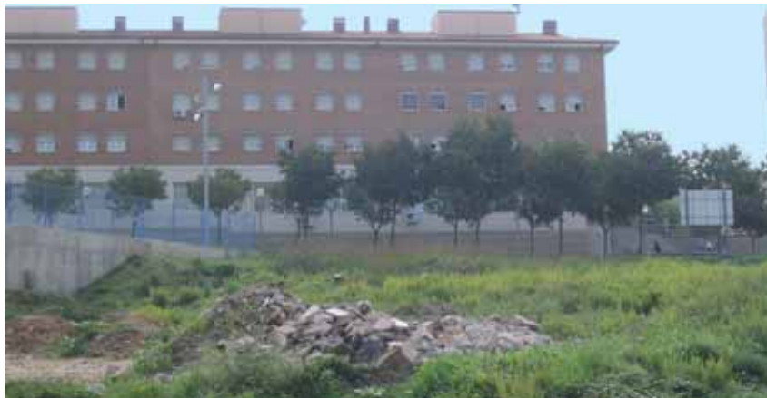
Terrenys proposats per a un equipament medicoassistencial al carrer Vallès

Per desenvolupar aquest projecte, la Junta de Govern Local va ratificar, el passat 28 de setembre, el conveni signat entre l'Ajuntament i l'empresa Altax Promotora SL que recull la col·laboració entre ambdues parts per a la construcció d'un equipament a Montornès Nord.