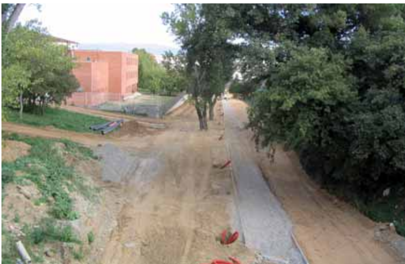
Tram del torrent de Vinyes Velles, des de l'avinguda de Barcelona

Des de fa unes setmanes, les promotors d'habitatges de la unitat d'actuació número 6 Manso Calders porten a terme les obres per a la urbanització del segon tram del torrent comprès entre l'av. de Barcelona i la d'Ernest Lluch. Des d'aquest punt, el nou passeig connectarà amb les avingudes de Can Vilaró i de la Llibertat.