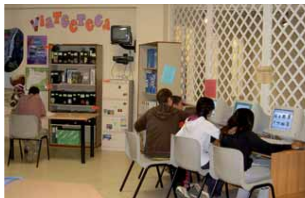
Espai del Punt Jove al Casal de Cultura

A més de complir les funcions associades a un punt d'informació, el Punt Jove ha participat en l'elaboració del Pla Jove Local i en la posada en marxa de propostes formatives.