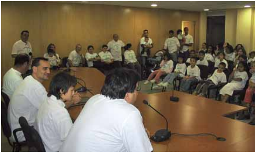
Recepció institucional a la Sala d'Actes de l'Ajuntament

Companys del Club Karate Montornès, familiars i amics de l'esportista van assistir a la recepció.