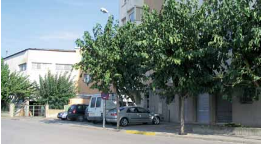
Ubicació prevista per al centre al carrer de Federico García Lorca

La Junta de Govern Local, reunida en sessió ordinària el 19 d'octubre, va acordar la sol·licitud d'ajut per part de l'Ajuntament al govern autonòmic per adequar un local situat al barri de Montornès Nord i destinar-lo a la creació d'un consultori local d'atenció comunitària que dependrà del Centre d'Atenció Primària.