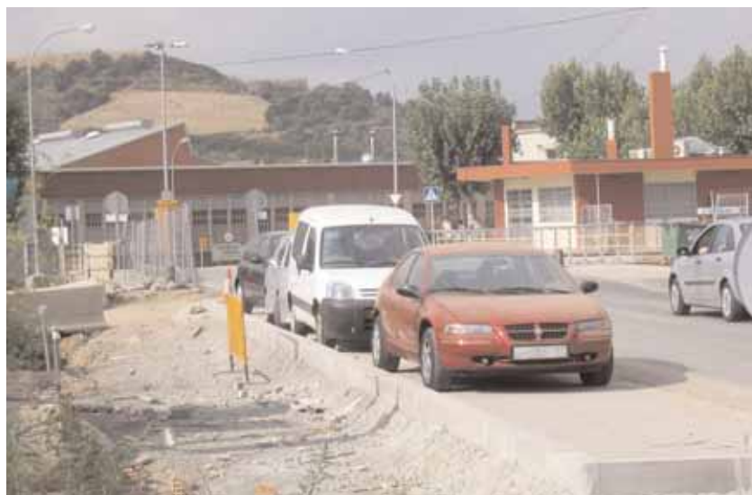
Futura ubicació d'una nova parada de bus a l'avinguda de la Llibertat

Aquesta línia específica per a zones industrials és la primera que s'implanta a la comarca i està inclosa en el sistema de tarifa integrada de l'Autoritat del Transport Metropolità (ATM)