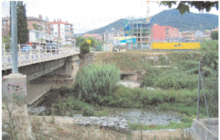
Riu Mogent al pas pel pont de l'avinguda de la Llibertat

govern autonòmic en les obres del col·lector ha estat reclamada per Montornès, de forma reiterada, els darrers mesos.