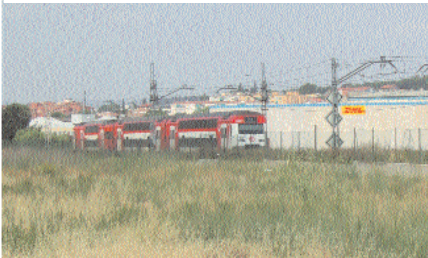
Pas del tren de rodalies per la zona proposada per a l'abaixador

La reivindicació reiterada d'un abaixador a Montornès data dels anys 60 i 70 del segle XX.