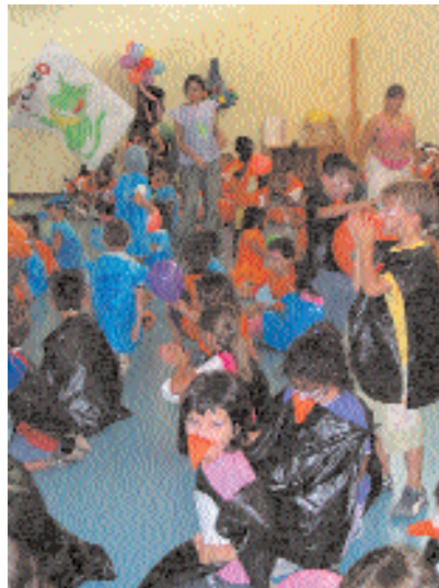
Activitats del Casal d'Estiu per als grups de petits i mitjans a l'escola Can Parera