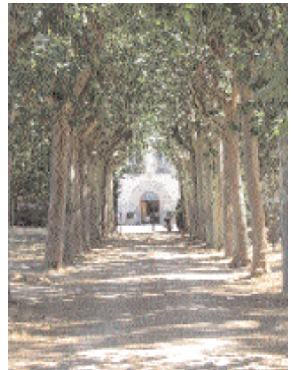
Accés a l'IES Vinyes Velles

El mes de juny, l'Ajuntament i el departament d'educació de la Generalitat van arribar l'acord de remodelar, durant el curs 2005 - 2006, l'edifici que es troba situat al davant de l'escola de Montornès Nord.