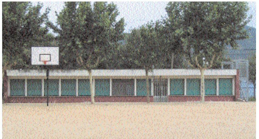
Edifici de l'AMPA Marinada

Actualment, l'escola d'adults està ubicada a les aules de l'escola Marinada.