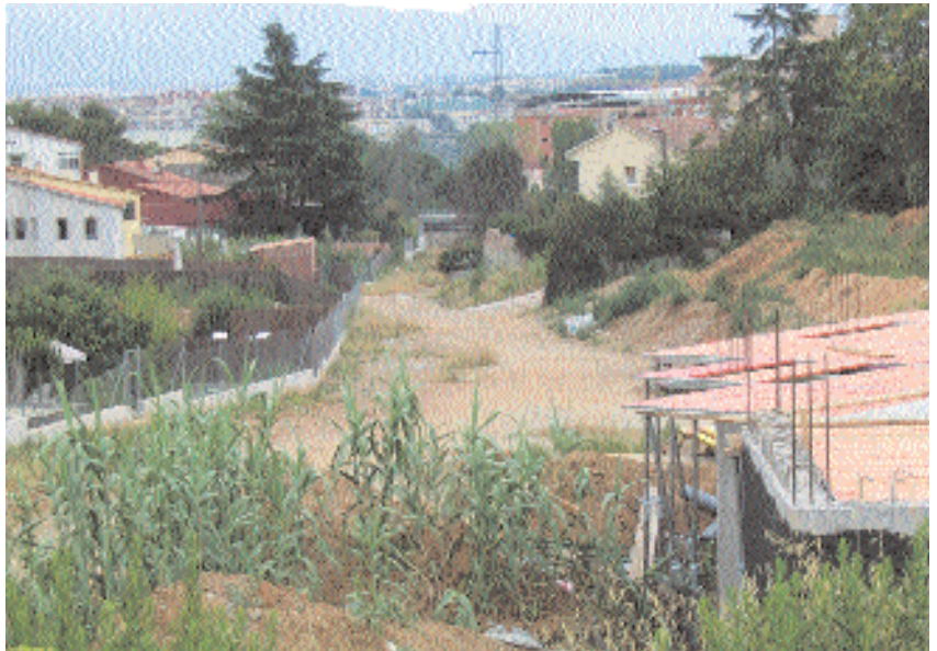
Vista del torrent de Vinyes Velles des de Can Coll

El proper mes de setembre s'iniciaran els treballs d'urbanització del futur parc del torrent de Vinyes Velles.