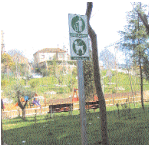
Senyalització a la plaça de les Feixes

L'any 2003 l'Ajuntament i l'Associació de Voluntaris de Protecció Civil van signar un conveni de col·laboració que concretava el suport de l'associació en tasques de caire social i en la vigilància de zones forestals i en la prevenció d'incendis.