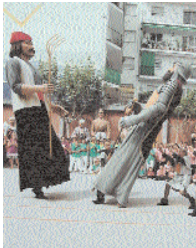
Dansa de la Batalla de Montornès

Abans de la Festa Major i aprofitant que l'Onze de setembre s'escau en diumenge, les regidories de Cultura i Festes han organitzat activitats per al cap de setmana que s'afegiran als actes tradicionals de commemoració de la Diada.