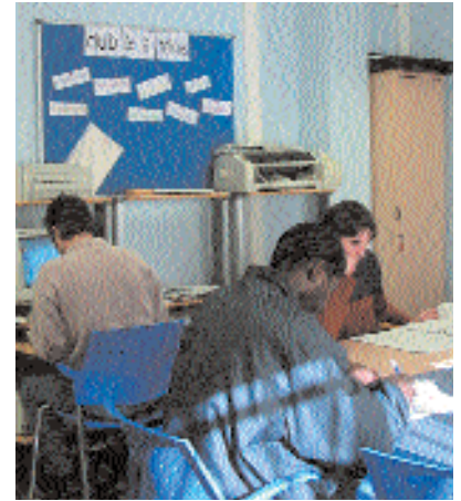
Club de feina

El proper mes de setembre el Servei Municipal de Promoció Econòmica de l'Ajuntament i empreses ubicades a Montornès signaran un protocol d'intencions per establir un marc de col·laboració entre ambdues parts.