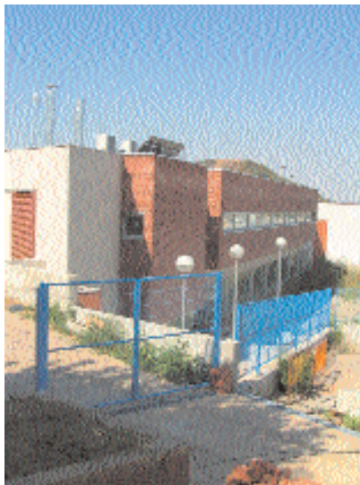
Escola bressol, al carrer Vallès

Paral·lelament a les pre-inscripcions per als futurs usuaris de l'escola bressol, l'Ajuntament ha convocat les