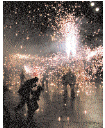
Correfoc amb la colla de Drac i Diables