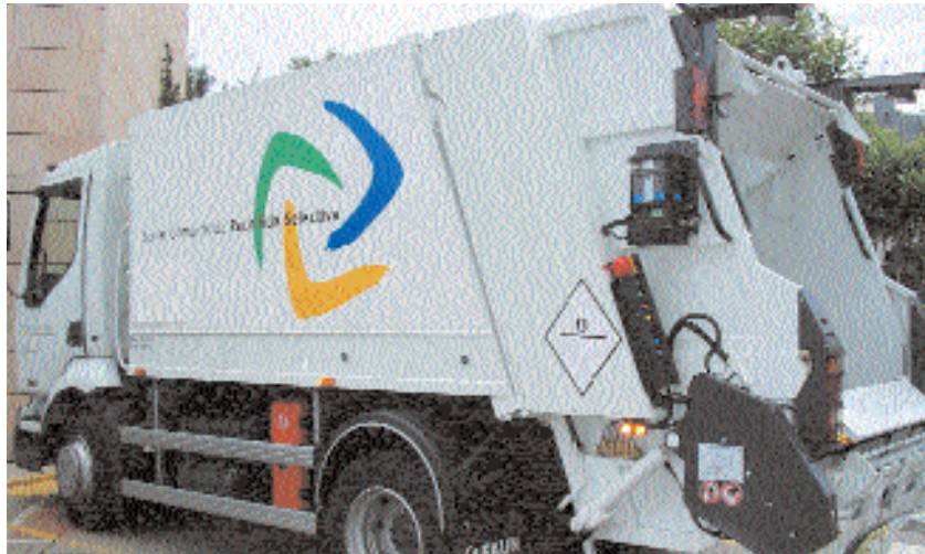
El vehicle de recollida selectiva segueix un itinerari pels comerços de Montornès

Els establiments d'hosteleria assagen l'ús de contenidors de proximitat per a la recollida selectiva del vidre