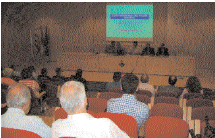
Acte de presentació del servei a l'Ajuntament de Montmeló

Per obtenir la certificació, el departament de Promoció Econòmica ha estat objecte d'avaluacions exhaustives en la gestió de la borsa de treball, en el servei d'emprenedors, en el club de feina i en la realització de cursos de formació ocupacional.