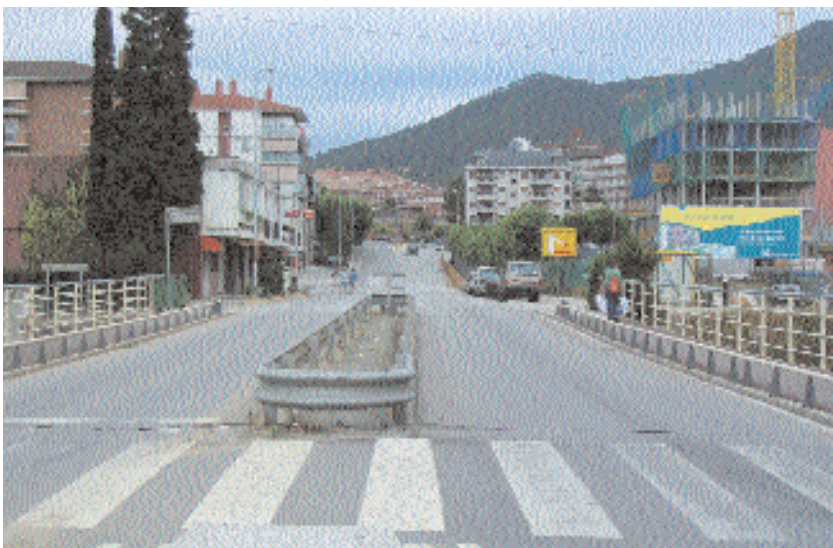
Vista de l'avinguda de la Llibertat

El termini d'execució previst de les obres de remodelació del col·lector de Can Torrents és de setze mesos.