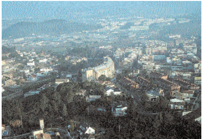
Vista aèria de Montornès

L'Agenda 21 va ser aprovada pel Ple Municipal l'any 2001. Aquest document recull els compromisos de sostenibilitat i les línies estratègiques en matèria de medi ambient, d'acord amb