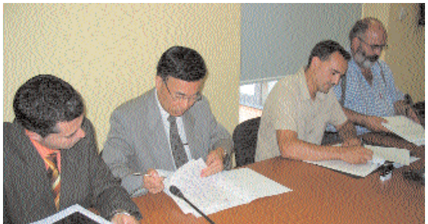
D'esquerra a dreta, directius de Fenocast, amb l'alcalde i el regidor de Medi Ambient

zemat dels residus i de les matèries primeres de la indústria. Aquest conveni es va renovar en el mateix acte de signatura del Pacte local per a la qualitat de l'aire.