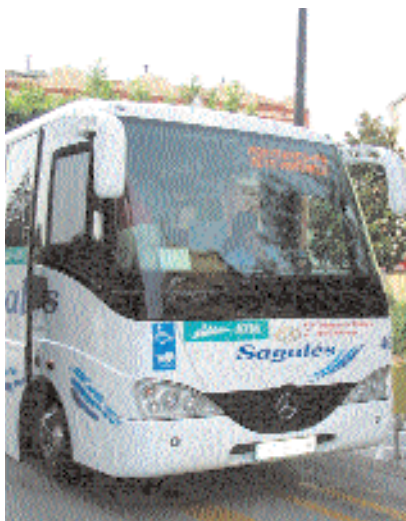
Bus del servei de transport públic per als polígons industrials

Des de fa més un any, Montornès, Montmeló i Parets del Vallès han treballat per a aquest projecte que ha comptat amb el suport de la Diputació de Barcelona i l'assessorament tècnic de la Fundació del Reial Automòbil Club de Catalunya, el RACC.