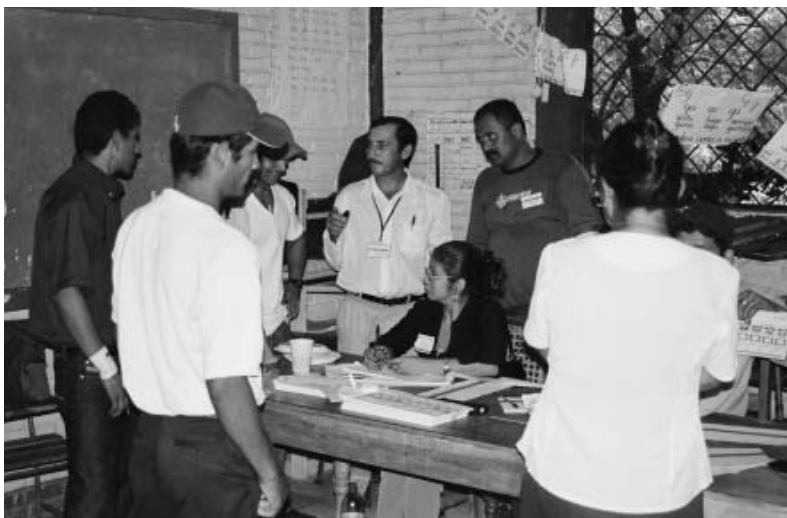
Eleccions municipals a Nicaragua

Montornès ha col·laborat en els darrers anys en la construcció d'aules escolars i l'adequació d'un espai municipal destinat a Biblioteca - Auditori. Els dos darrers projectes en què ha col·laborat Montornès per mitjà de la Fundació Pau i Solidaritat al Vallès Oriental han estat el