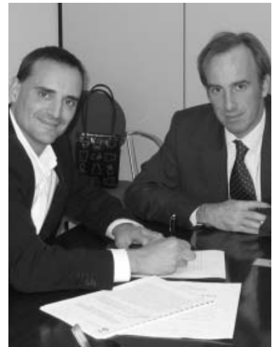
Acte de signatura del conveni

Aquest futur equipament municipal es destinarà a la gent gran i substituirà l'actual seu del Casal dels Avis de Montornès Centre, situada a l'avinguda de l'Onze de Setembre.