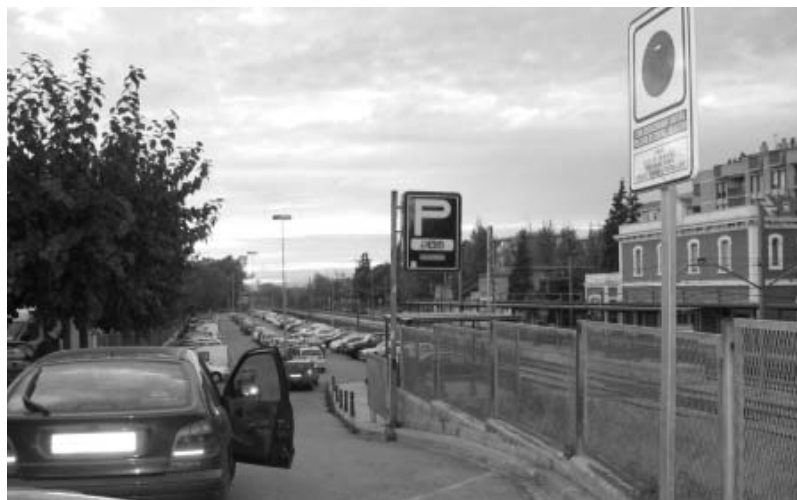
Entrada a l'aparcament de l'estació de RENFE a Montmeló

Els alcaldes i regidors de Promoció Econòmica dels Ajuntaments de Montornès, Montmeló i Parets del Vallès van presentar al mes d'octubre al president de l'Autoritat del Transport Metropolità (ATM), Ramon Saró, una proposta de transport públic intermunicipal que uneixi les zones industrials i les urbanes dels tres pobles.