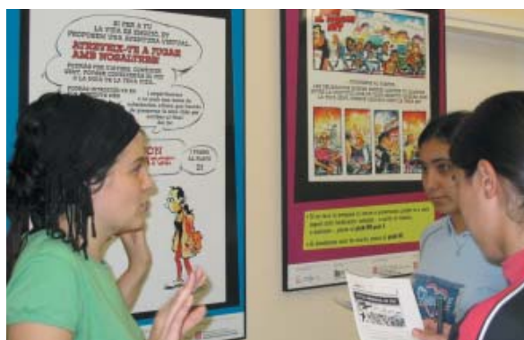
"Febre del Divendres Nit" a la sala Riu Mogent del Casal de Cultura

En aquesta línia, el 16 de novembre es va fer un taller de sexualitat per a pares i mares, al local de l'Associació Els Angels ASPAHID. Entre el 24 de novembre i el 3 de desembre, el punt Jove, l'IES Vinyes Velles, la Biblioteca i el CIJC, disposaran de l'exposició "Què pinta la SIDA", al voltant de la qual també es portaran a terme diversos tallers.