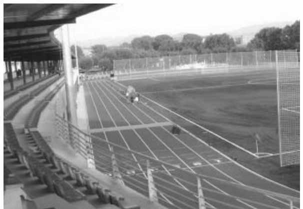
Els camps de futbol i la pista d'atletisme es gestionen directament des de l'Ajuntament

La concessionària Gestió Esportiva Montornès presentarà als usuaris de les instal·lacions esportives (pavelló, pista poliesportiva, pistes de tennis i frontennis, piscina d'estiu i la nova piscina coberta) els serveis i els nous abonaments. Les persones que van formalitzar una pre-inscripció per a la piscina coberta, rebran una carta informativa.