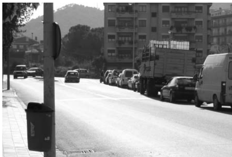
Avinguda de la Llibertat

Els treballs consistiran en la construcció d'un nou col·lector de la xarxa primària, l'anul·lació o demolició del col·lector existent i l'adaptació de les xarxes secundàries de clavegueram.