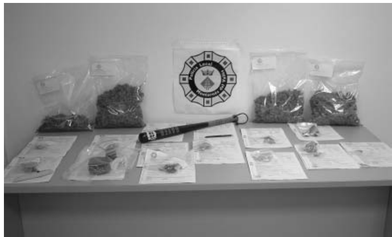
Diverses substàncies i objectes intervinguts per la Policia Local de Montornès

D'altra banda, l'Ajuntament té la intenció d'obrir a començaments del proper any una oficina de queixes ciutadanes que depengui de la prefectura de la Policia Local. Els veïns podran presentar per escrit les seves queixes, suggeriments o peticions.