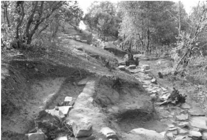
Mur perimetral de les troballes arqueològiques de Can Tacó - Turó d'en Roina

Durant les darreres setmanes s'ha portat a terme la segona campanya de prospeccions arqueològiques al jaciment de Can Tacó - Turó d'en Roina, prop de les Tres Creus.