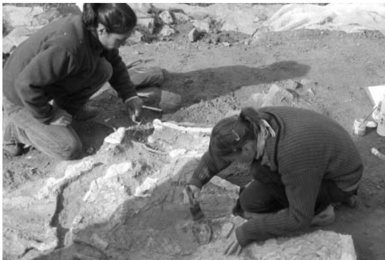
Descobriments de l'estuc que conté pintures de l'època pompeiana

Els estudis s'orienten ara a delimitar la funcionalitat de la fortificació, única per les seves característiques a la península ibèrica.