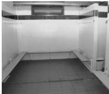
Nous vestidors, sota les grades

Les noves instal·lacions esportives disposen de 8 vestidors destinats al futbol, 2 per a àrbitres i 2 vestidors més per a l'atletisme. Les grades tenen capacitat per a 550 persones.