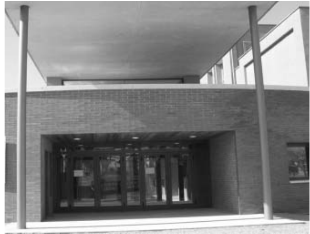
Entrada principal del Complex Esportiu Municipal

A partir del 13 de desembre s'inicia l'activitat del nou Complex Municipal Esportiu Montornès.