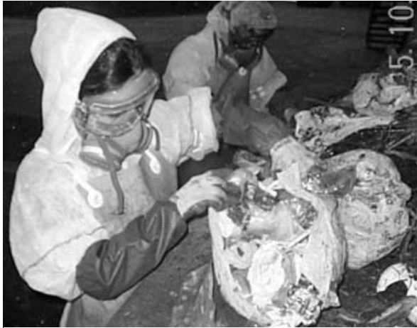
Caracterització d'impropis en la matèria orgànica

L'Ajuntament ha intensificat la campanya d'informació i sensibilització per a la recollida selectiva dels residus urbans, Montornès, cada dia més net i sostenible .