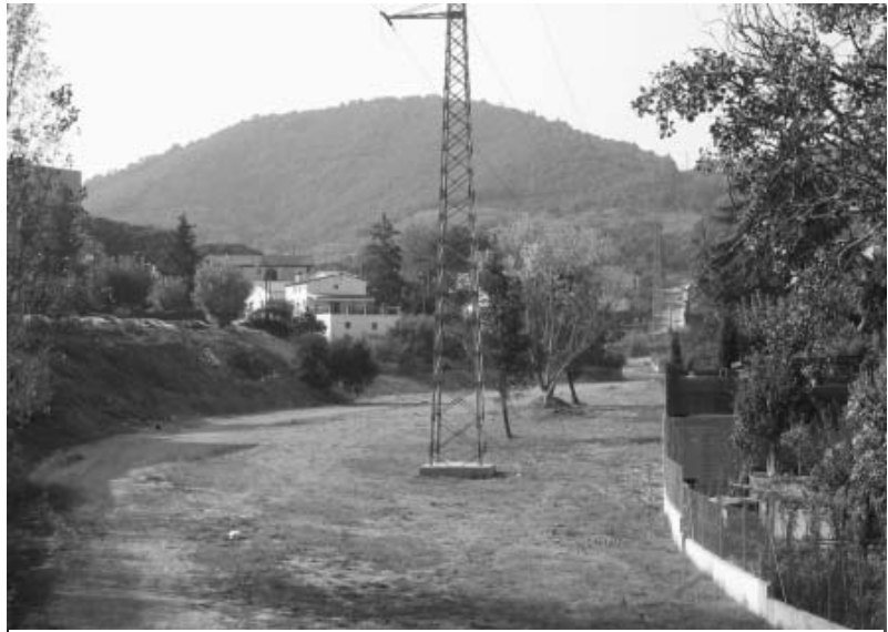
Vista del torrent de Vinyes Velles des del pont de l'Av. Barcelona

El projecte bàsic i d'execució del parc del torrent de Vinyes Velles va ser aprovat, de forma inicial i per unanimitat, a la sessió plenària celebrada el dia 7 d'octubre.