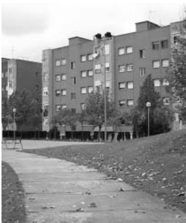
El pla inclou propostes per a l'habilitació d'ascensors