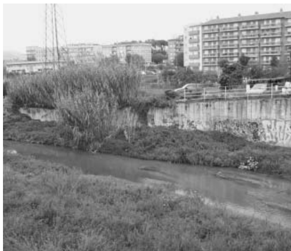
Pas del riu Mogent a l'alçada del Casal de Cultura

El ple de l'Ajuntament va aprovar de forma inicial i per unanimitat a la sessió ordinària celebrada el 9 de setembre la modificació puntual del Pla General d'Ordenació Urbana per a la desafectació dels terrenys