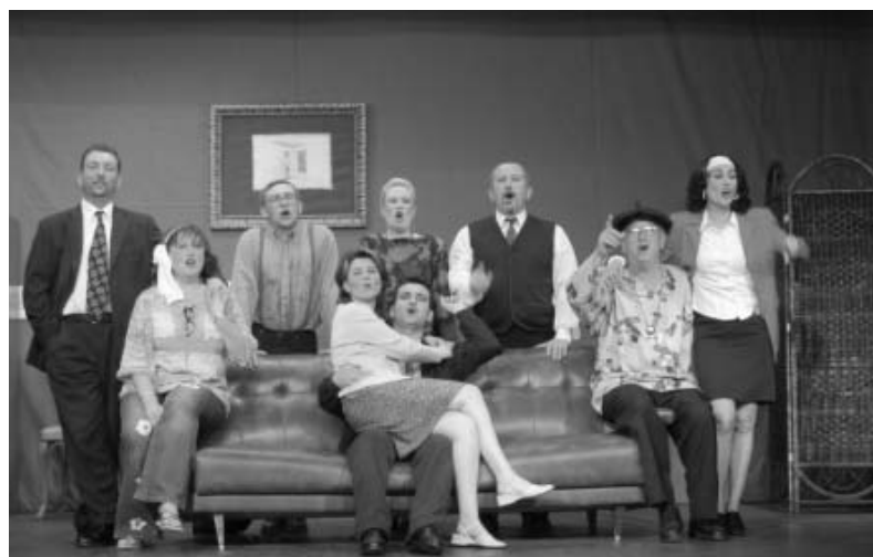
Estrena de l'obra "Pi, Noguera i Castanyer..." al maig de 2004

Després d'un any d'absència aquest mes de novembre ha tornat a Montornès el Cicle de Teatre Amateur, amb gran èxit de públic.